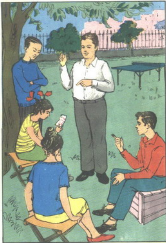
وجلس الأصدقاء يتحدثون . . . وكل منهم يحمص ورقة الكوتشينة .