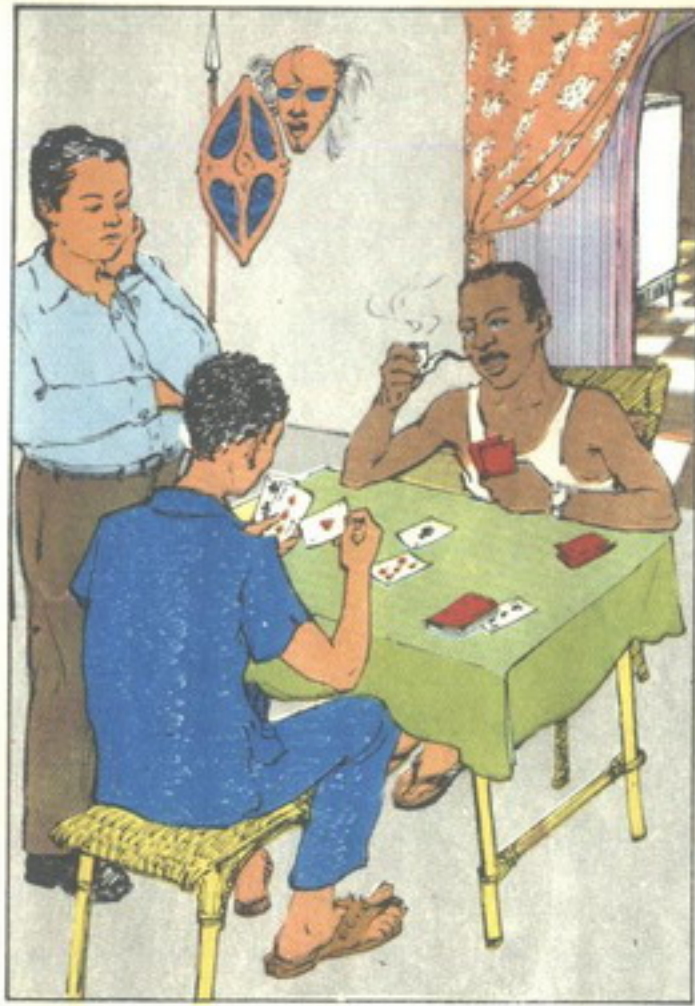
وجلس الصديقان بلعبان الكوتشينة و « تختخ » يراقبهما ليرى هل الكوتشينة ناقصة . .

إيبو : في الحقيقة إنني لم اشتريها بعد ، إنها ملك أحد رجال سفارة نيجيريا . . في القاهرة . وهو قريبي ، وقد أعطيته مبلغاً من المال تحت الحساب لأنه مسافر في رحلة إلى فرنسا . . وصدقني أنني ندمت على دفع هذا المبلغ فلست أدرى متى تصلني نقود أخرى من أبي .