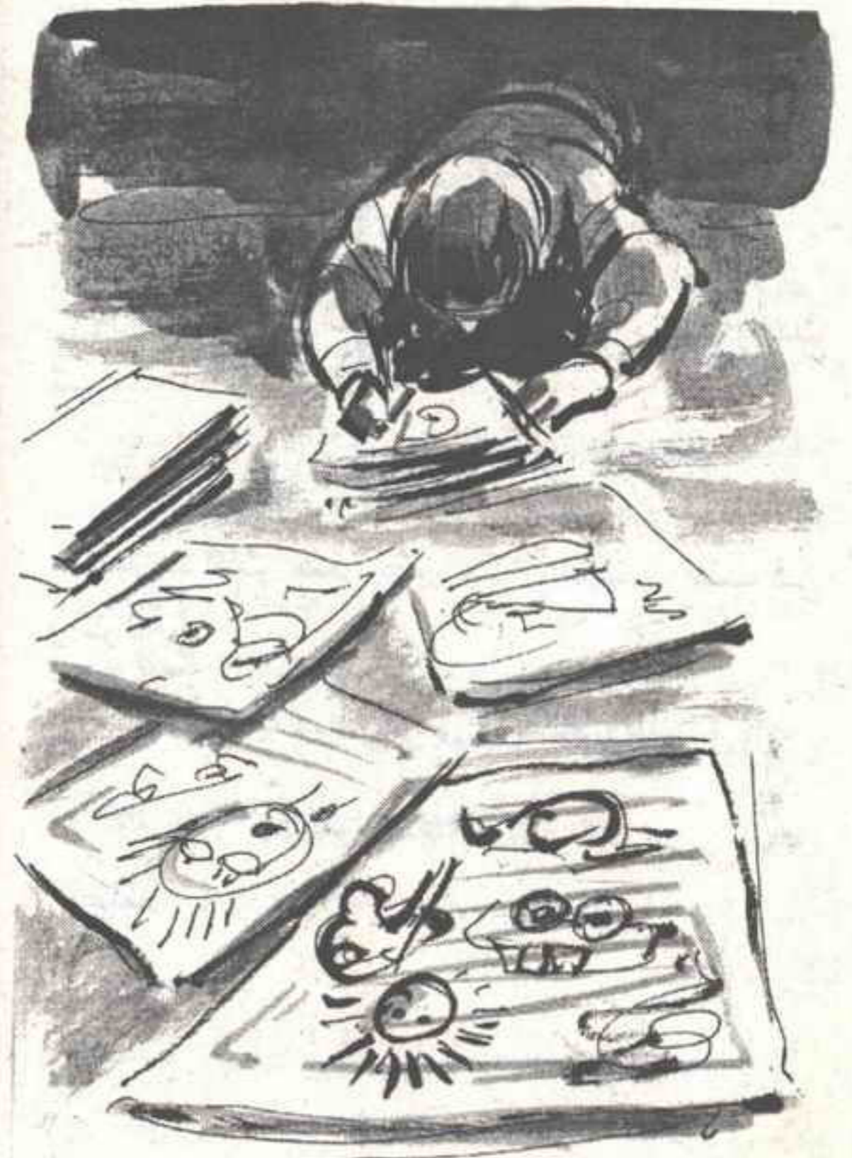
رسمت أرنوبيا وبطة في ورق طائط ( كاميليا ) ..