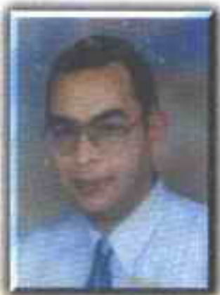
د. احمد خالد توفيق

كلا .. لن تكون هناك اليوم قلاع مسكونة .. لا .. ولا مصاص دماء يفتح عينيه في ظلام قبو .. ولا حتى مسخ ذئب يتربص خلف الأشجار في ضوء القمر .. لن تكون هناك أشياء تتحرك ولانباتات وقحة ، ولا تعاويذ قديمة اطلقها كهنة (الإزتك) سريعو الغضب .. لأشياء من هذا .. لأنها أسطورة تظلف ..!