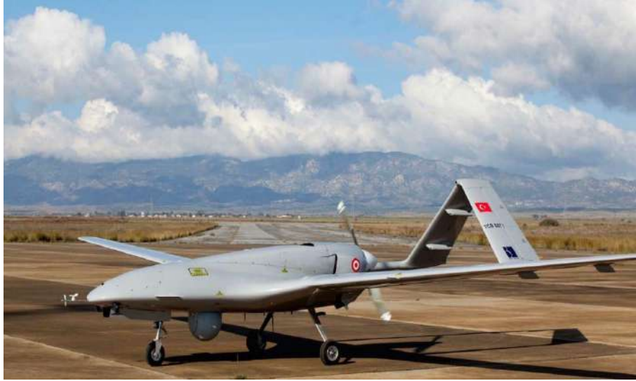
طائرة "بيرقدار" المسيرة

بعد نجاحها بأوكرانيا.. تركيا تطوّر طائرة مسيرة تنطلق من السفن، ولهذه الأسباب تتوقع بيعها لليابان