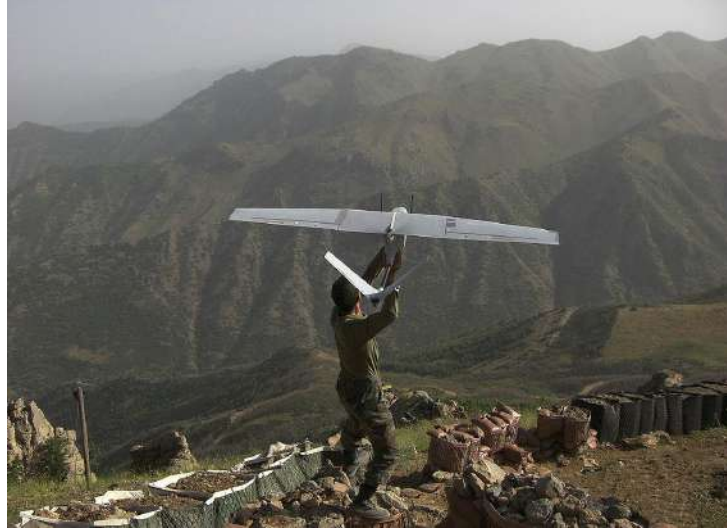
بيرقدار ميني كلاس بدون طيار

بيرقدار ميني هي طائرة بدون طيار مُصغرة تُنتجها شركة بيرقدار التركية.