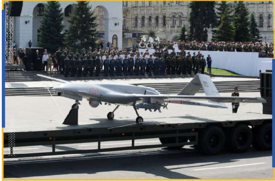
بيرقدار "تي بي 2" TB2 –

سلاح تركية، بمبلغ إجمالي بلغ نحو 60 مليون دولار، وهو رقم أكبر ثلاثين مرة من إنفاق كييف على معدات الدفاع التركية خلال الفترة نفسها من العام السابق. وقد انضمت هذه الدفعة الجديدة إلى نحو 20 طائرة مُسيّرة أخرى من طراز "تي بي 2" كانت أوكرانيا قد اشترتها من تركيا سابقا. وتُعدُّ مُسيّرات "بيرقدار" - ويعني اسمها بالتركية حاملة اللواء- شديدة الأهمية بالنسبة لجهود الحرب الأوكرانية، حتى إنها ألهمت أغنية أوكرانية وطنية انتشرت على مواقع التواصل الاجتماعي انتشارا كبيرا.