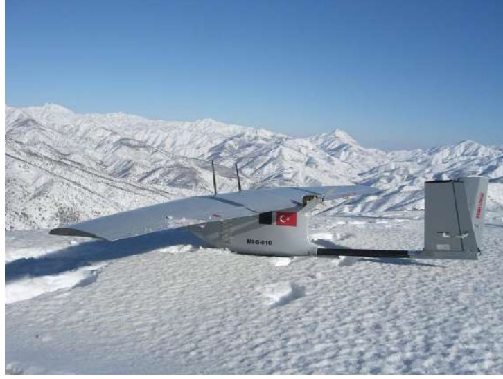
طائرة بيرقدار فوق أرضية من الثلج