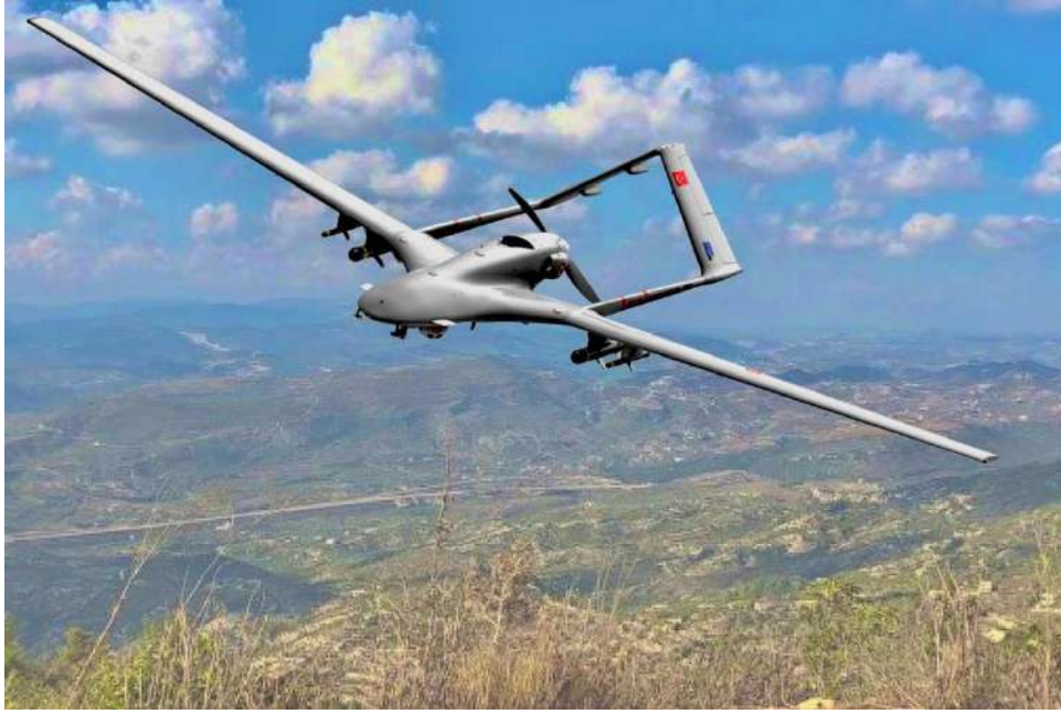
طائرة بدون طيار مسلحة من طراز Bayraktar TB2 تركية الصنع.