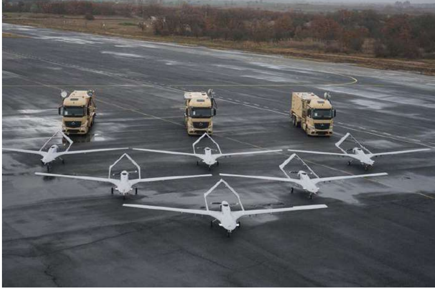
نظام بيرقدار يتكون من ست طائرات مسيرة

يتكون نظام الطائرات المسيّرة "بيرقدار" TB2 من ست مركبات جوية (طائرات) ومحطتين أرضيتين للتحكم والسيطرة، وثلاث محطات للبيانات الأرضية، ومحطتين للفيديو، إضافة إلى معدات للدعم الأرضي.