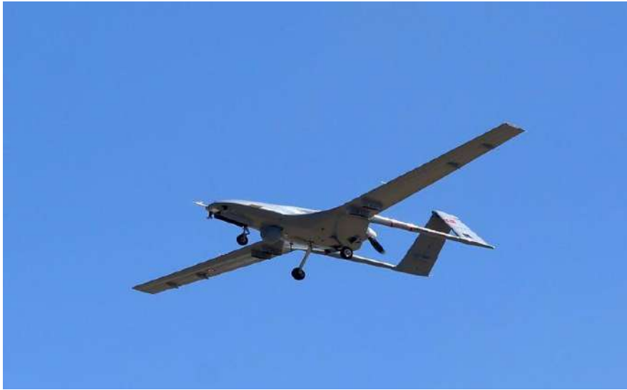
"بيرقدار تي بي 2" أظهرت تفوقا كبيرا في جبهات عدة

ويشير إلى أن هذا النوع من الأسلحة الذي تم استخدامه وقرّ ميزاته مهمة للغاية من حيث دقة الإصابة وقوة الضربات الصاروخية.