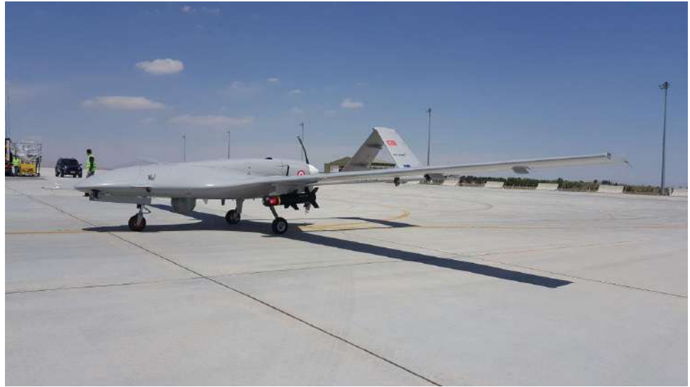
مسيرة بيرقدار تي بي 2 مزودة MAM L.

وكانت كندا قد أوقفت في أوائل أكتوبر تصدير بعض تكنولوجيا الطائرات المسيرة إلى تركيا، وسط تحقيقها في مزاعم استخدام تلك المعدات من قبل القوات الأذربيجانية في القتال ضد الجانب الأرميني في قره باخ.