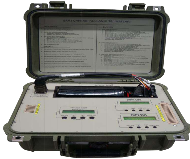
وحدة شحن بطارية الطائرة

تعملُ طائرة بيرقدار منذ عام 2007؛ وقد ساهت في عددٍ من عمليات الجيش التركي بما في ذلك: