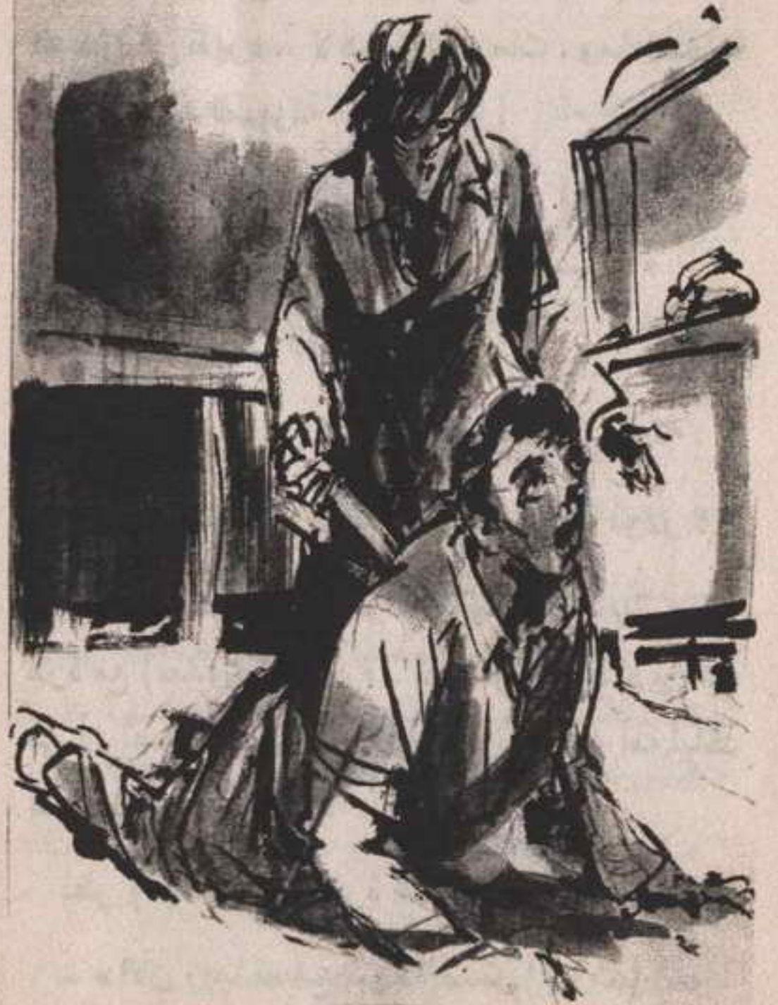
انقض على لكنه تعثر ، وفي اللحظة ذاتها أغمدت السكين في ظهره ..