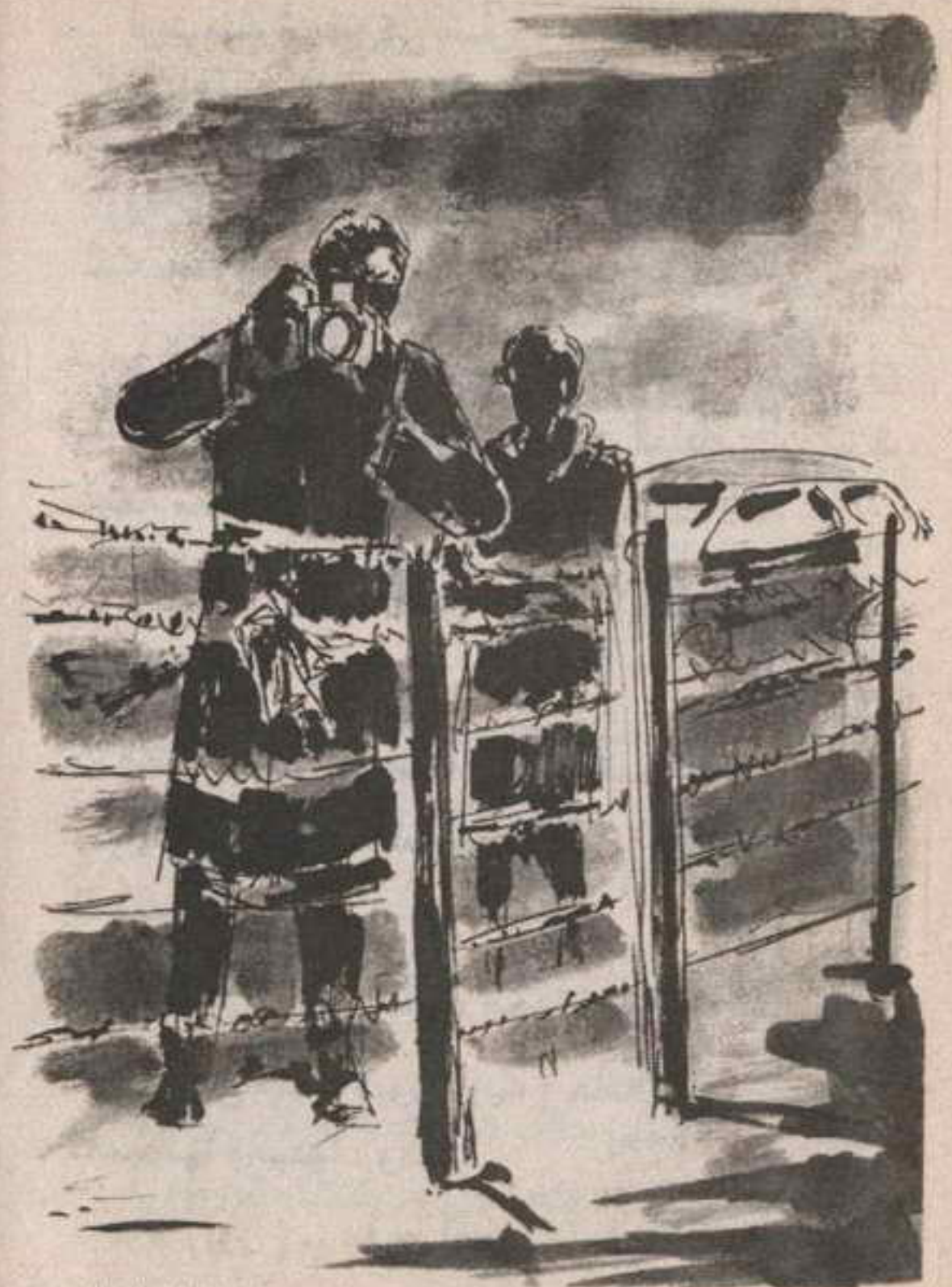
التقط (ميسون) قطعة القماش الممزقة من جيبه، وثبتها على السلك .. ثم أخرج الكاميرا والتقط صورتين للمشهد ..

- « أعرف .. أعرف .. لكنك لا تستطيع إهمال شهادة