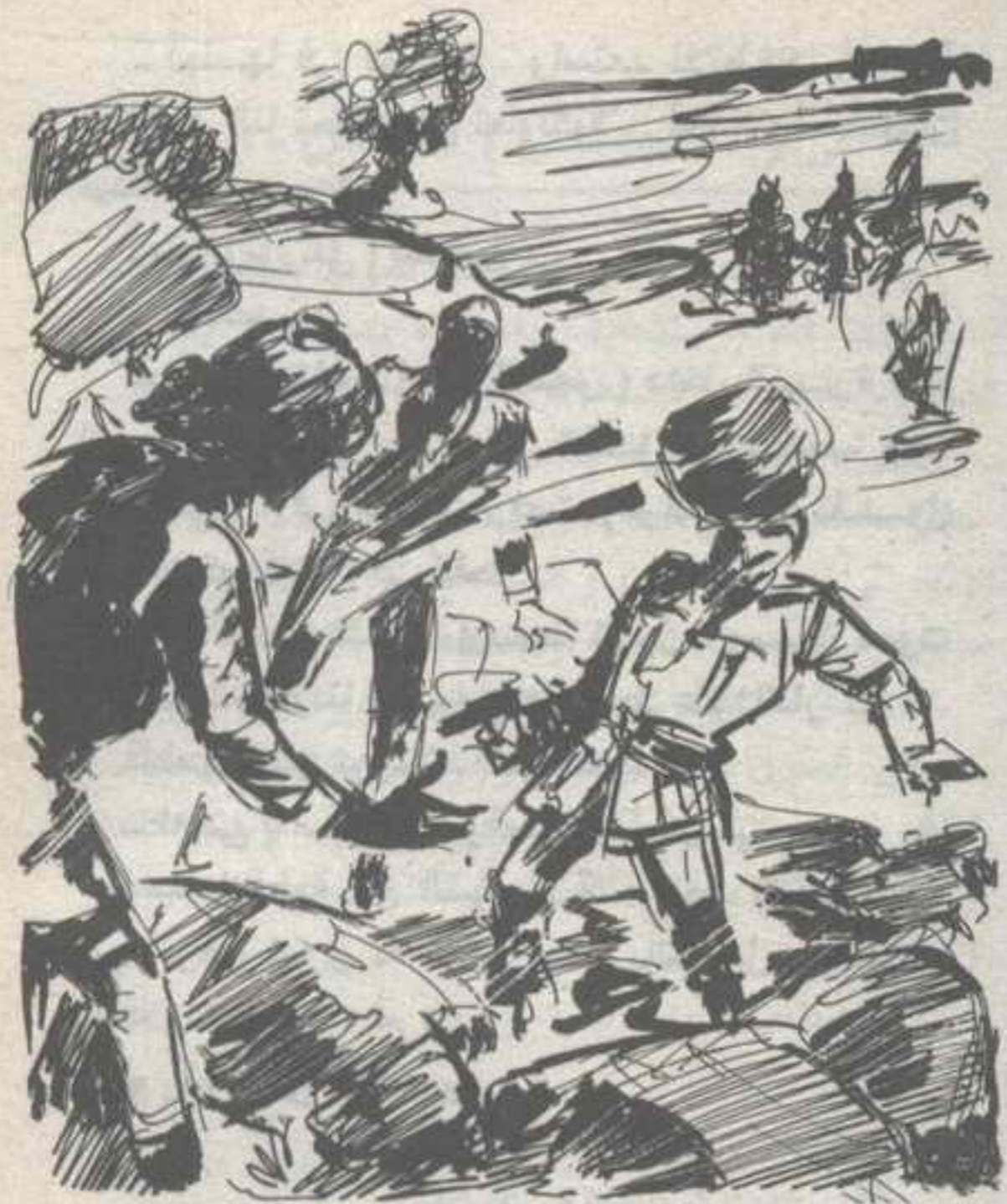
اختطف (فرانسييس) صخرة كبيرة، ورفعتها فوق رأسها، ثم ألقها بكل قوتها على الحارس ..