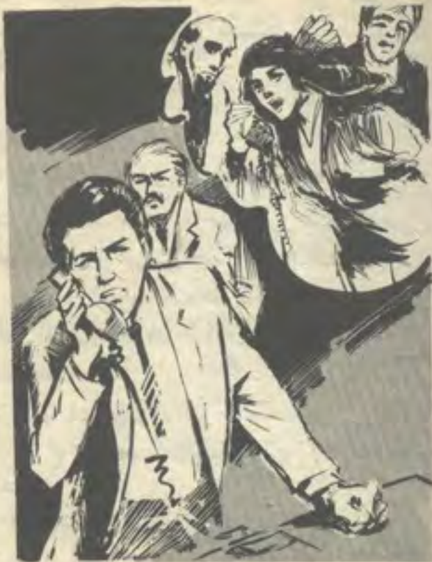
وهنا ازداد توتر (أدهم) ، إذ سمع عبر الهاتف صوت ضحكة ساخرة ، أعقبه صوت (منى) ..

— يبدو أنك تتميز بروح الدعابة كما أخبروني أيها الشيطان، ولكنني لن أطلق النار على رأسك أنت .. بل على رأس زميلتك الجميلة (منى توفيق) .