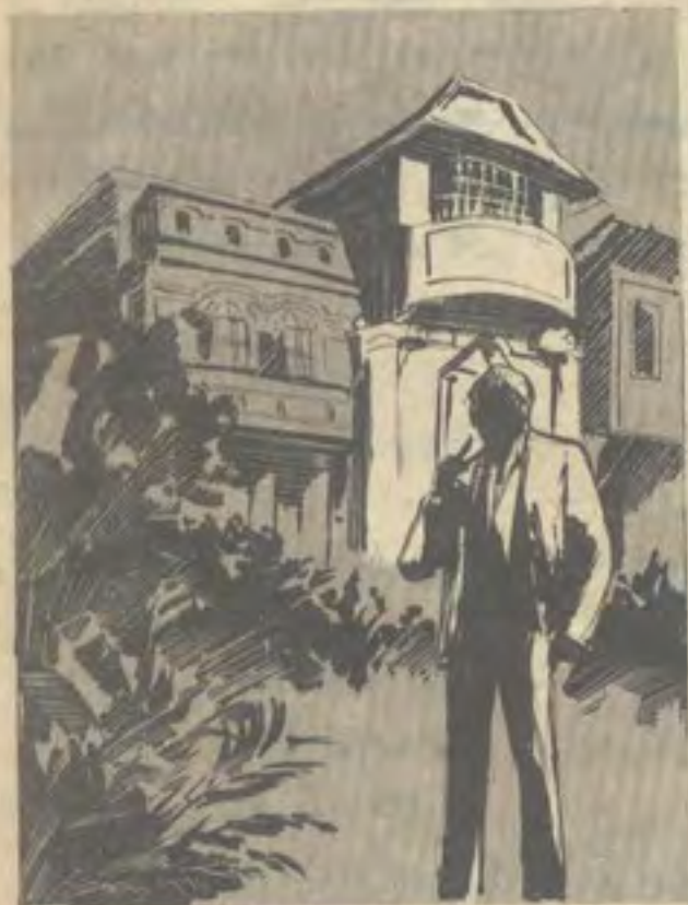
ثم داعب ذقنه بسبائه ، وهو يتأمل القفلا بشك ، وعاد يقول لنفسه : « هناك تفسيران فقط لاثالث لهما » ..

المكان بدقة واهتمام فترة طويلة قبل أن يقطب حاجبيه ويقول لنفسه :