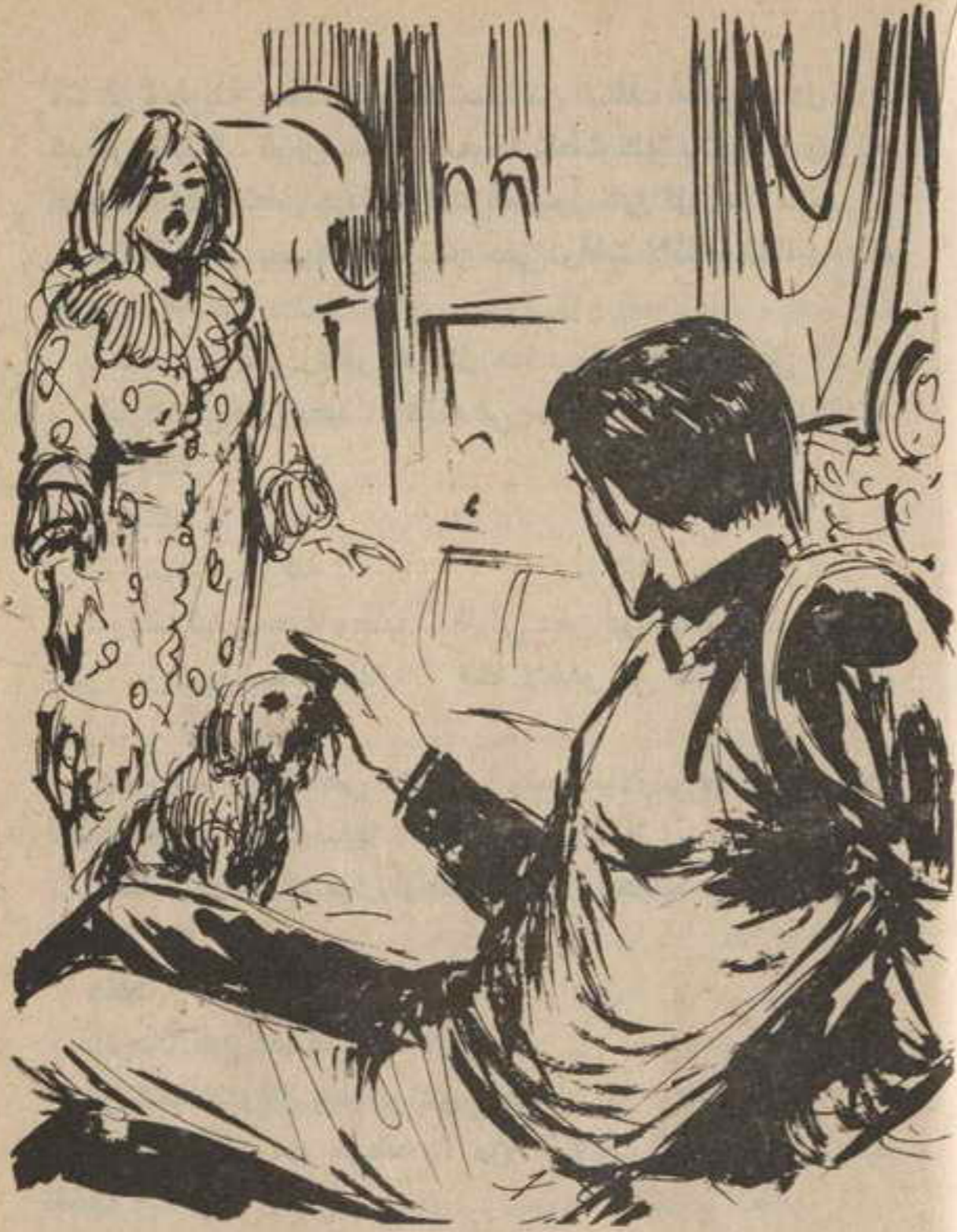
كانت أمامه امرأة باهرة الحسن والجمال ، شقراء الشعر ، زرقاء العينين ، لها أجمل وأرق ملامح رآها في حياتها ..

( الاتحاد السوفيتي ) الشيوعي المتكشف رسمياً؟! قطع الكلب أفكاره ، وهو يتقدم نحوه ، وينبح في وجهه بحدة ، فابتسم وهو يداعبه مغمغماً :