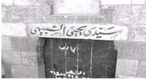
● بقلم: د محمد فتحي عبد العال/ مصر

● تحتضن مصر العديد من الأضرحة لأولياء الله الصالحين وأهل البيت علاوة على مساجد تلق شامة تُسَرُّ الأُمني وتُسخر الألياب، فتحلف الماشي التلد وتبهر للعاشر الطريق وكان القدر اختار مصر دونها عن بقاع الأرض لعمور هذا التراث الحافل والتري عبر التاريخ، ويحلف هذا التراث المتدة الملمات والأساطير التاريخية التي تداعب لقلب وتذب معها العقول إلهاما وحثيا إلى أزمته خلابة ومصور شديدة الإثارة، ومنها ضريح خلقتنا اليوم ومنه ننشد للجامع أيضا.