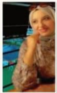
نور الشمس نور التعميم

إلا إذا ابتعدنا عن مساوئ الأخلاق. لقد رفع الله منزلة الصيام، وعظم أثاره في إصلاح المسلم وتقريبه إلى الخلاق عز وجل ولها ترك الأجر له، لأن الله لا يقبل العمل الصالح إلا بالأجر الأجرى. وقد روى البخاري في الحديث الصحيح عن أبي هريرة عن رسول الله، (كل عمل إلا آدم له، إلا الصيام، فإنه لي، وأنا أجزي به). ولوساذا الرسول عليه الصلاة والسلام بأيام شهر رمضان بزيادة الإنفاق ويسعة به الجود والاكثار من أفعال الخير. فقد روي عن ابن عباس رضي الله عنهما أنه قال، (كان رسول الله صلى الله عليه وسلم أجود الناس، وكان أجود ما يكون في رمضان). هذا المعطاء به مغفرة للأغنياء ورحمة على الطيور الجوانع، وأوساذا رسول الله صلى الله عليه وسلم بتلاوة القرآن وتذير آياته. والاستكثار من الذكر والتوجه وقيام الليل قريبة لله تعالى ورجوع من الله غفراناً لا أسفلاً من ذنوب. وقد قال صلى الله عليه وسلم بالهدى الحديث الصحيح، (من قام رمضان إيماناً واحتساباً، غفر له ما تقدم من ذنبه، ومن فطنا الله تعالى علينا بهت الشهر الفضيل،