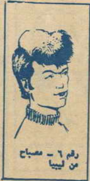
رقم ٦ - مصباح من ليبيا