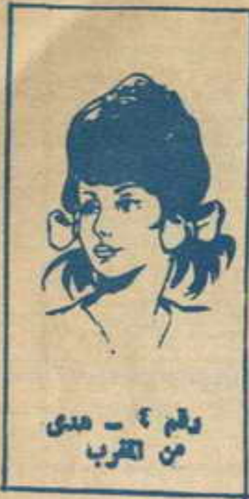
رقم ٤ - هدى من القرب