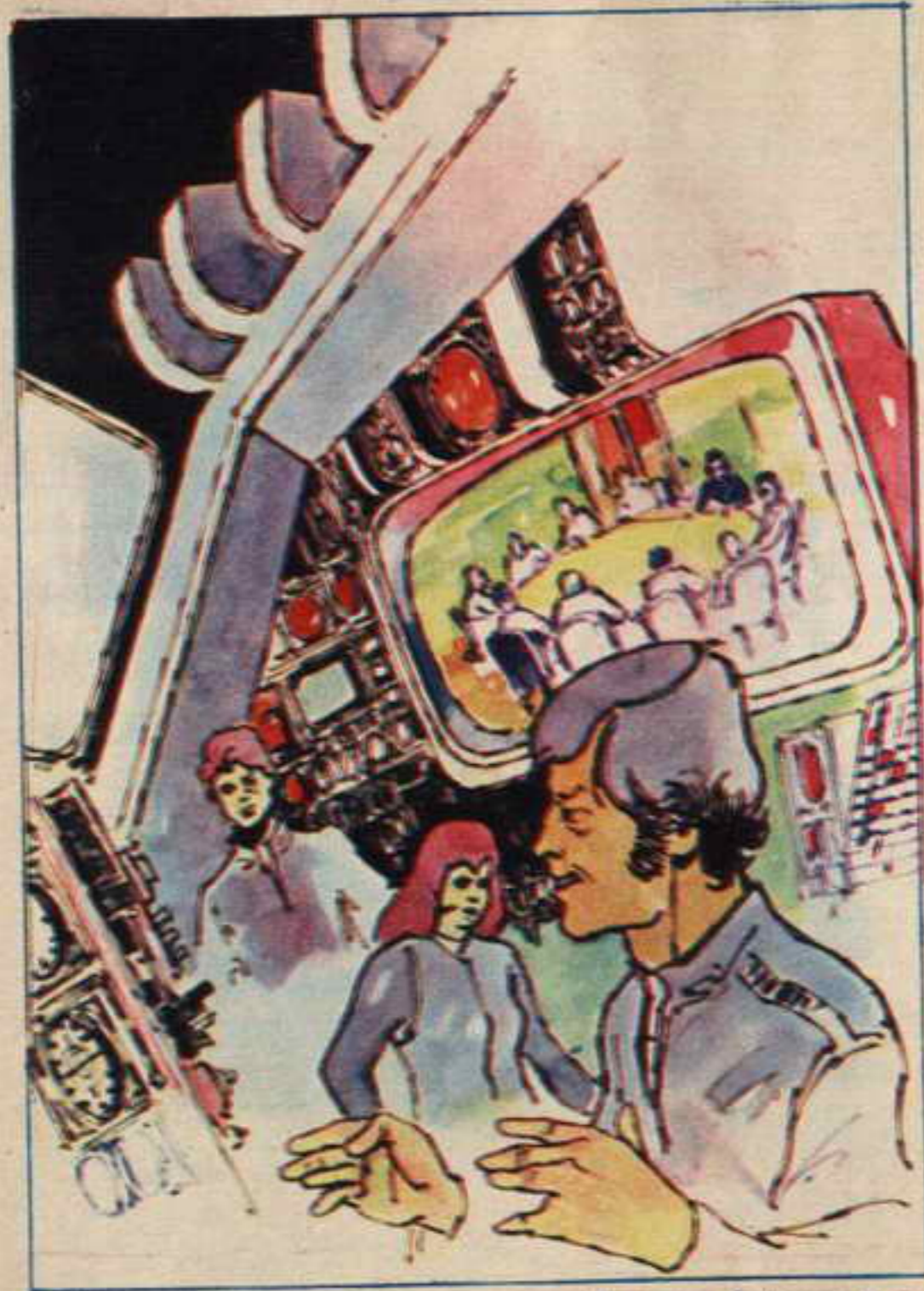
منضغط باسم زرا ثانياً على لوحة الأزرار التي كانت معلقة فوق العائظ ، فأضاءت شاشة في أعلى العائظ المواجه للباب ، وعلى الشاشة ظهرت قاعة اجتماعات .