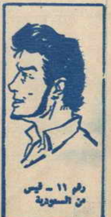
رقم ١١ - نيس من السعودية