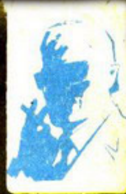
رسم من تصميم الفنان عبد الله بن عبد الله