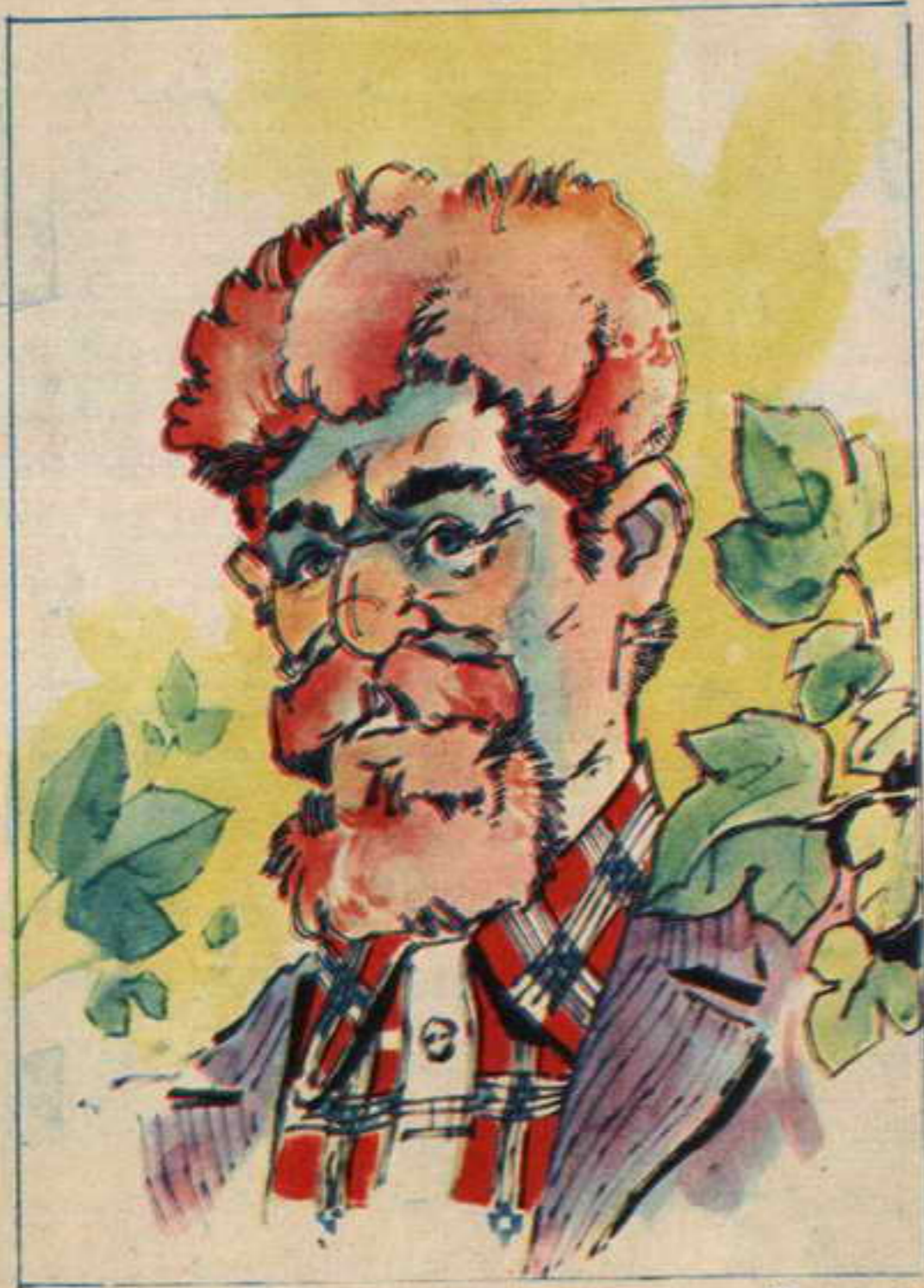
كان ميق العباقره معناه، إضاءة تامة .. وفجأة نلهرت فتحة كأنها باب ثم ظهر فيها رجل أشيب هو يورك، صاح بصوت خشن: آين أوستن؟ إن أحداً آتى الجزيرة.