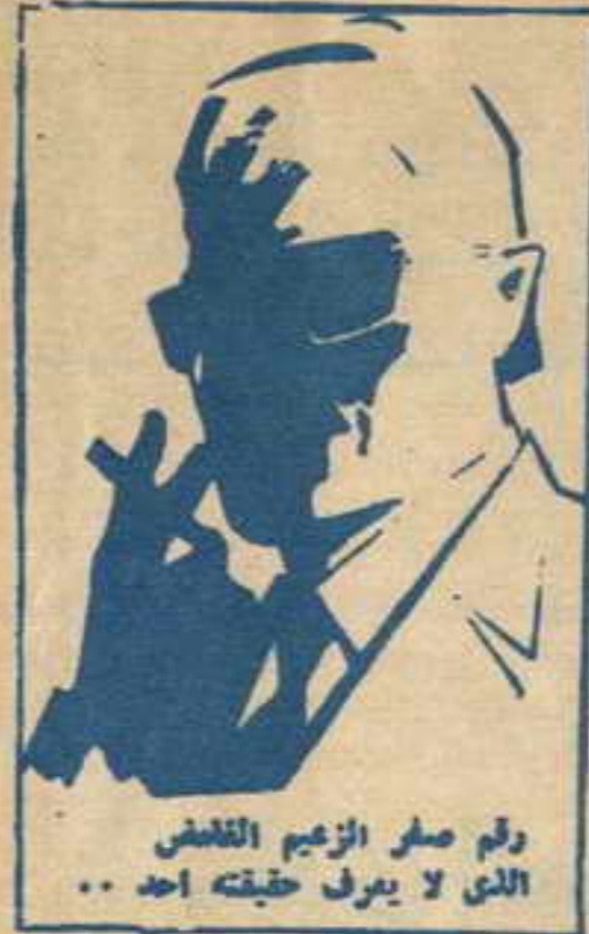
رقم صفر الزعيم القامض الذي لا يعرف حقيقته احد ..