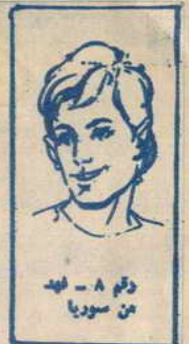
رقم ٨ - نهد من سوريا