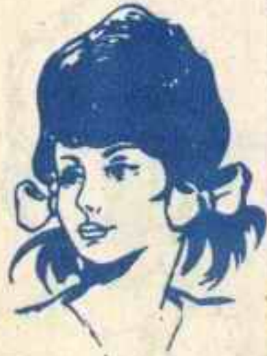
رقم ٤ - هدى من القرب