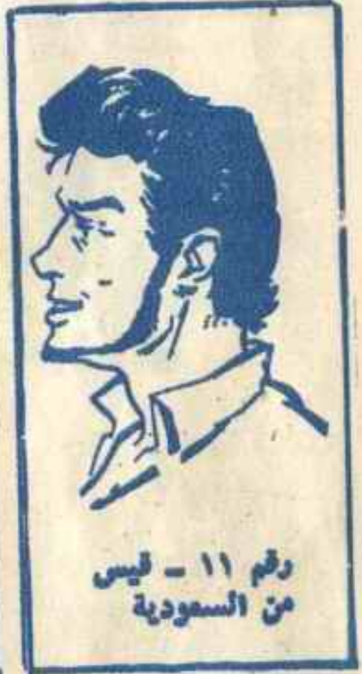
رقم ١١ - ليس من السعودية