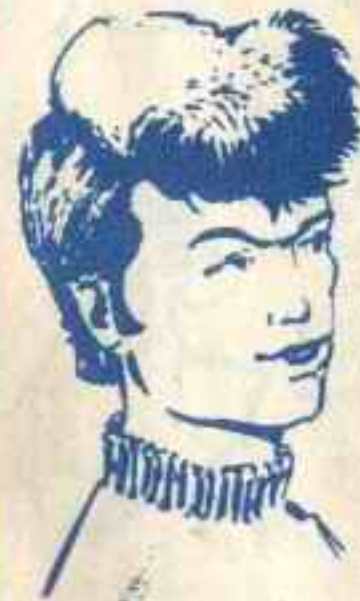
رقم ٦ - مصباح من ليبيا