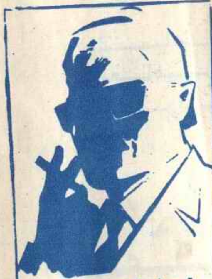
رقم صفر الزعيم القامض الذي لا يعرف حقيقته احد ..