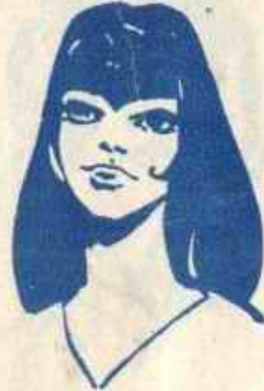
رقم ٣ - الهام من لبنان