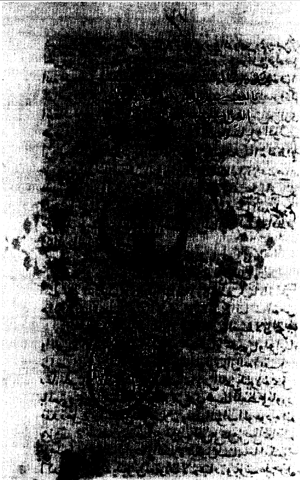
الورقة الأولى من (ج)