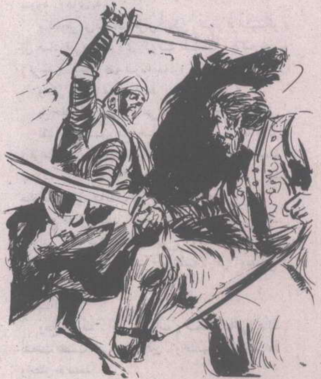
انزلق السرج ، وفقد ( فرانثيسكو ) توازنه بغتة ، وانزلق مع السرج ليرتطم بالأرض ..