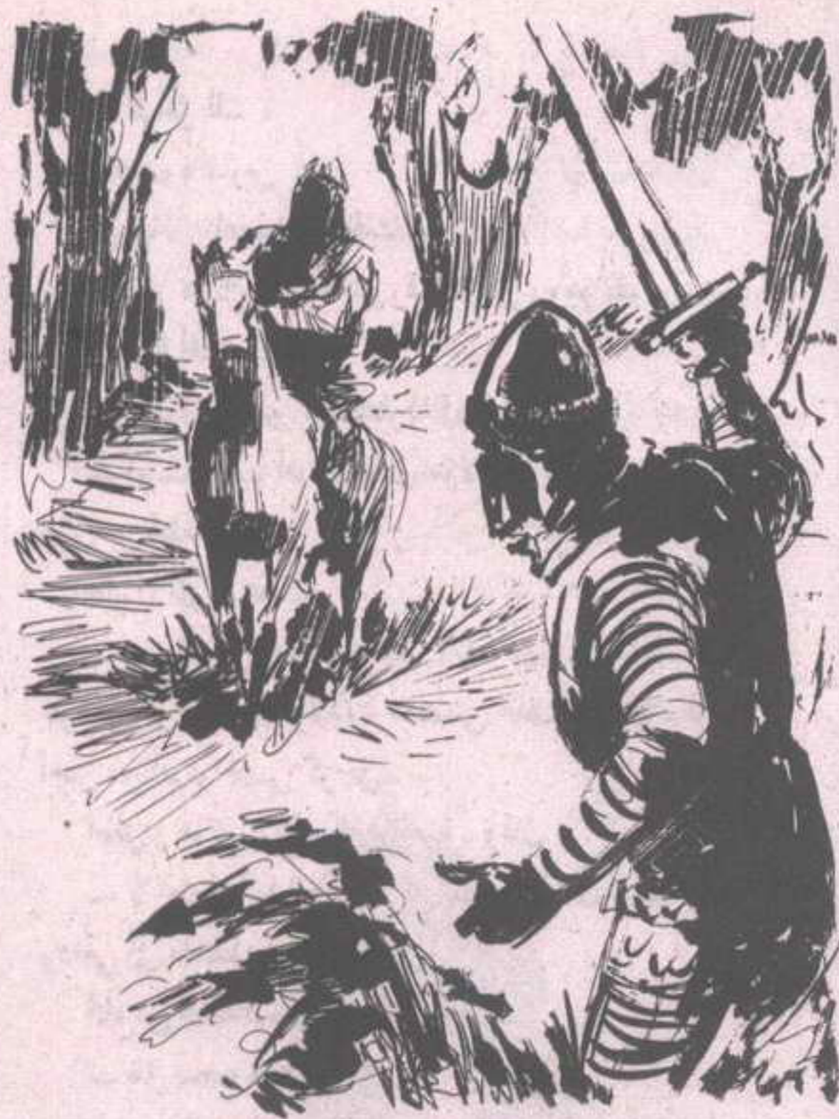
ابتسم (فرانثيسكو) لشكوك (هاكل)، وبرز من خلف الشجرة، ورفع سيفه هاتفاً في وجه القادم: من أنت؟