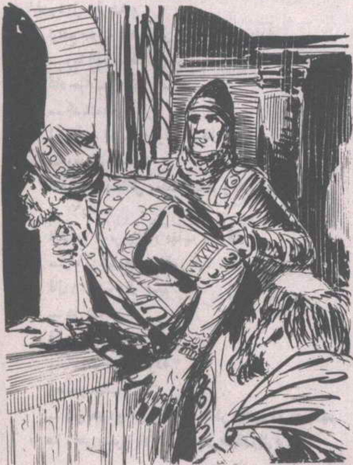
لم يكده الأمير يرز في النافذة، حتى سرت مهمة غاضبة بين فرسانه ..

لم ينس أحدهم بينت شفة ، في حين قال ( مهاب ) في انفعال :