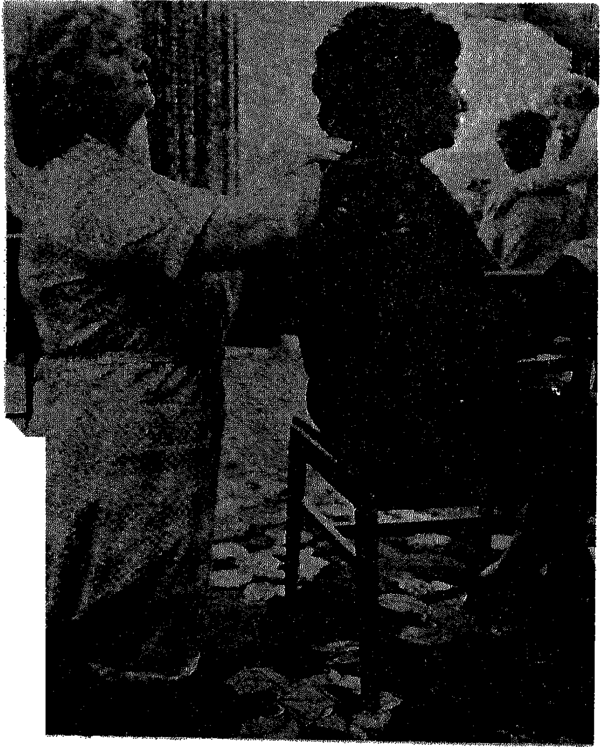
٧ - المعالجة روزداوسون تكتفي بوضع يديها على المريض .