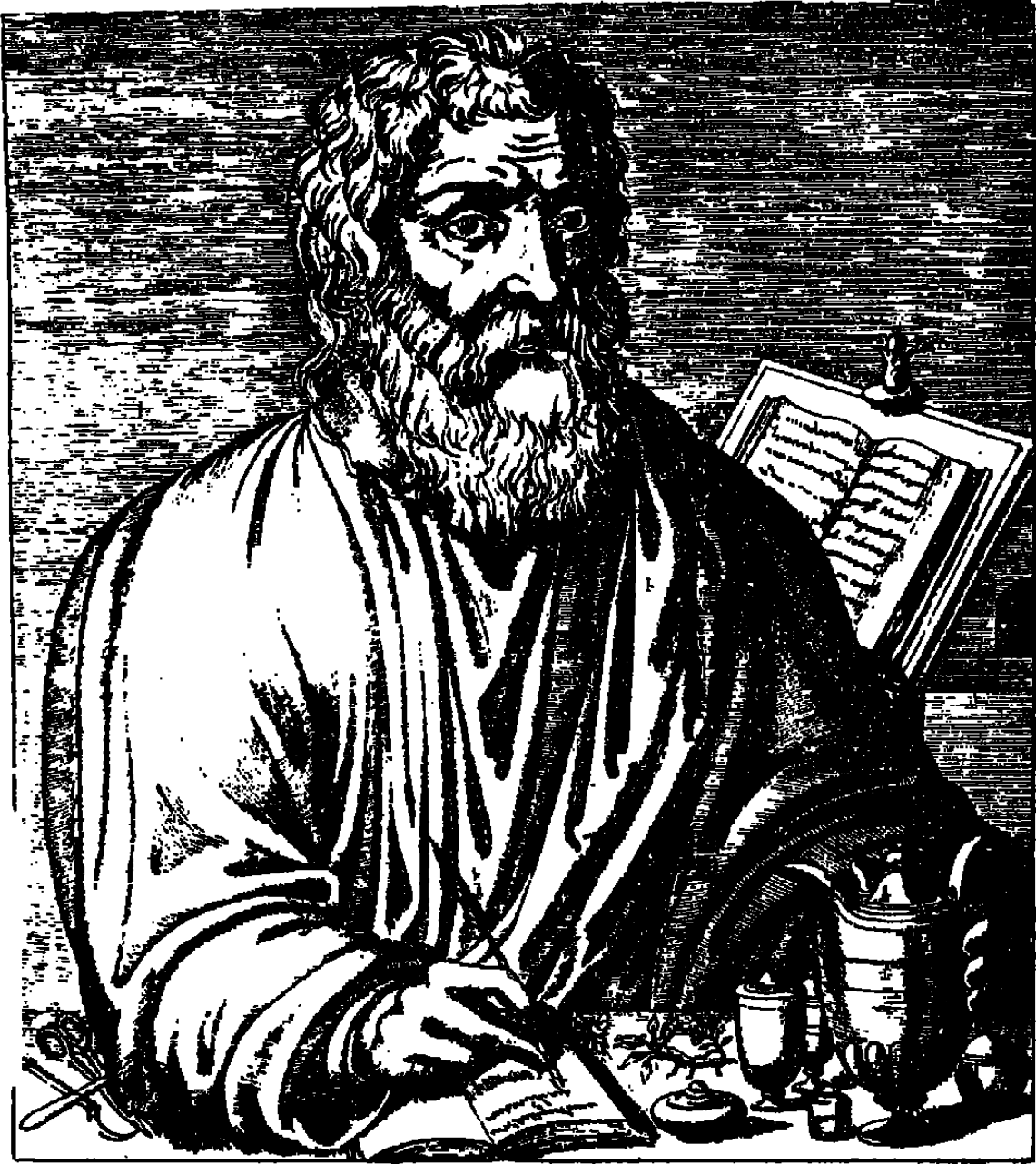
١ - أبو قراط ، كان يعالج مرضاه بتمرير يديه .