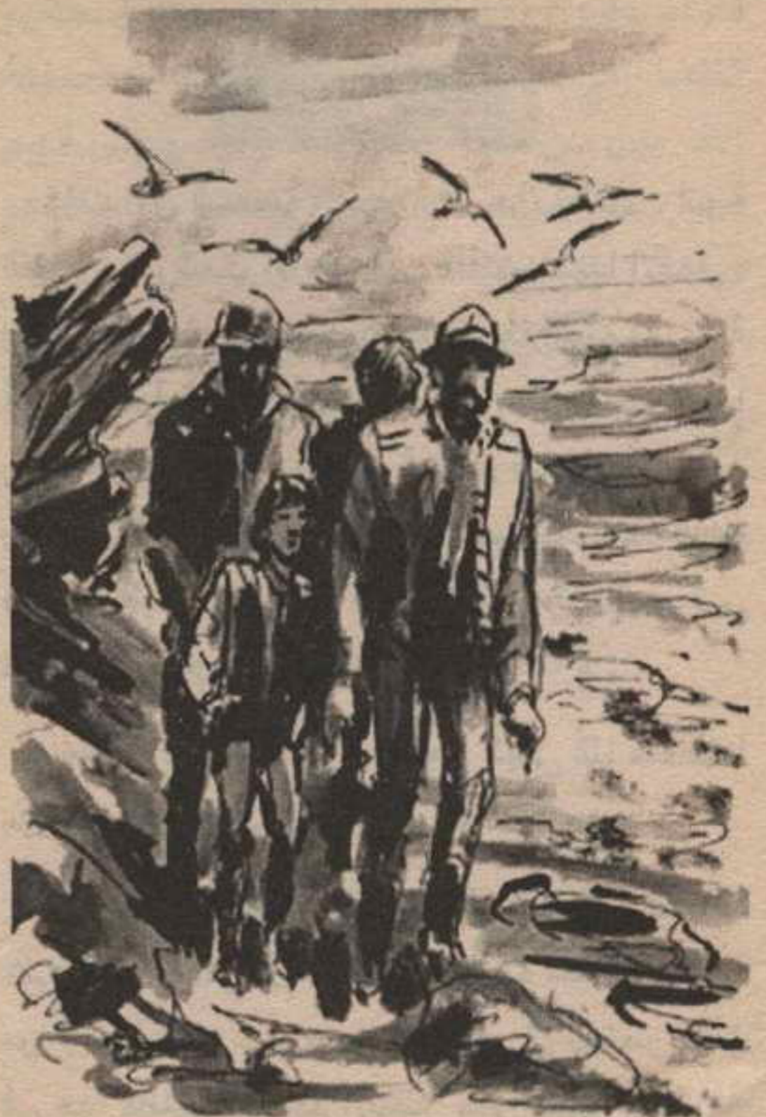
راحوا يمشون وينادون بأعلى أصواتهم كلما هدأت الأمواج قليلاً ..

كانت النجوم تلمع في السماء ، وما من نجم منها يمت لنصف الكرة الشمالي .. الدب القطبي لم يكن في السماء ، وكان الصليب الجنوبي واضحًا .. وعند الفجر جاء من البحر ضباب كثيف يجعل الرؤية مستحيلة .. إلا أنه انقشع سريعًا ، وفي السادسة