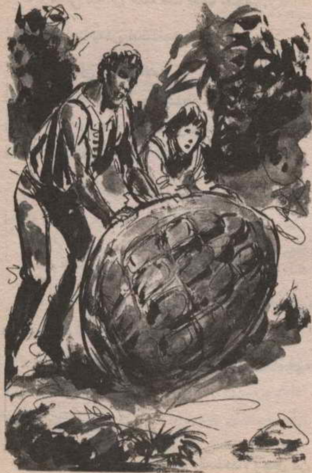
لكن الصبى طلب منه أن يحذو حذوه ، وتعاون الاثنان حتى قلبا السلحفاة على ظهرها ..

بعد يومين وقع حادث مريب آخر .. كان الصبى و ( نيب ) يمشيان عند الطرف الآخر من الجزيرة ، حين رأيا سلحفاة عملاقة تزحف هناك .. وأدرك أنها فرصة لا تفوت خاصة بالنسبة لـ ( بنكروفت ) الشره الذى سيرحب حتماً بهذا اللحم الوفير .. ولم يعرف الزنجى ما ينبغى عمله ، لكن الصبى طلب منه أن يحذو حذوه ، وتعاون الاثنان حتى قلبا السلحفاة على ظهرها .. وهالهما كم هي ثقيلة ..