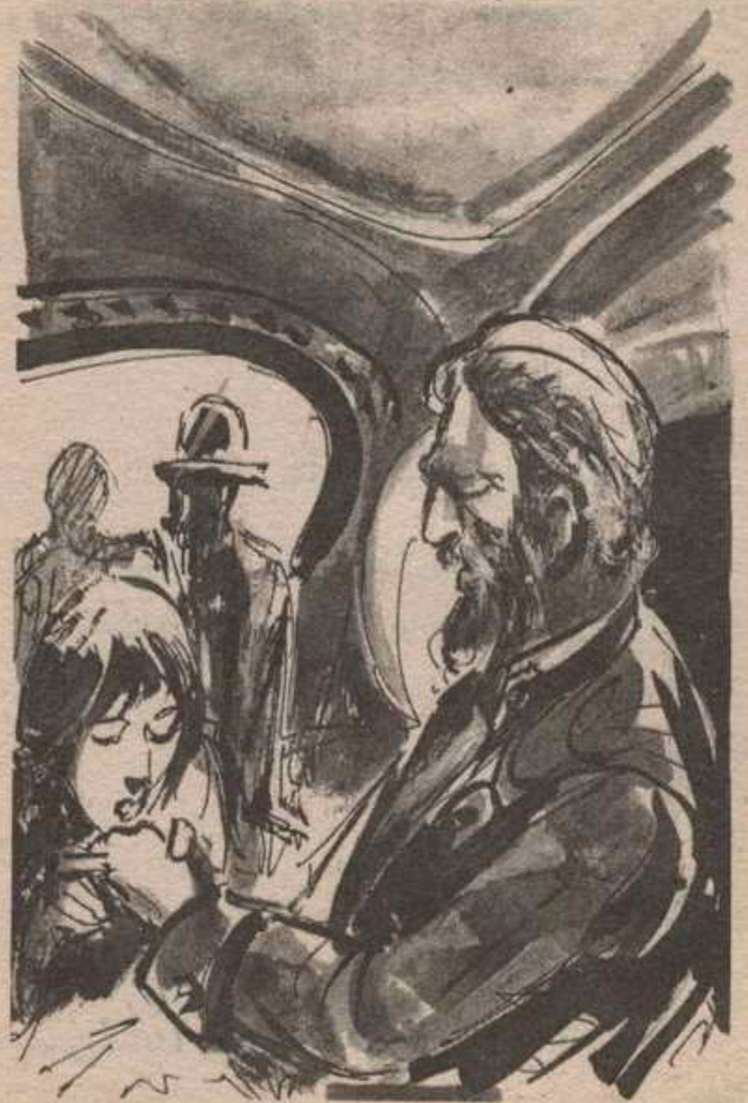
هنا زحف الصبى على ركبتيه نحو الكابتن ( نيمو ) وطبع على يده

بإشارة من يده ؛ كي يواصلوا سماع ما يقول الكابتن :