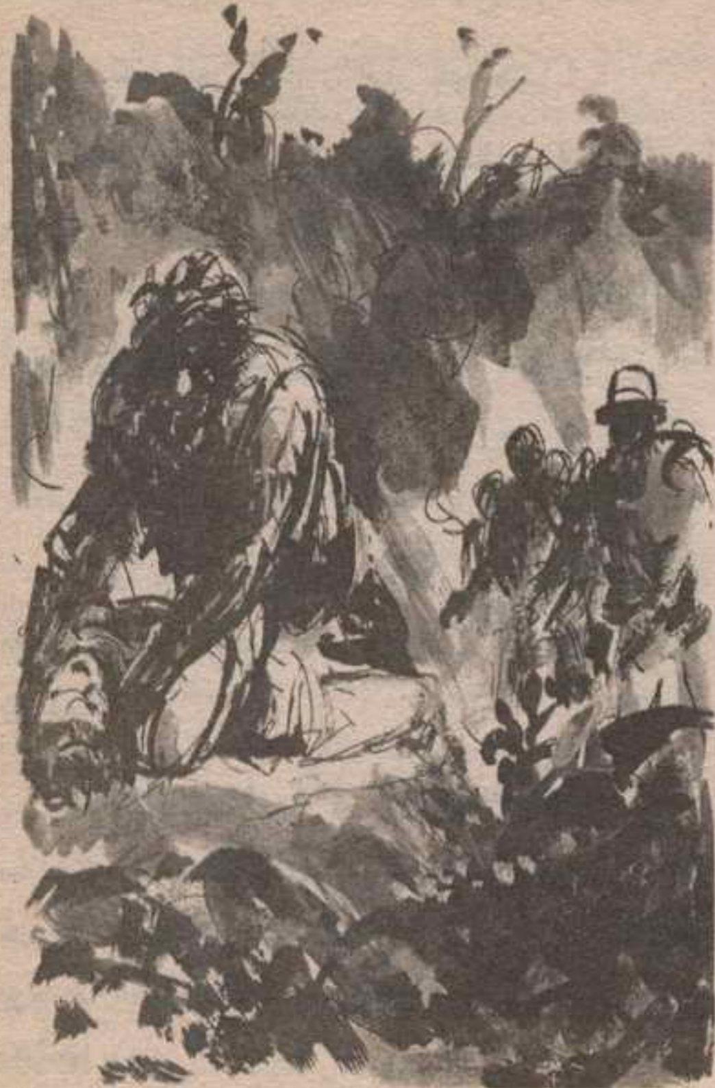
كان راقداً على ظهره يقاوم وحشاً يجثم فوق صدره ويحاول