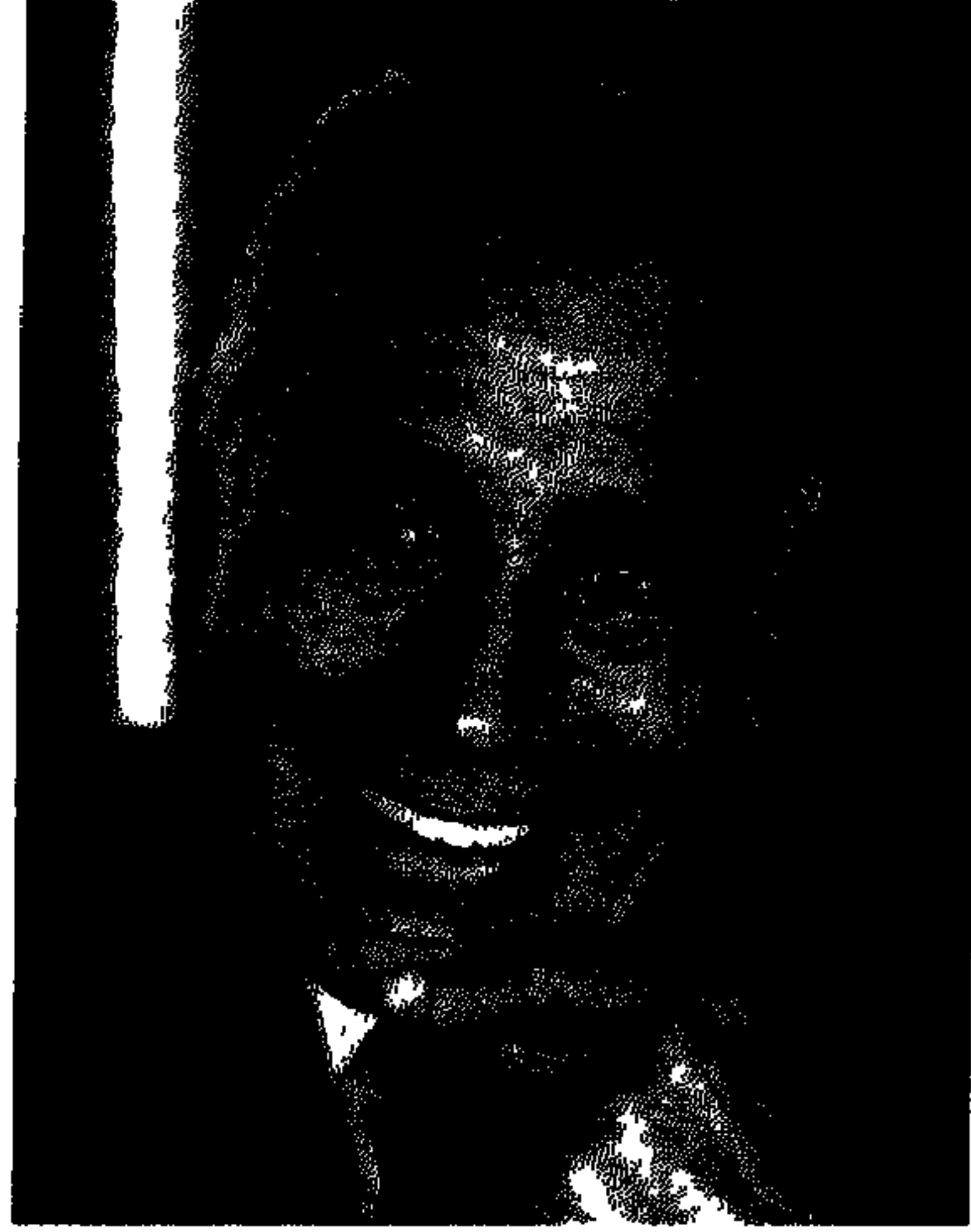
محمّد حسنين هيكل

٩٩... وهنا يختلف «الجزء الأول» من كتاب «العروش والجيوش» عن الجزء الثاني (هذه الصفحات). — يختلف في أن السياسة المصرية انتقلت من صراع ثنائي مع بريطانيا معروف ومألوف إلى تحدي صراعات طارئة — من نوع مُعقّد ومركّب وأشدّ عنقاً.