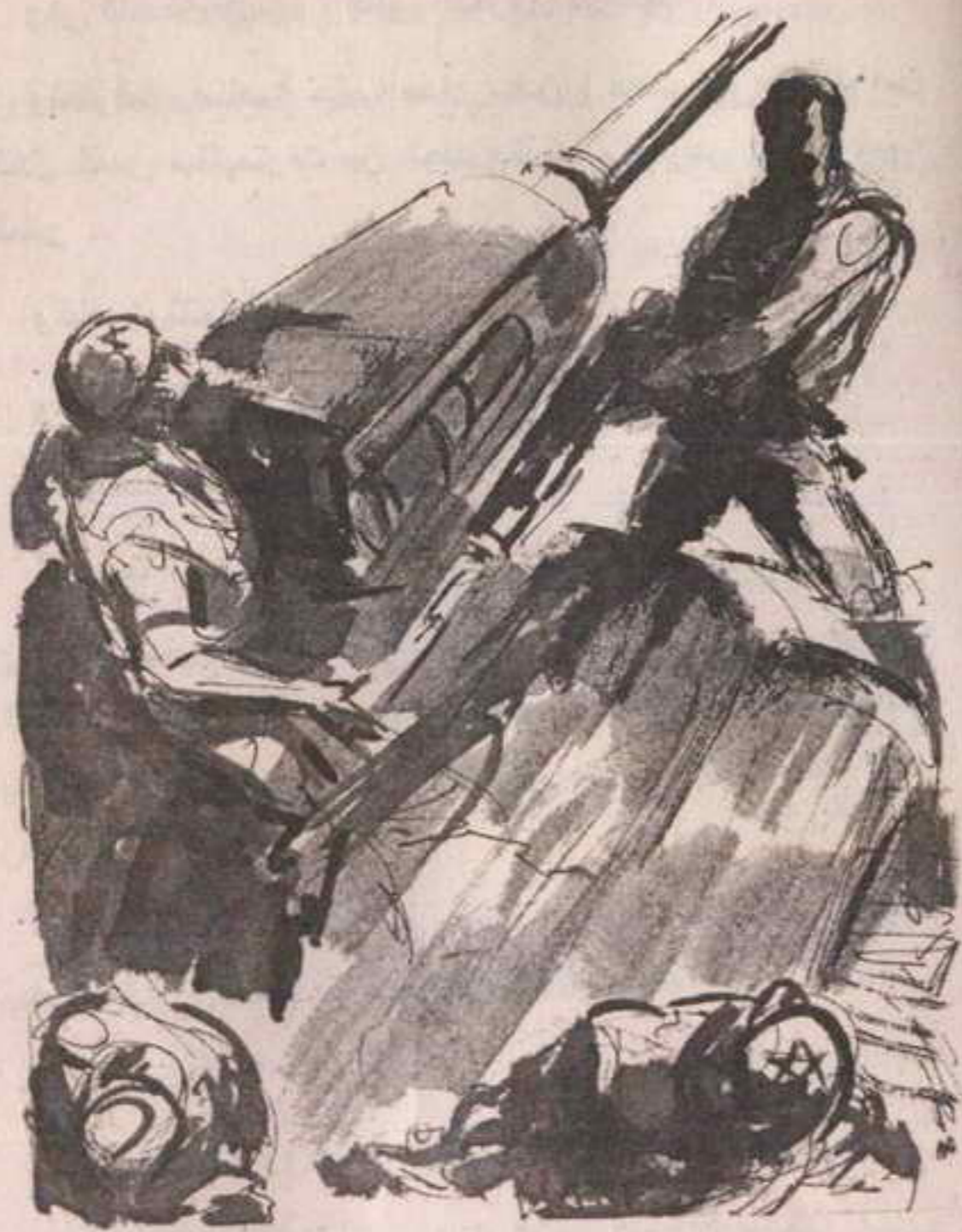
وعلى الرغم من أن الإسرائيليين كانوا متحفزين بالفعل ، إلا أن رصاصاته قد حصدت الثلاثة ، الذين اعتلوا جسم الدبابة ..