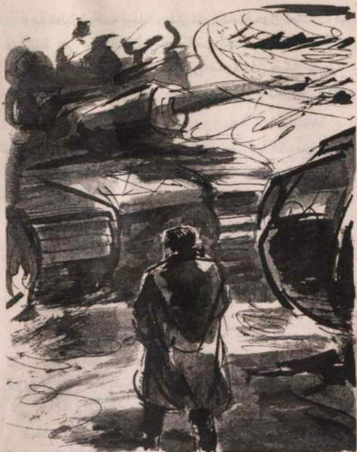
فوثب (باراك) خارج الهليكوبتر ، وضم معطفه إلى صدره ، في حركة عصبية ، وهو يقطع المسافة في خطوات سريعة ..