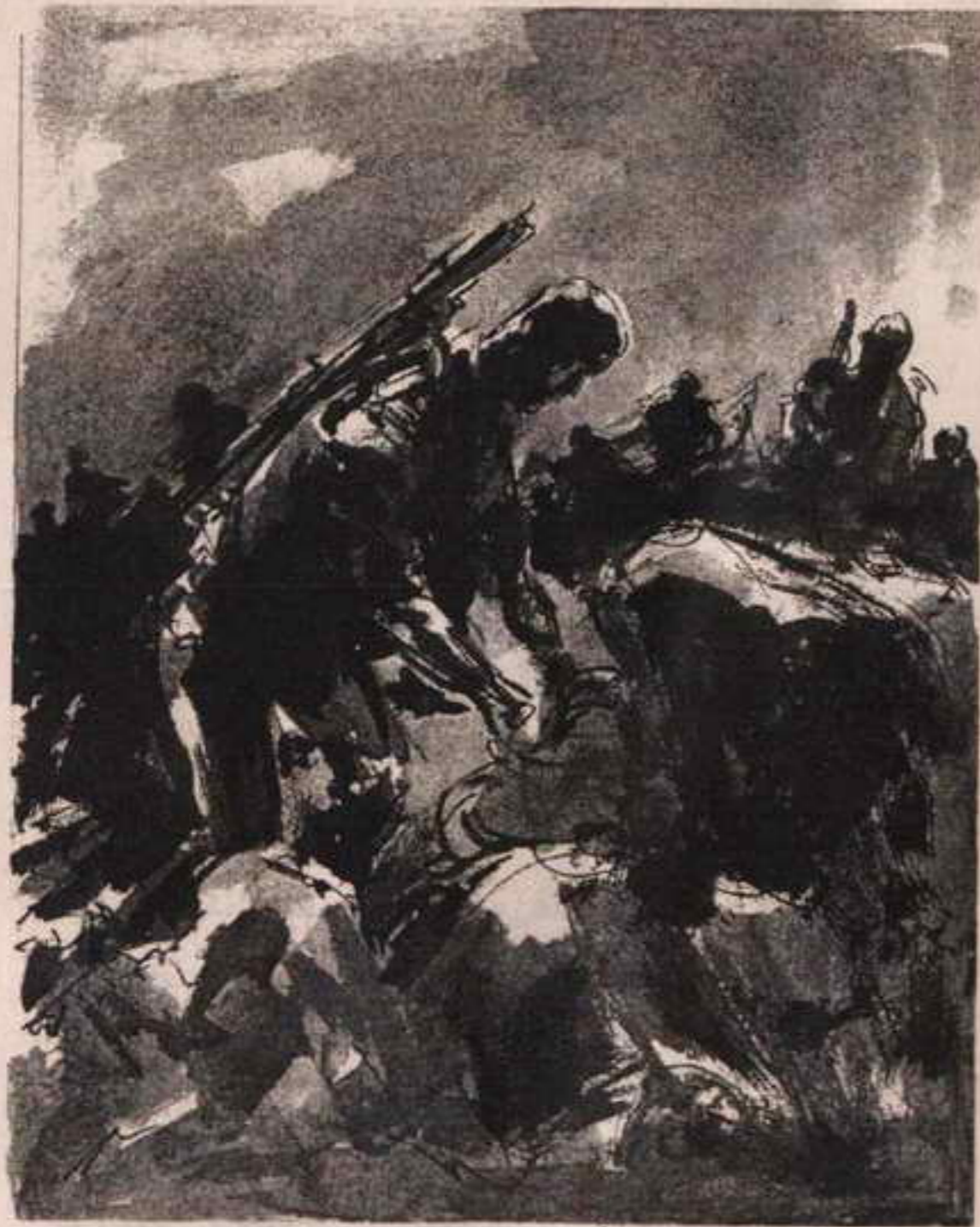
وبسرعة ، جذب حبال المظلة ، وطواها ، ثم دفعها بين صخرتين كبيرتين ، وهو يخلع حقيبتها ..

وعلى الرغم من الضوء الخافت ، والسقوط بسرعة الجاذبية الأرضية ، رآهم يجذبون حبال مظلاتهم ، واحداً بعد الآخر .. حتى المقدم ( راشد ) ، والنقيب ( مدحت ) ..