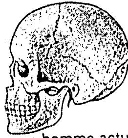
homme actuel ( Homo sapiens sapiens )