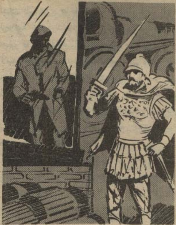
شاهد رجلاً يرتدى ملابس تعود إلى عصور ما قبل الميلاد ، ويمتشق سيفاً حديدياً ..

— وقبل أن يستعيد الجميع هدوءهم بعد هذا الموقف الخيف ، وفي الصباح الباكر وأمام عيون الجميع ، ارتفعت إحدى آلات الحفر التي تزن ما يقرب من طنين عن سطح الأرض حوالى ثلاثة أمتار ، وظلت معلقة دون أن يجزؤ أحدهم على الاقتراب منها ، ثم