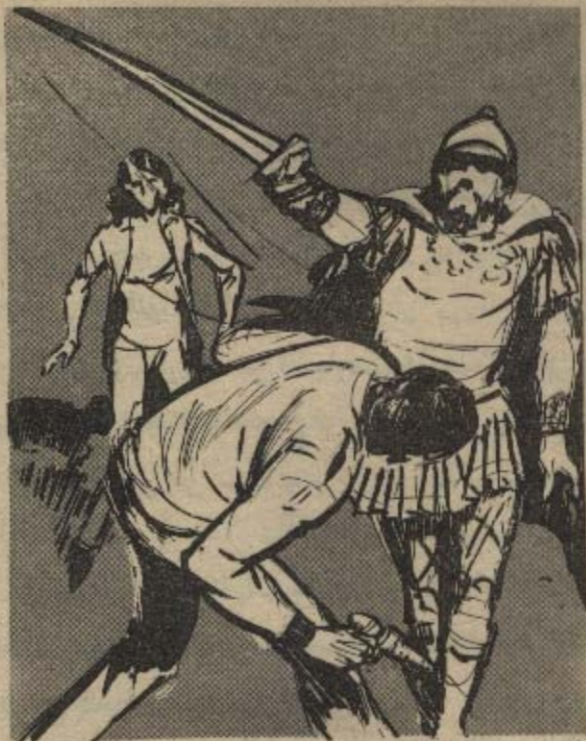
وطوح الشيخ سيفه نحو رقبة ( نور ) ، الذي انحنى بصورة غريزية ، متفاديا النصل اللامع ..

اجتازت سيارة الفريق بوابة معسكر العمل بهدوء وسط الرعب المرتسم على وجوه العاملين ، وغادرها ( نور ) أولا ، ثم تبعه رفاقه ، ومرت لحظات صمت قبل أن يتحرك رجل طويل القامة بشكل ملحوظ ، ويتقدم ناحية ( نور ) ، وبدا التردد على وجهه لحظة قبل أن يقول :