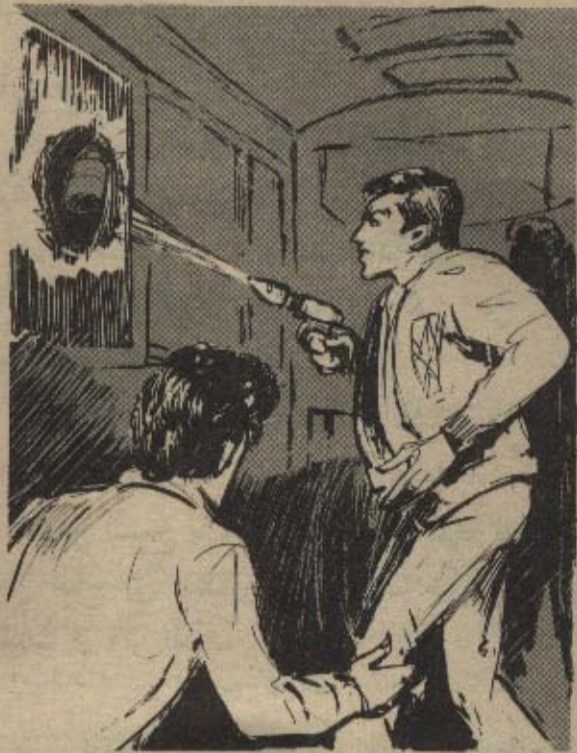
أسرعت نحو النافذة الزجاجية ، وكأنها تفر من أمامه ، فأسرع ( نور ) يصبّ أشعته نحوها ..

ابتعدت عن يده بمحركة حادة ، دون أن تتوقف عن الدوران حول نفسها ، وتكرر الأمر عندما حاول الإمساك بها مرة أخرى ، ولكنها في هذه المرة ارتفعت إلى أعلى ، ثم توقفت وتابعت دورتها الهادئة ، فصاح ( رمزي ) :