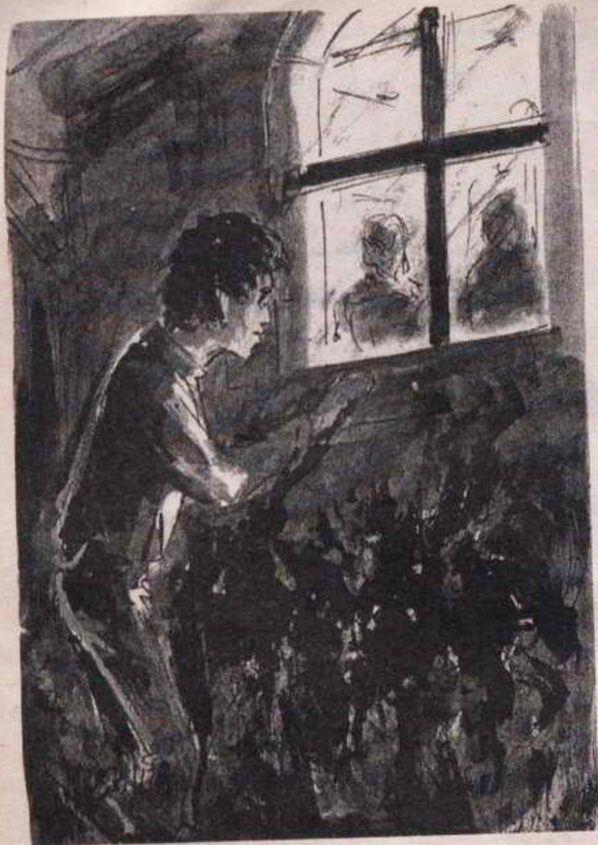
فيتسلل كالثعبان إلى الداخل .. ثم شمعة مضاءة .. والنافذة الصغيرة المطلة على غرفة نوم العمّة تسمح له باختلاس النظر ..