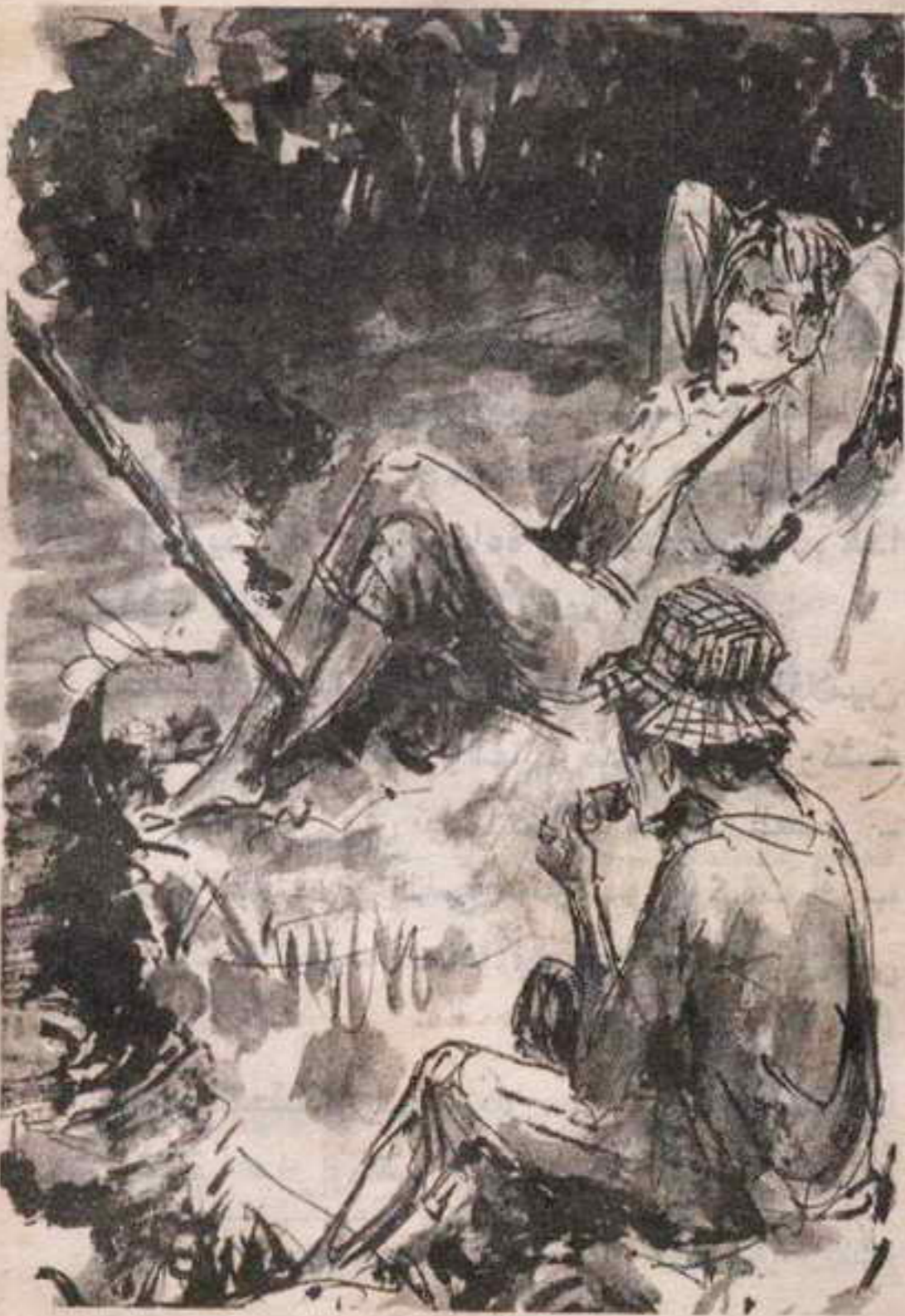
جواره كان صبي أكبر سنًا يلتهم أجاصة مسروقة ، ويضع على رأسه قبعة من القش ..

لماذا أحكى هذه التفاصيل ؟ لا بد أنني جننت إذن .. إن ( عبير ) لا تعرفها ، وما تعرفه ( عبير ) لايهمنا في شيء .. لأن هذه هي ( فانتازيا ) حيث كل شيء من صنع ( عبير ) ومن بنات أفكارها ، وحدائق مخيلتها ..