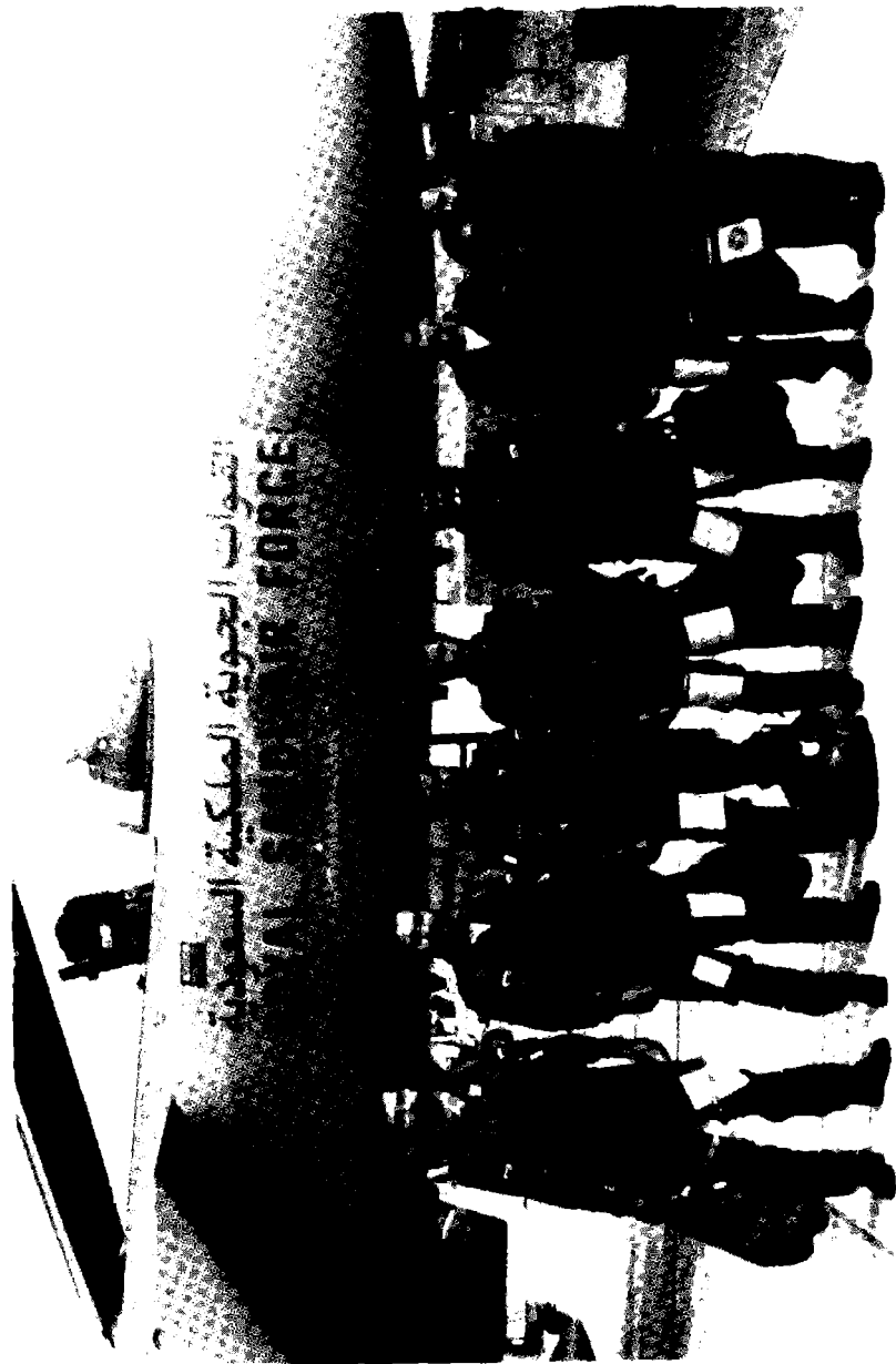
مجموعة من نصور الجو السعوديين في احدى القواعد الجوية السعودية