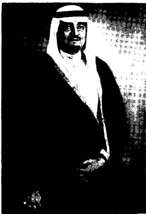
خادم الحرمين الشريفين الملك فهد بن عبد العزيز آل سعود المفدى