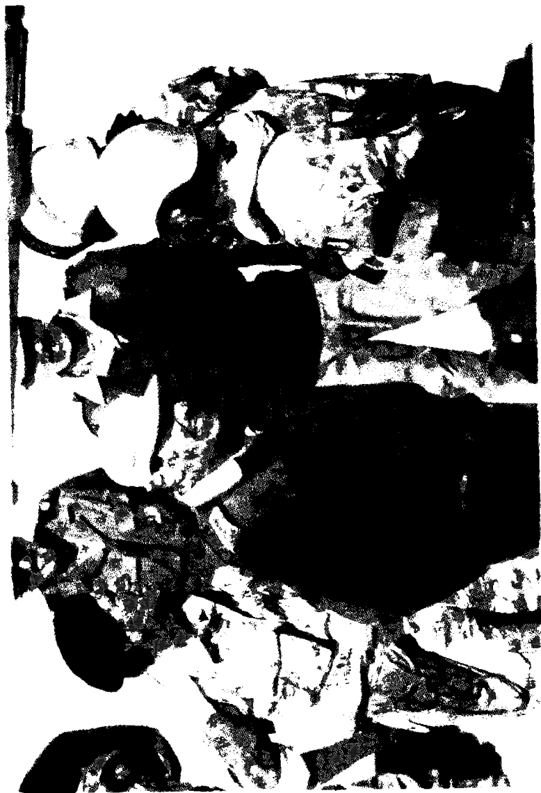
الفريق الركن خالد بن سلطان قائد القوات المشتركة مع عدد من القادة الميدانيين