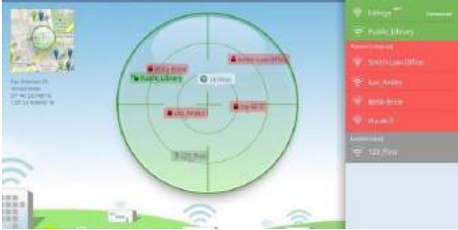
تطبيق "Wi-Fi Finder"

بهذه الطريقة، يمكنك العثور على الأماكن التي تقدم خدمة الإنترنت المجانية أينما كنت؛ وفي نفس الوقت لن تترك تحميل صور عطلتك على مواقع التواصل الاجتماعي حتى تعود من العطلة.