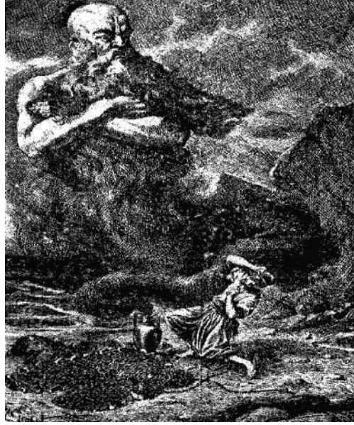
صورة الصياد والجنّي والقمقم.

سليمان، التوبة التوبة! آمنت بك وأطعتك ولم أعد أخالف لك قولاً أو أعصي لك أمراً، فلا تقتلني فإنني تائب نادم على ما فرط مني من العصيان!» فعاود الصياد الرمق وقال له: «أين سليمان النبي أيها الجنّي؟ لقد مات منذ عدة قرون، فما قصتك؟ وما سبب حبسك في هذا القمقم؟» فلما علم الجنّي بموت سليمان النبي التفت إلى الصياد قائلاً: «سأجزيك على جميلك بالقتل، ولكنني سأترك لك اختيار ميّتك!» فقال له الصياد: «أهذا جزاء من أحسن إليك وأخرجك من سجنك؟» فقال له الجنّي: «لقد كنتُ من الجنّ المارقين، وقد عصيت سليمان بن داود — واسمي صخر الجنّي — فأرسل إلى وزيره آصف بن برخيا فأتي بي مكرهاً وقادني إليه ذليلاً، فلما وقفت بين يدي سليمان النبي أمرني بالدخول في طاعته فأبيت، فحبسني في هذا القمقم، وختم عليّ بالرصاص، وطبعه بخاتمه المنقوش عليه (الاسم