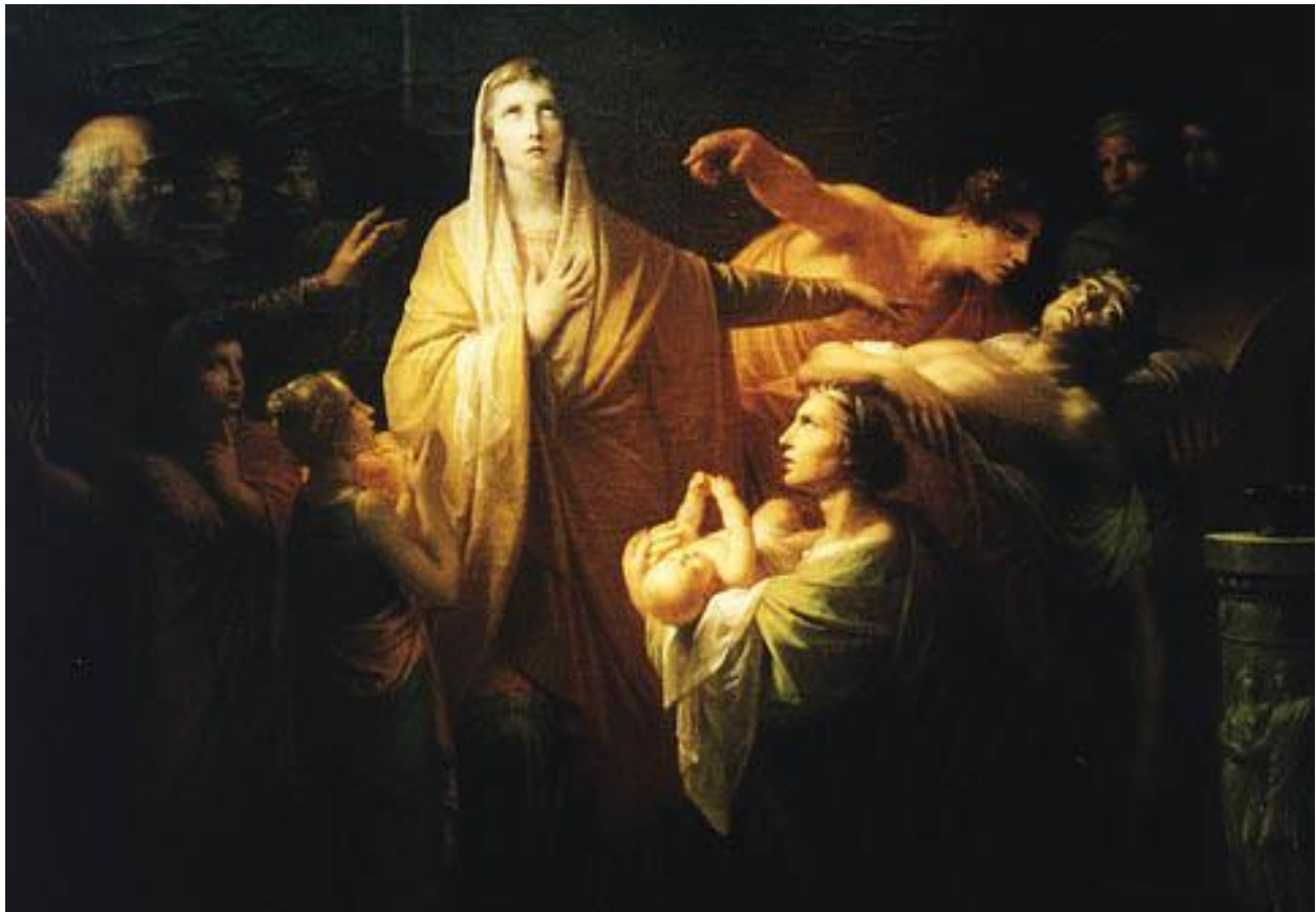
Friedrich Heinrich Füger, 1751–1818: Alcestis gives her life for Admetus.