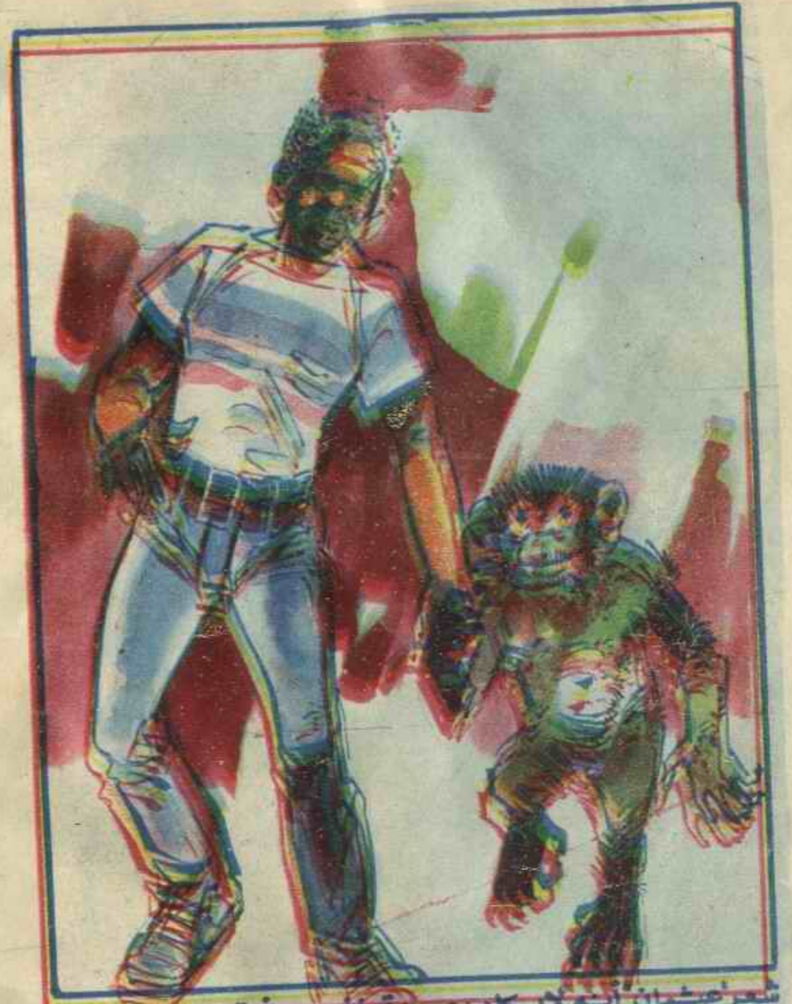
شعر عثمان أنه لا يكاد يصدق نفسه فقد كان القرد ميمون ينفذ التعليمات وكأنه يعرف اللغة العربية .

وضحك « عثمان » كثيرا .. ولكنه أحب « ميمون » ، واعتبره صديقه .. واتصل « بأحمد » وقال له : إننا لسنا أربعة فقط .. إننا خمسة .. إن هذا القرد « ميمون » شخصية في غاية الروعة !