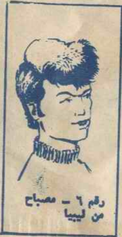
رقم ٦ - مصباح من ليبيا