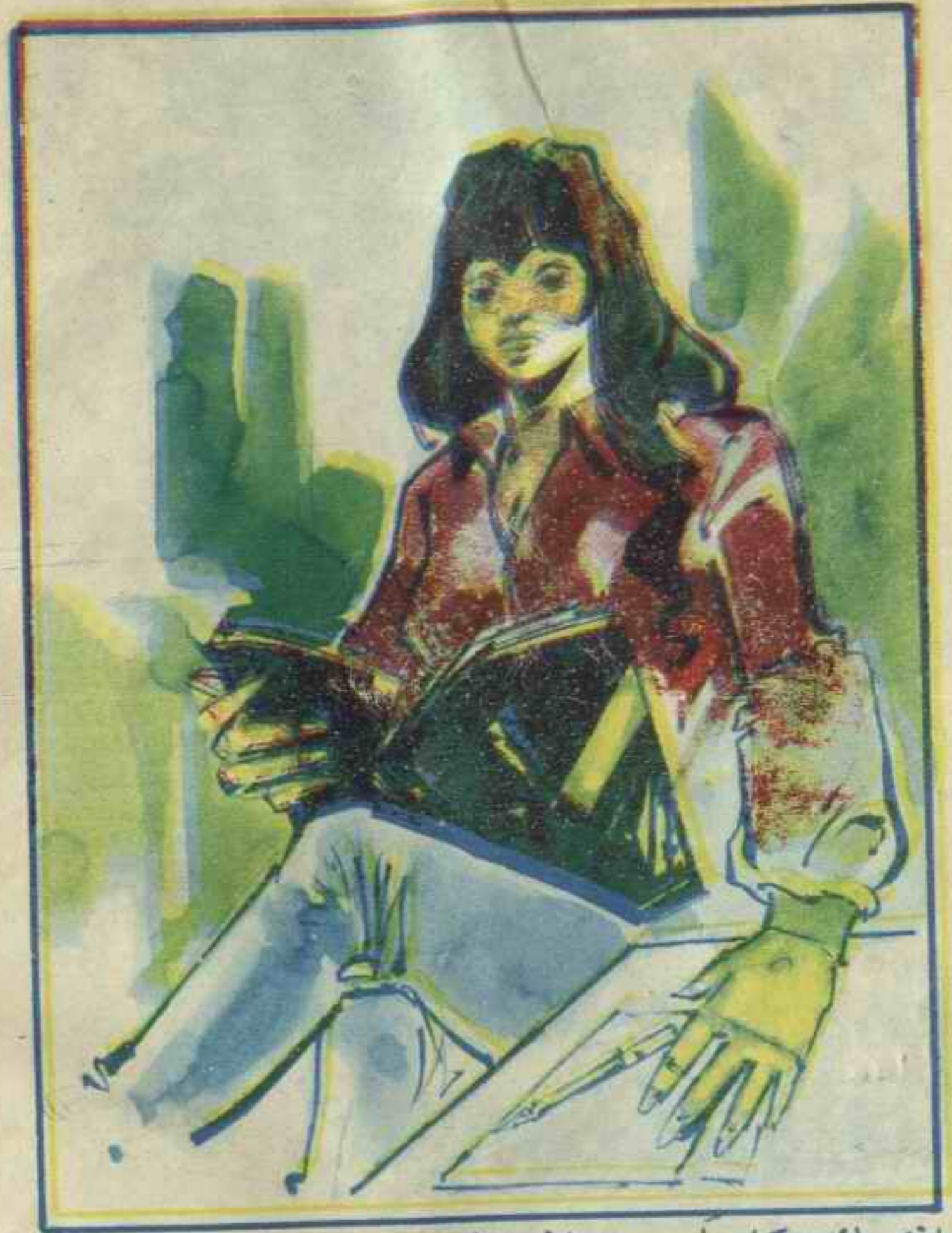
انهمك كل واحد من الشياطين في دراسة الملف ، ووضعت « إلهام » بعض الملاحظات على ورقة بجوارها .

انهمك كل واحد من الشياطين في دراسة الملف . . ووضعت « إلهام » بعض الملاحظات على ورقة بجوارها ، وكذلك فعل بقية الشياطين . . وفي المساء اجتمعوا في القاعة الزرقاء حيث توجد خرائط تفصيلية للعالم كله . . . وطلب « أحمد » من خبراء قسم الخرائط ، وضع علامات