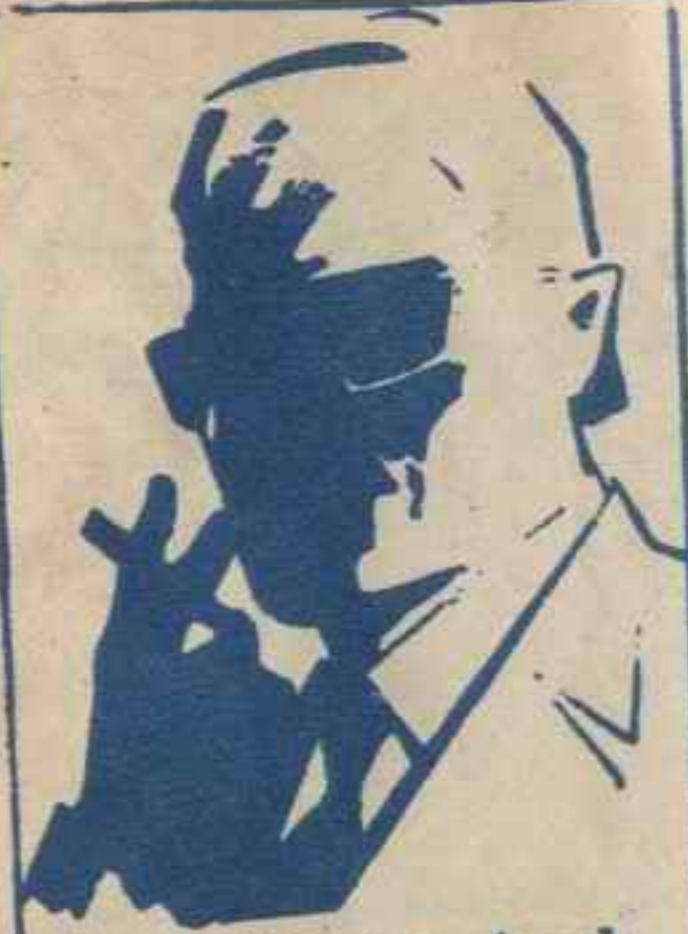
رقم صفر الزعيم الفاضل الذي لا يعرف حقيقة احد ..

انهم ١٣ فتى وفتاة في مثل عمر كل منهم يمثل بلدا عربيا . انهم يقفون في وجه الواغرات الموجهة الى الوطن العربي . . تمرنوا في منطقة الكهف السري التي لا يعرفها احد . . اجادوا فنون القتال .. استخدام المسدسات . . الخناجر . . الكاراتيه . . وهم جميعا يجيدون عدة لغات وفي كل مغامرة يشترك خمسة او ستة من الشياطين معا . . تحت قيادة زعيمهم الفاضل ( رقم صفر ) الذي لم يره احد . . ولا يعرف حقيقته احد . واحداث مغامراتهم تدور في كل البلاد العربية . . وستجد نفسك معهم مهما كان بلدك في الوطن العربي الكبير .