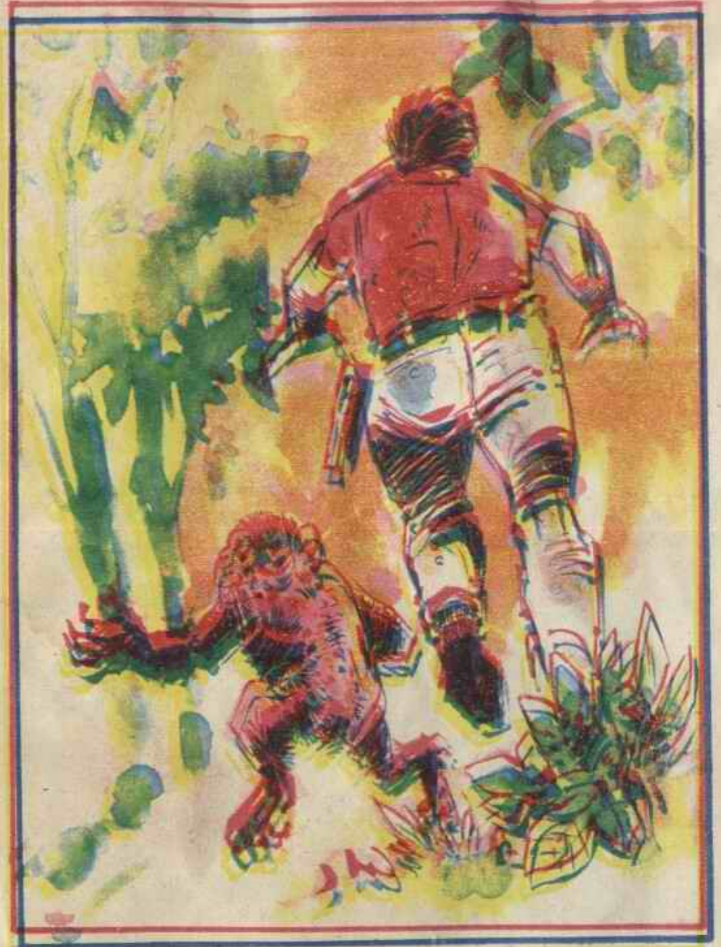
أخذت الانفجارات تتوالى و"أحمد" و"ميسون" يجريان في محاولة للبعد عن مراكز الانفجارات .

أسرع « أحمد » بالنزول إلى الفتحة ، فقد أدرك من حديث الرجل ، أنه أحد زعماء المناطق ، وسيكون من المفيد حقا لمنظمة الشياطين أسره .. ولكن في هذه اللحظة دوى