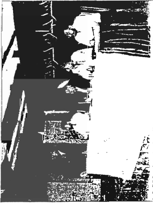
● الشعراء المشاركون بالامسية