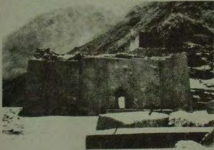
حصن أولياننتايامبو. إبريل/نيسان 1952.

”متبعين مسلك فيلكانو مروراً ببعض المواقع غير المهمة نسبياً، وصلنا أولياننتايامبو، حصن شاسع حيث قام الأنكا امونكو الثاني بحمل السلاح ضد الإسبان مقاوماً قوات هيرناندو بيزارو ومؤسساً سلالة الأنكا الرابعة.”