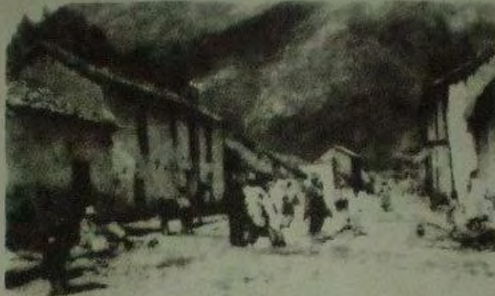
بيساک، قرية في أنديز بيرو. إبريل/نيسان 1952.

بعد أن شقينا طريقنا ببطء ومشقة طوال ساعتين في درب وعمر، وصلنا ذروة بيساك، كما وصلت أيضاً، وإن كان قبل وقت طويل سيوف الجنود الإسبان محطمة المدافع من بيساك ودفعاتها وحتى معابدها.