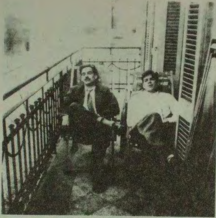
إرنستو جيفارا وصديق في بيونس آيرس، الأرجنتين، 1951