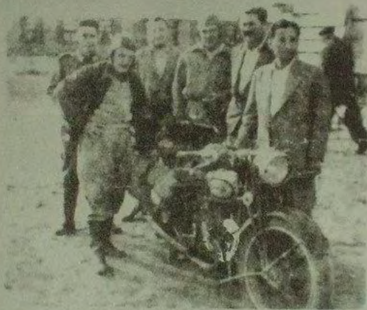
ألبيرتو جراندو (الأمام على اليسار) إرنستو جيفارا (وسط بقية) وأصدقاء مع الجبارة الثانية، 1951 عندما شرع إرنستو وألبيرتو في مغامرتهم.