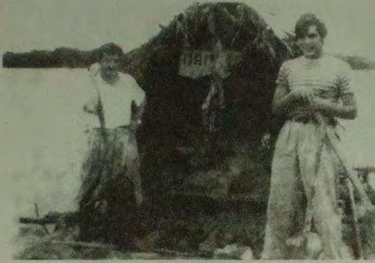
إرنستو جيفارا وألبيرتو جرانادو على متن مامبو - تانغو، يونيو/ حزيران 1952.

كانت الطوافة معدة إلى حد ما وبحاجة إلى مجاديف فقط. قام جمع من مرضى المستعمرة بتقديم حفل غنائي لوداعنا، ضم كثيراً من الأغاني المحلية شدا بها رجل كفيف. تكونت الفرقة الموسيقية من عازف فلوت وعازف قيثارة وعازف أكورديون دون أصابع تقريباً، وصادف وجود عازف معافى ساعد في عزف السيكسفون والقيثارة وبعض آلات النقر.