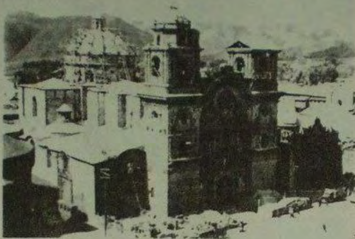
كاتدرائية ماريّا أنغولا. إبريل/نيسان 1952.

دّفعت حكومة الجنرال فرانكو (الإسبانية) تكاليف ترميم أبراج نوافيس الكاتدرائية التي هدمتها هزة أرضية عام 1950، وكإيماءة عرفان صدرت أوامر للفرقة الموسيقية بعزف النشيد الوطني الإسباني... لا يمكنني الجزم إن حدث ذلك بحسن أو سوء نية، إذ أن الفرقة عزفت (عوض ذلك) النشيد الجمهوري الإسباني.