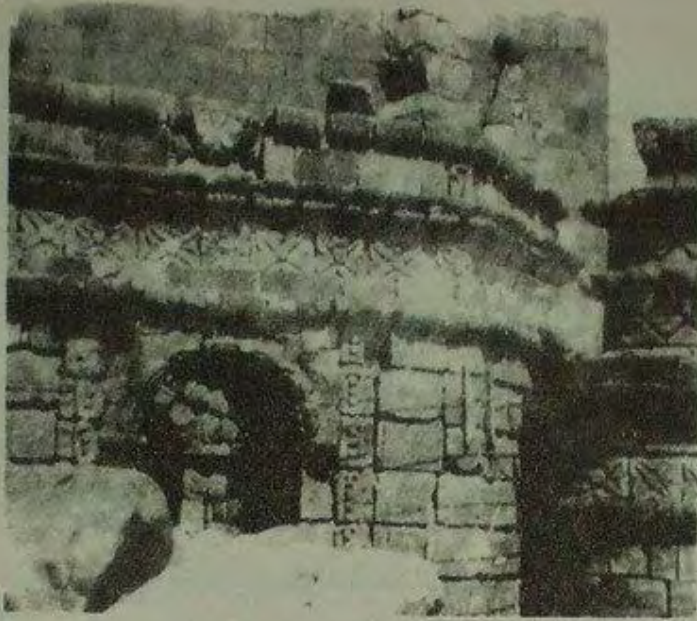
صورة تفصيلية لكنيسة سانتو دومينغو القائمة فوق أطلال "معبد الشمس". إبريل/نيسان 1952.

سويت معابد أنتي بالأرض حتى أساسها أو أن جدرانها شيدت للارتقاء بكنائس الدين الجديد: بنيت الكاتدرائية فوق بقايا القصر العظيم وأقيمت فوق جدران "معبد الشمس" كنيسة سانتو دومينغو، لتكون درساً وعقاباً فرضه الفازي المختال.