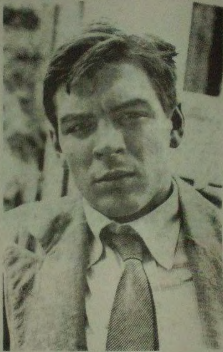
صورة ذاتية، تصوير إرنستو جيفارا، في الأرجنتين، 1951