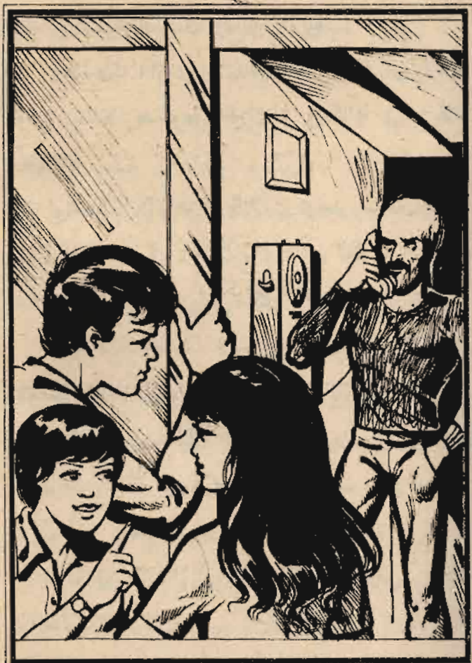
وشاهد المغامرون الثلاثة «بدر» وهو يتحدث في التليفون ..

وأوجه العميد «سبيرو» ناحية كشك الصحف ، وتحدث مع العميد «مانويل» وهو يتظاهر بتصفح بعض المجلات المعروضة - خشية أن يكون هناك من يراقب المكان من رجال العصابة - ثم عاد إلى «الكافيتيريا» بعد شراء صحيفة .