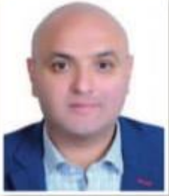
د. محمد فتحى عبد الموال / كاتب وباحث مصري

غير الظرف به صاحبه عن أسرته التي حكمت مصر وأرست بنبان نهشتها، هجده محمد علي باشا دفن بمسجده بالقاهرة، وأبوه الخديو اسماعيل ونسبه دفنوا في مسجد الرفاعي، أما شخصيتنا اليوم اختار أن يكون قبره بمقابر الجاورين بمنشية ناصر بالظاهره حالياً، شأته الأقدار أن يكون صاحب القبر المخرده موسوماً بشهامة عظيمة، وهي جلب الاحتلال وتكبيته من بلاد... إنه الخديو محمد توفيق باشا، والذي لم يتلق المؤرخون حوله، فلمهم من دافع عنه، خاصة من شهدوا حوادث الثورة العربية عن كتب وروا أن الرجل سلبت منه كافة سلاحياته كحاكم وأصبحت لدى أحمد عربي ورفاقه، وأن عربي أدخل مصر في مفاخرة عسكرية غير مصدقة الحواشي أمام قوة كبيرة كير بطانيا دون استعداد، ربما عن أئف الخديو والباب العالي، مما أدخل مصر في أتون احتلال دام أكثر من سبعين عاماً، فيما راي المؤرخون المعاصرون أن الخديو بطوره ومسحبه الاميرال ابوشامب سيمور قائد الأسطول البريطاني في مصر الرتل بالانكليزية كان شرعية فاسية للحركة الوطنية والاستقلال بلا ده. أما كان الامر موضوع حقلتنا سوف يكون من منظور مغاير وغير تقليدي من الوجه الآخر لتوفيق باشا... فهو الرجل المحب للتعليم والثقافة الذي عني بالبناء المدارس تحت رعايته ودعمه، كما ألقى الشرب بالمسومة الذي أذهب ظهور الضالين لعقود طويلة، وذلك في عهد رئيس نظارته ويباش باشا علاوة على عهده عن المشاركين في الثورة العربية من الأهل وإنشاء مجلس شورى القوانين والحاكم الأهلية والنشاء عدل ترخ بالقرى والمدن. فترت توفيق كذلك بتعيينه الشديدي وزيره للمدن والأقاليم المصرية القبلية والبحرية لثلاثة شؤنها، وسابق الأهل والأعيان في إظهار الولاء له عبر الزينات والاحتفالات، كما أنه ألقى الدعوة إحدى مظاهر العرق السوفية البشعة والإنسانية وفيها