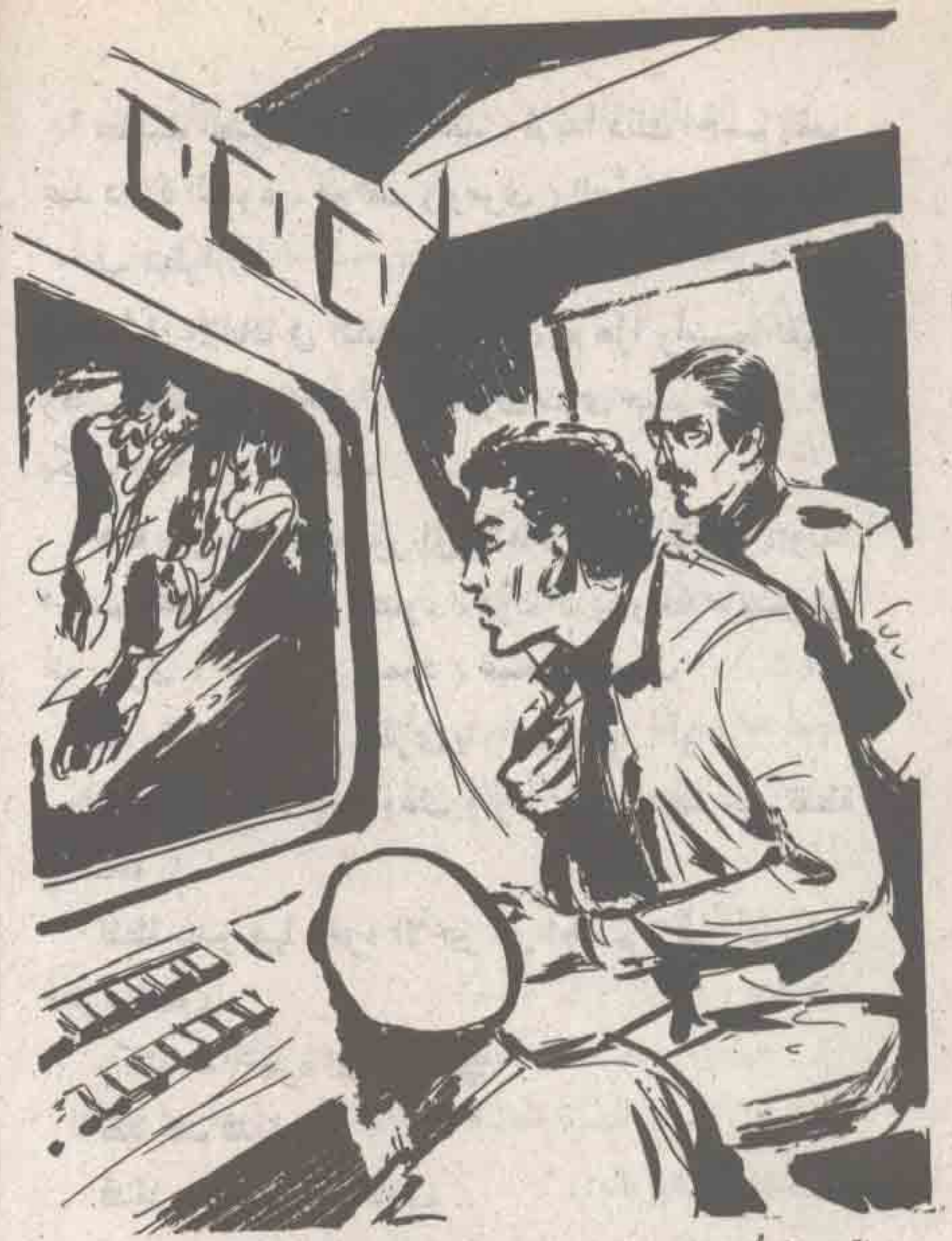
تعاقبت الصور في ببطء شديد ، ثم بدأ ذلك الجسم يظهر عند دائرة الضوء ، فأوقف ( رمزي ) الصورة ، هاتفاً : انظرا .