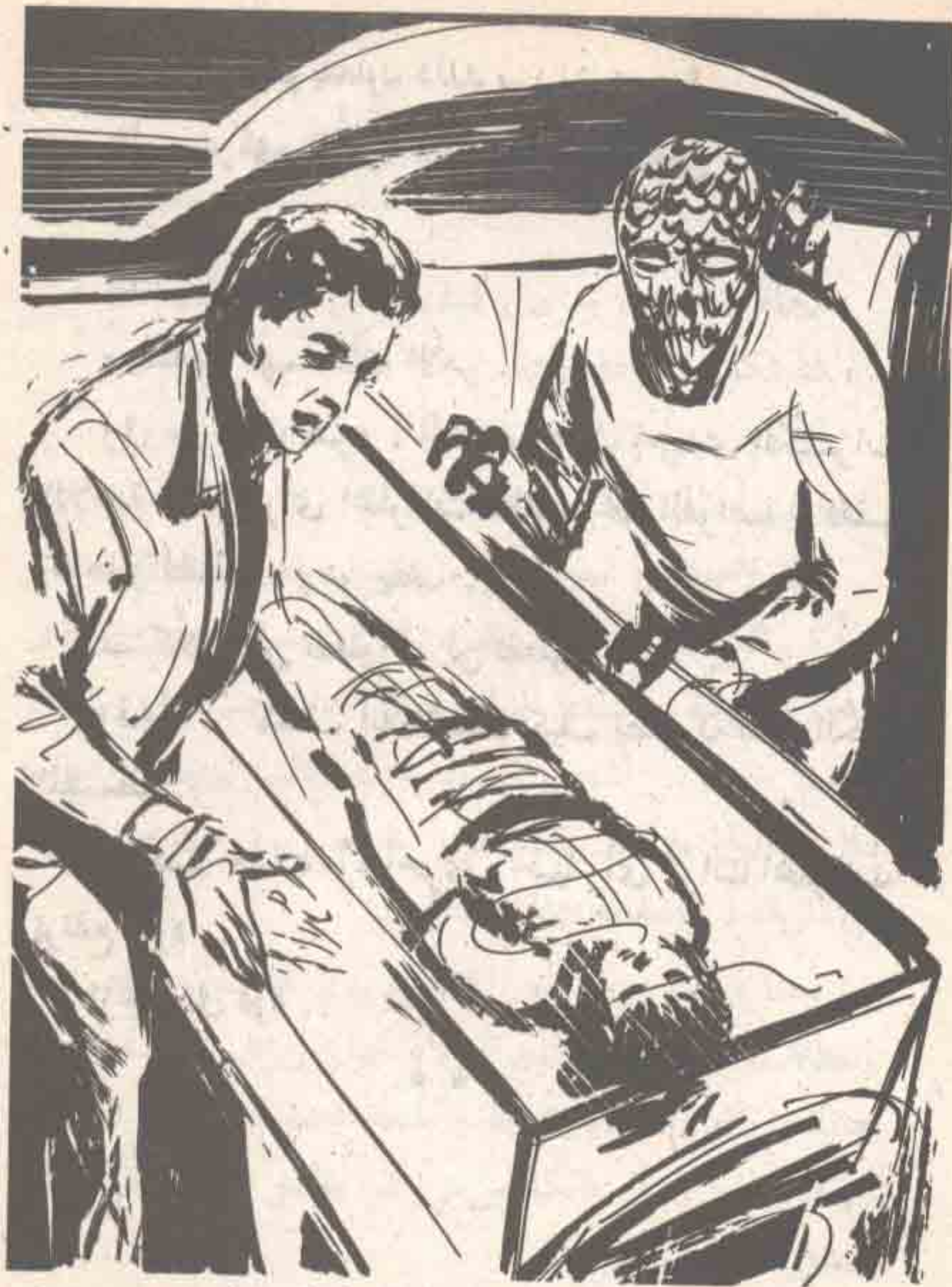
وخفق قلبه في اطمئنان ، حينما رفع المخلوق الغطاء ، فوجد ( رمزي ) ( نشوي ) ترقد داخله ، بجسد طفلة في العاشرة ، استغرقت في نوم عميق ..