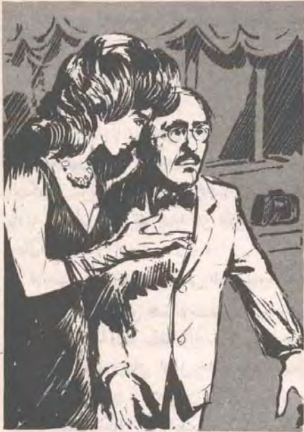
.. شحب وجه (كيخوته) ، وقال هامسًا : — هل كشفوا الأمر يا (دونا) ؟ ..

وبرقة اعتذرت من مدير الشرطة ، الذي قبل أناملها باحترام ، وأخذت تبحث في الحفل عن (كيخوته) ، وهي تحرص على ألا تفارقها ابتسامتها الرقيقة طوال الوقت ، ولم تسس أن تلقى بعدة عبارات مجاملة رقيقة ، حتى وجدت (كيخوته) .. فقالت ببساطة وكأنها لم تقصد مقابله :