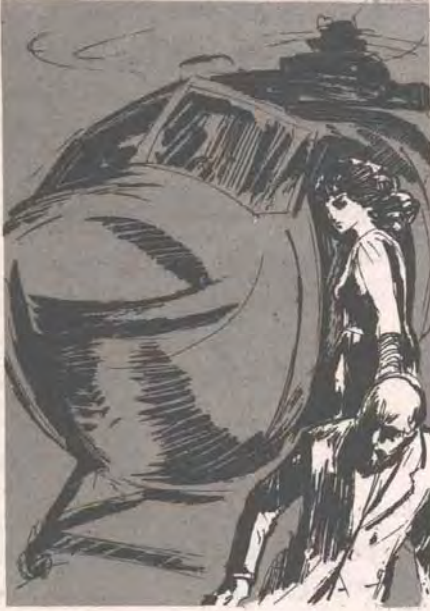
.. وفجأة دفعت الحاكم بعيداً ، وقفزت داخل الطائرة التي ارتفعت بسرعة ..

هبطت ( المليكوتير ) في المربع المخصص لمبوطها ، فاقتربت منها ( دونا ) بهدوء دون أن تتخلى عن ابتسامتها الرقيقة ، وفجأة دفعت الحاكم بعيداً ، وقفزت داخل الطائرة التي ارتفعت بسرعة ..