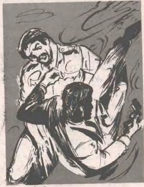
.. ثم مال بجسده في الهواء قبل أن تستقر قدماه على الأرض والقط المسدس الطائر ..

تفجرت فيهما الدموع ، وصاحت بألم : — مستحيل .. لا يمكن أن ينتهي (أدهم) بهذه