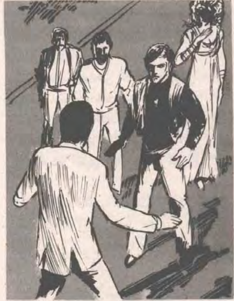
.. وكان هذه العبارة تحمل تصريحاً للحراس ، فقد تحركوا فور سماعهم صوت (أدهم) ، وقد ففز الشر من عيونهم ..

هب فجأة ، أو أن بركاناً قد انفجر في وجوههم