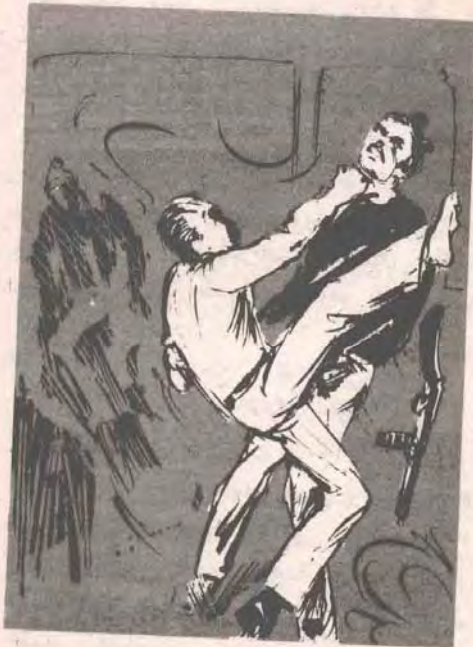
.. قفز العجوز برشاقة مذهلة ، وركل المدفع الرشاش الذي يمسك به أقرب المختطفين إليه ..

عدة صيحات فزعمة من حناجر النساء ، عندما قذف العجوز حذاءه بمركبة مفاجئة على الرجل الذي يمسك بالمسدس ، فأطاح به بعيدًا ، وصرخ المختطف وكان الحذاء مصنوع من الصلب .