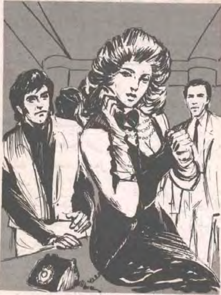
.. تناولت (دونا ماريبا) الهاتف بمركبة رشيقة ووضعته على أذنها ، وسرعان ما ضاقت حدقتهاها ، واتهمت عيناها الخضران وان بيريق شرس ..

ضحكت (دونا) بفخر وغرور ، في نفس اللحظة التي اقترب فيها أحد رجالها وهو يحمل هاتفًا لاسلكيًا ، وقال :