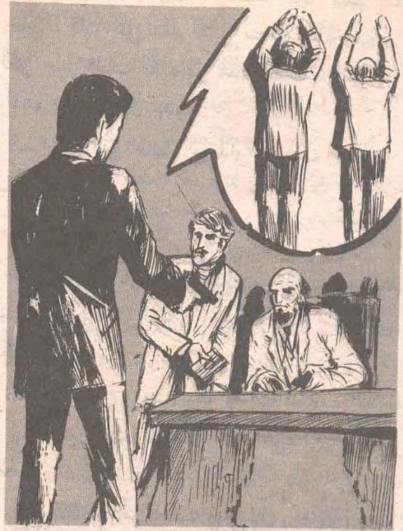
قال ( أدهم ) بهدوء : « استديرا إلى الحائط ، وحذار أن يقترب أحدكم من الباب » ..

- تياً لسلام الطوارئ هذه .. إنها تسمح لأى كائن كان بالدخول والخروج من النافذة وقتما يحلو له .