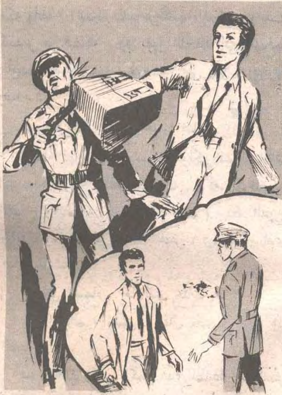
وما أن أصبح (أدهم) في الممر الخارجي ، حتى وجد أمامه شرطيًا آخر يصوب مسدسه إليه ..

وبوغت الشرطي الثاني بحقيبة (أدهم) وهي تشق طريقها إلى وجهه ، وقبل أن يتخذ الإجراء المناسب شعر بألم بالغ في فكه ، ودارت عيناه في محجريهما ، عندما اصطدمت الحقية الثقيلة بوجهه .. وقبل أن