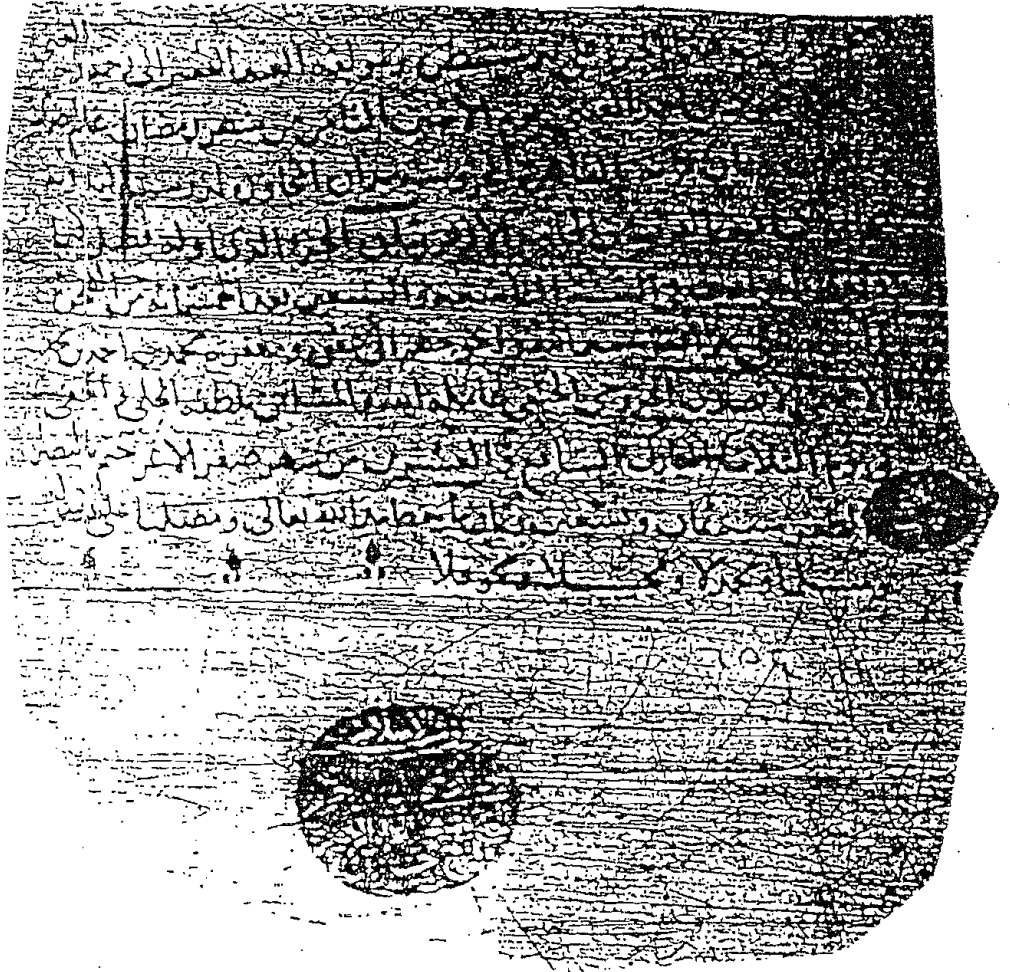
لوحة ٣ من نسخة معهد المخطوطات العربية رقم ١٩/٢٩١١ المصورة من مكتبة أحمد الثالث بتركيا .