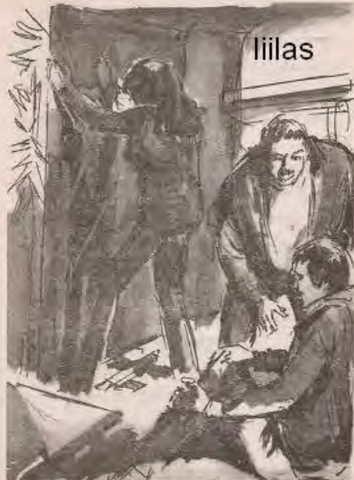
أسرعت تجذب الباب المعدني الثقيل بكل قوتها ، ودوى الرصاصات المرتطمة به يتفجر في أذنيها ..