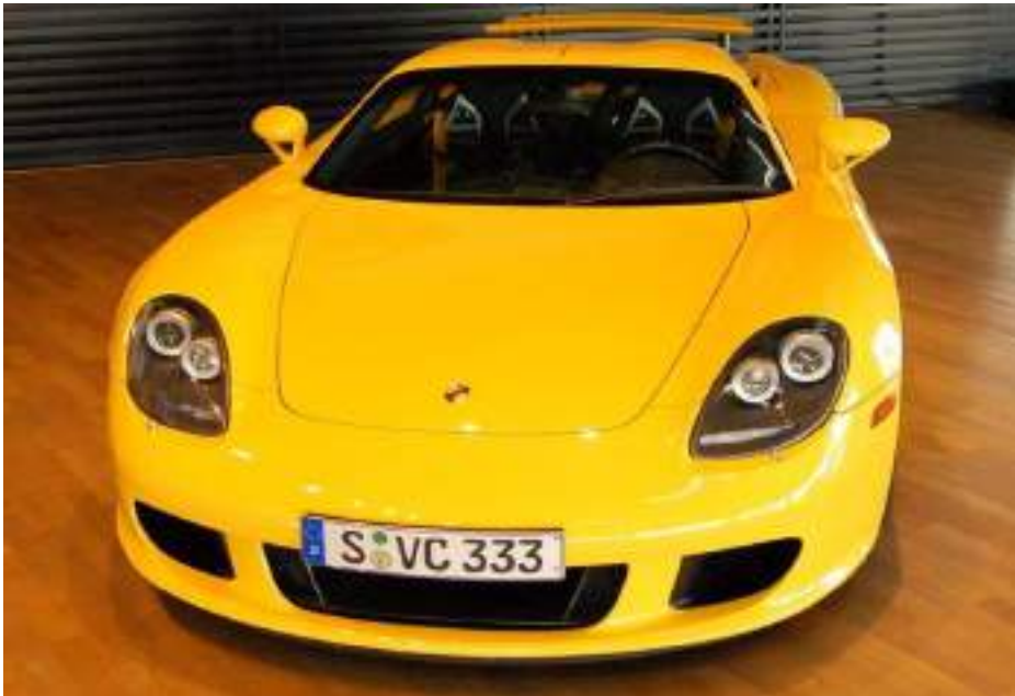
بورش كاريرا صفراء