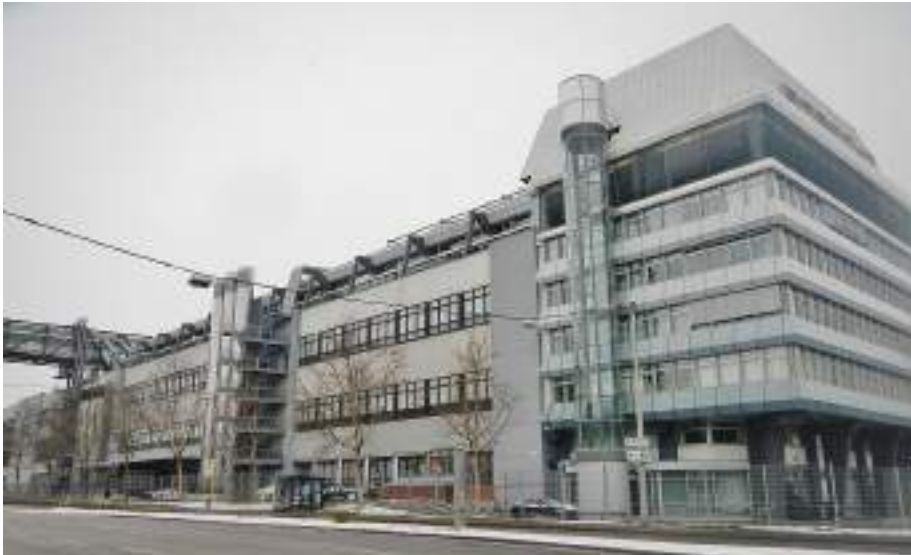
مبنى بورش ايه جي

وتتسارع هذه السيارة من 0-100 كم/س 2.0 ثانية وتبلغ سرعتها القصوى 450 كم/س وتولد 900 حصان وحجم محركها 5.0 ليترات ذو 8 اسطوانات مع ناقل حركة PDK هذا يعني انها اقوى سيارة في العالم وانها تحتوي على اقوى علبة تروس في العالم وانها اغلى سيارة في العالم ولذلك تسمى هذه السيارة بالاسطورة.