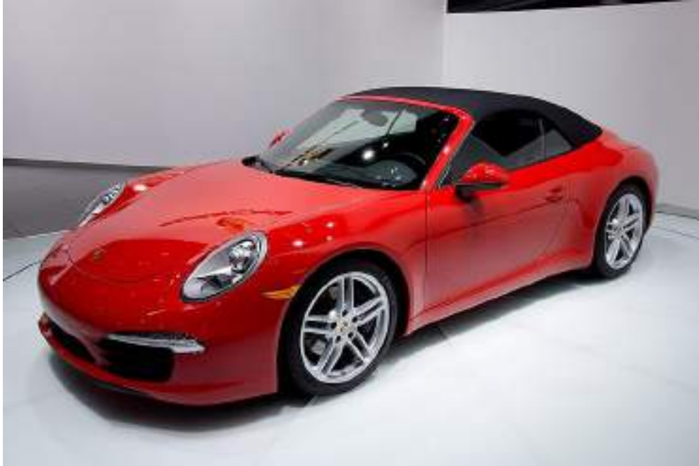
NAIAS Red Porsche 991 convertible (world premiere)