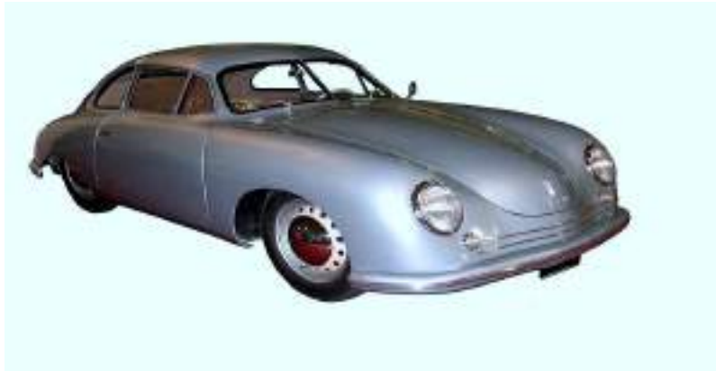
Porsche 356 Pre-A 1948