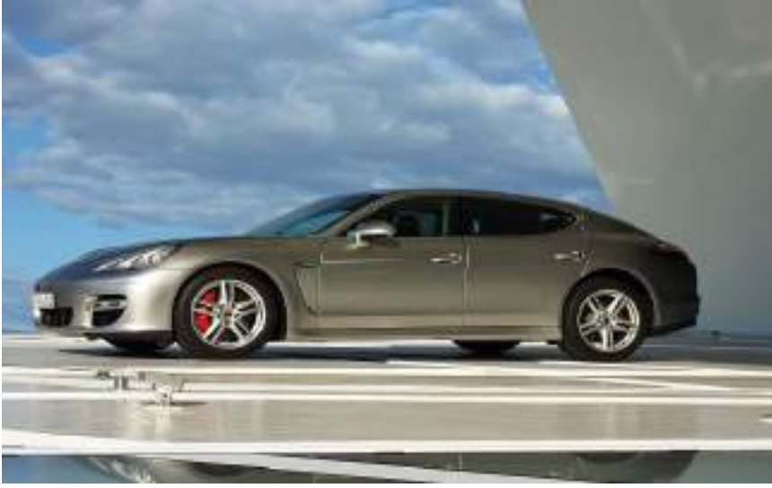
باناميرا في معرض بورش

ويستخدم إصدار توربيني (Turbo) الديناميكا الهوائية النشطة مع جناح خلفي قابل للتعديل متعدد المراحل. وتتضمن حزم كرونو الرياضية الاختيارية زر سبورت بلس، الذي يحتوي على تخميد أكثر إحكامًا ونوابض هوائية، ويخفض جسم السيارة بمقدار 25 مم (1.0 بوصة). في عام 2011 تمت إضافة طرازات باناميرا إس هايبرد وديزل وتوربو إس ومتغيرات جي تي إس إلى المجموعة. وتحقق GTS تسارعًا جانبيًا يبلغ 0.96 جرامًا.