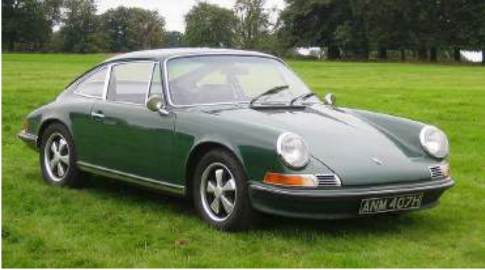
Porsche 911E ca 1969