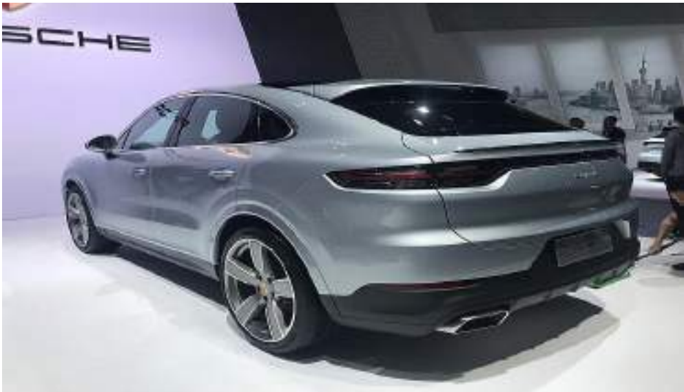
Porsche Cayenne Coupe 002