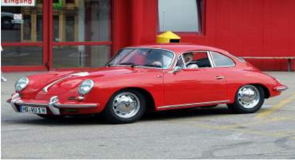
Porsche 356 Coupe (1964) p1