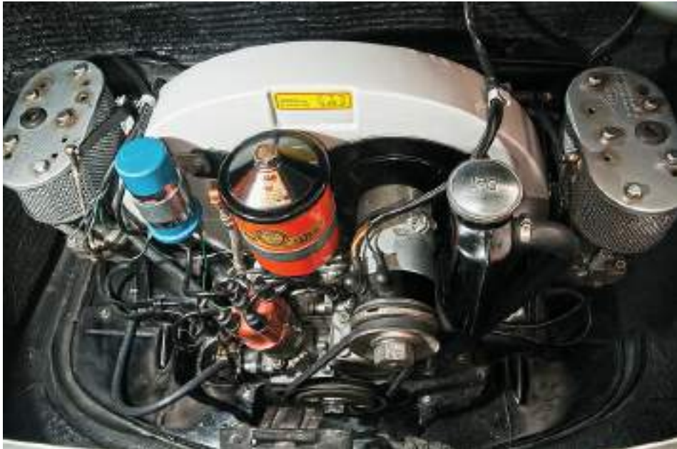
The Porsche 356 01