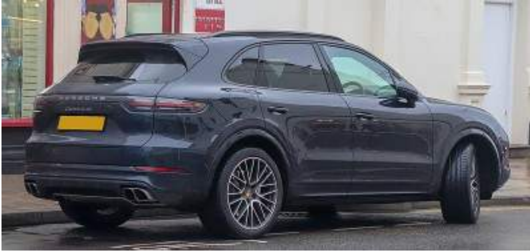
بورش كايين V8 توربو تيبترونيك 4.0 خلفي