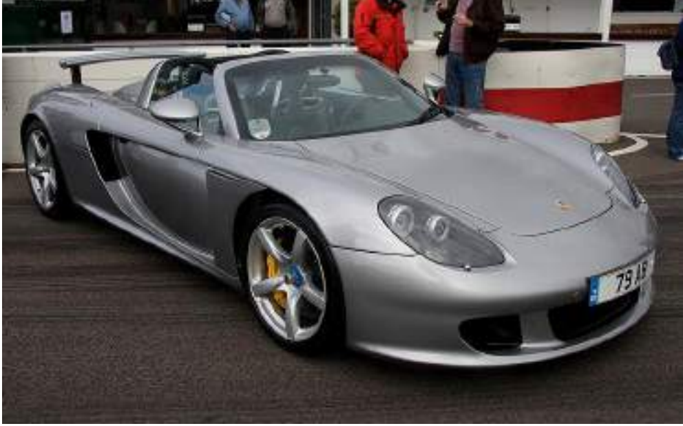
Porsche Carrera GT - Goodwood Breakfast Club (July 2008)

( هي سيارة رياضية تم إنتاجها Porsche Carrera GT بورش كاريرا جي تي (بالإنجليزية: من قبل شركة بورش.