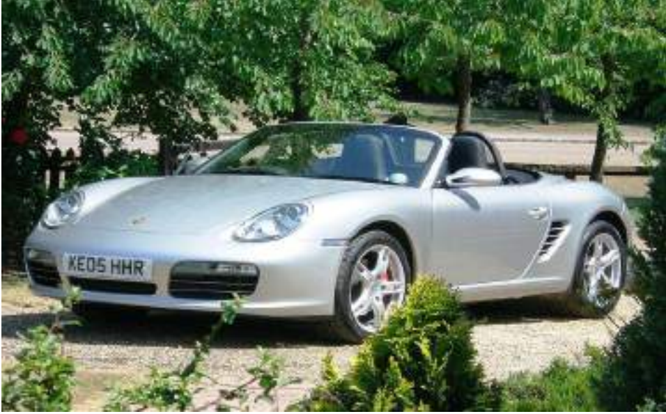
بورش بوكستر 987