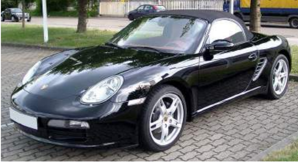
Porsche Boxster front

بورش بوكستر (بالإنجليزية: Porsche Boxster) هي سيارة رياضية يتم إنتاجها من قبل شركة بورش.