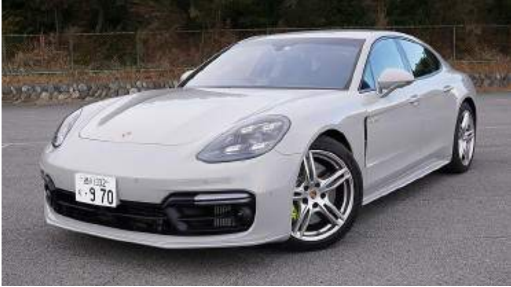
2017 بورش باناميرا 4 E-هايبرد (اليابان)