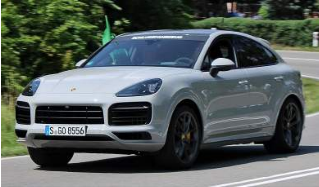
Porsche Cayenne Coupé S Solitude Revival 2019 IMG 1600

في عام 2018 كشفت شركة بورش عن الجيل الثالث من سيارة كايبين في معرض فرانكفورت الدولي للسيارات، بمحرك توربو من 8 أسطوانات وسعة 4 لترات ويولد قوة 550 حصاناً، كما كشفت الشركة عن موديلها الجديد porsche cayenne 2019، وهي سيارة هجينة رباعية الدفع ذات طابع رياضي ومتعددة الاستخدامات، بمحرك 6 أسطوانات يولد قوة 335 حصاناً وسعة 3 لترات لتر، بالإضافة إلى محرك كهربائي بقوة 134 حصان، ما يمنحها قوة إجمالية 455 حصاناً