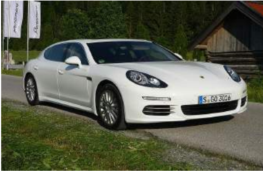
موديل 2013 بعد التغيير