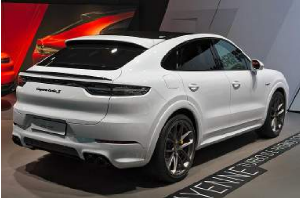
Porsche Cayenne Coupé Turbo S E-Hybrid at IAA 2019 IMG