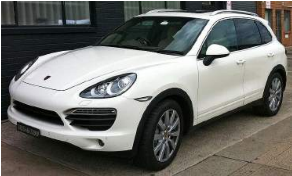
(03-08-2011) Porsche Cayenne (92A MY11) S wagon