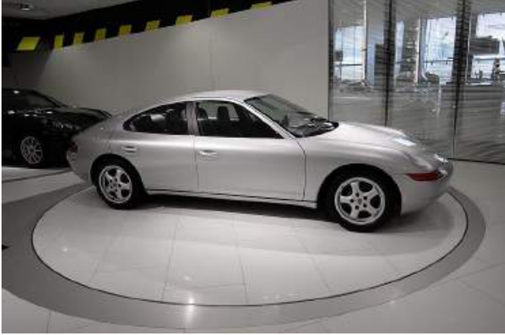
مفهوم بورش 989 في متحف بورش في شتوتغارت في ألمانيا