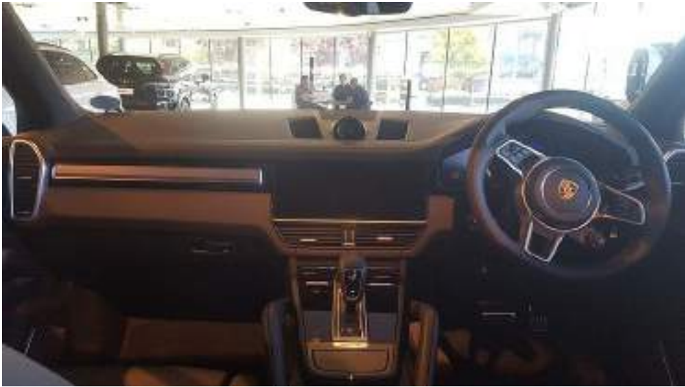
Porsche Cayenne S Interior