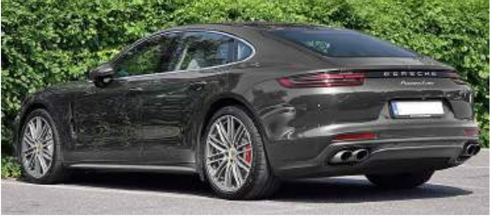
بورش باناميرا توريو فاستباك سيدان (أوروبا)