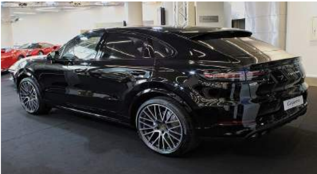
Porsche Cayenne Coupé Top Marques 2019 IMG 1053