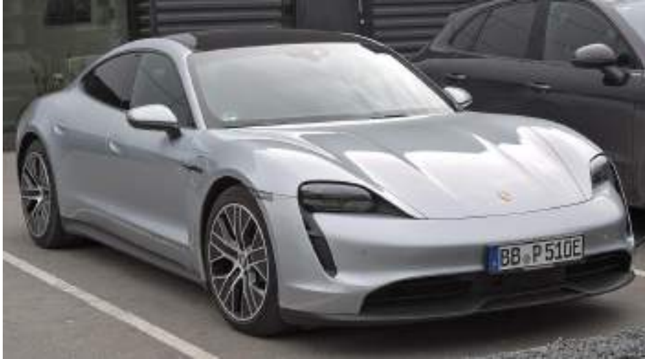
بورش تايبان S4