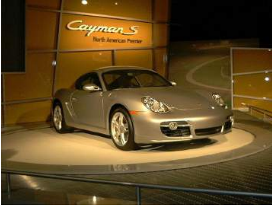
بورش كايمان إس في معرض بلوس انجلوس