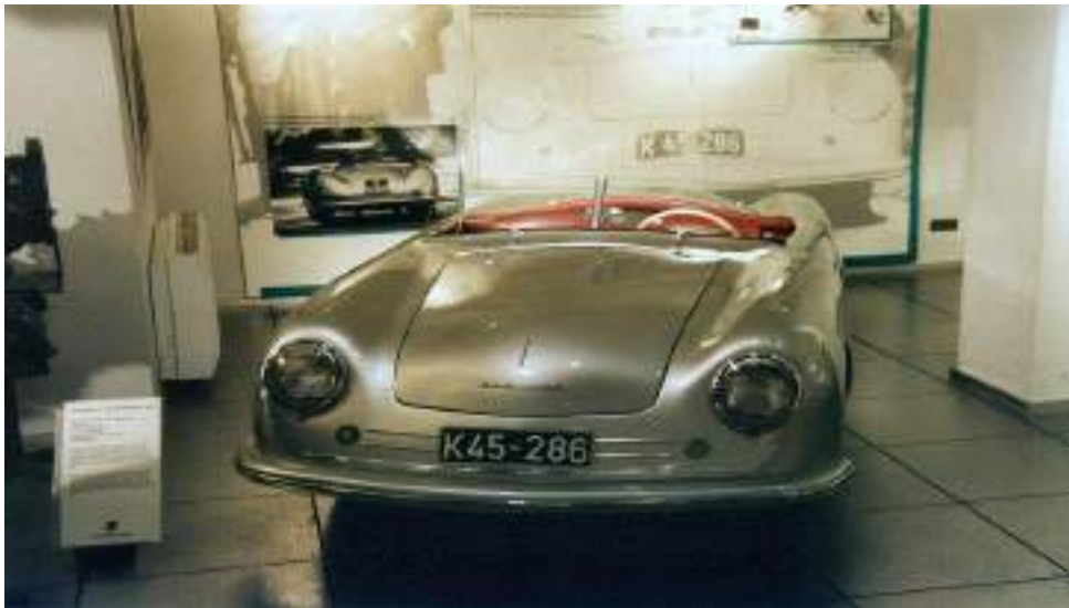
بورش 356 أقدم سيارة بورش