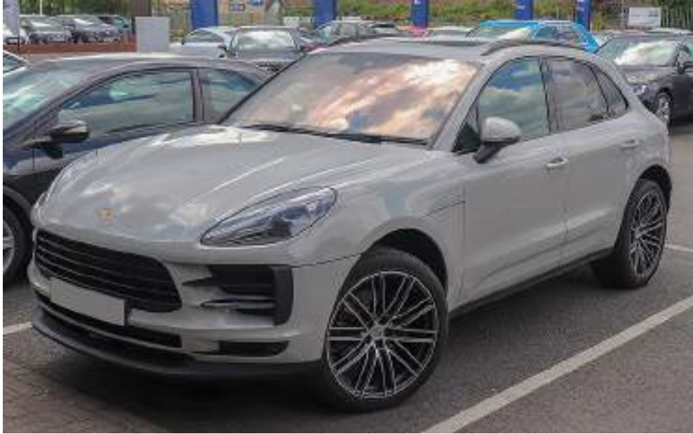
Porsche Macan S-A facelift 2.0 Front