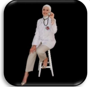
تفوق ونجاح / أخبار

من جامعة العلوم والتكنولوجيا في المملكة الأردنية, ويتخصص: الطب والجراحة العامة.