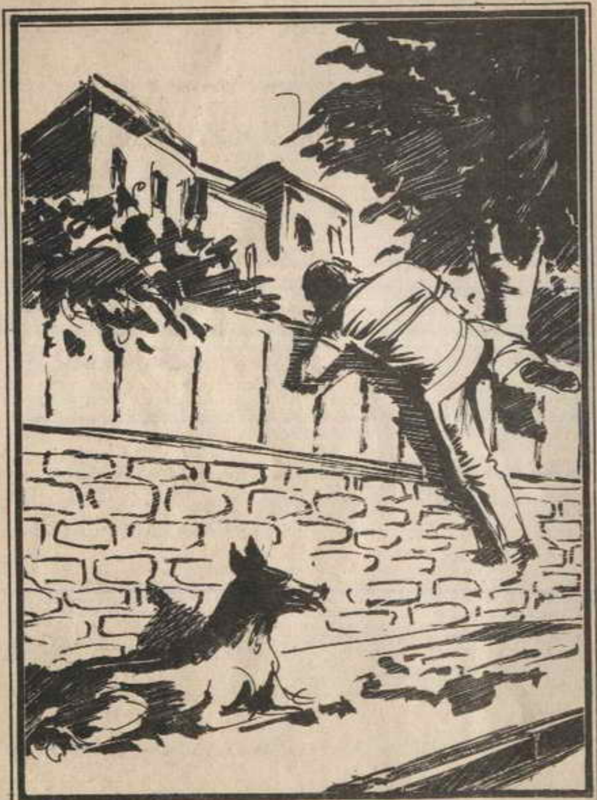
وبسرعة تسلق «تختخ» سور الحديقة وجلس «زنجير» في انتظاره

الحديقة حتى سمع نداءً خافتاً : « تختخ » « تختخ » ! وعرف « تختخ » على الفور أنه صوت « نوسة » ، فاتجه إلى المكان ، ووجد الفتاتين مخفتين خلف شجرة ضخمة .. قال هامساً : هل حدث شيء ؟ نوسة : هناك سيارة كبيرة ، وصلت منذ قليل ، ودخلت الحديقة ثم أغلقوا الأبواب ! أخذ « تختخ » يتأمل منزل الدكتور .. كان الظلام يجيم عليه تماماً ، ولا يبدو فيه أى أثر للحياة . قال « تختخ » هامساً : ابقيا هنا .. سوف أذهب لأرى وأعود إليكما ! وانطلق « تختخ » في الظلام ، وأشار لـ « زنجير » أن ينتظره .. اقترب من سور الحديقة ، ونظر حوله .. لم يكن هناك أحد .. وبسرعة تسلَّقه ، وقفز إلى الحديقة ، وتوقف ينصت لحظات .. لم يسمع شيئاً ، فتقدم من إحدى النوافذ ، وأخذ يحاول أن يشاهد