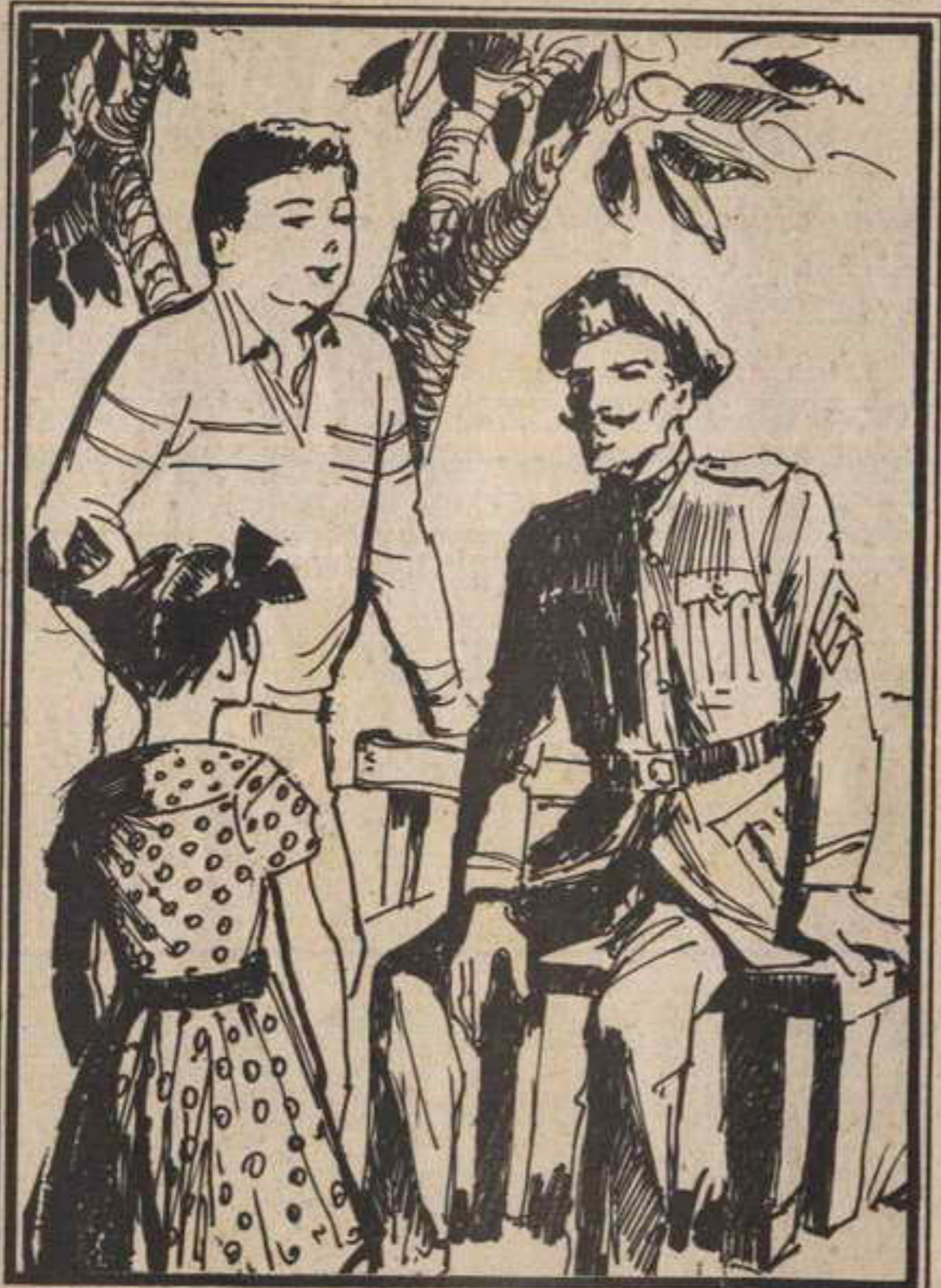
دعا الأصديق الشاويش «فرقع» إلى الجلوس معهم ..

تختخ: إننى لا أعرف طبعاً .. ولكن من المفروض أن نعتمد على أنفسنا ، وخاصة أن المفتش «سامى» مسافر .. والوقت أمامنا ضيق للعثور على الفتاة ! وكأنما الحديث عن الشرطة قد استحضر رجال الشرطة .. فلم يكده «تختخ» ينتهى من جملته حتى ظهر الشاويش «فرقع» على باب الحديقة .. كان غارقاً