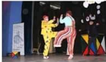
عروض ترفيهية عنوانه " العطلة السوداء " على خشبة مسرح " قاعة يسر لولاية بومرداس " . عروض مسرحية بعنوان " العطلة السوداء " على خشبة مسرح " قاعة يسر لولاية بومرداس " . عروض مسرحية بعنوان " العطلة السوداء " على خشبة مسرح " قاعة يسر لولاية بومرداس " .