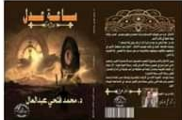
رواية "ساعة عدل" للدكتور محمد فتحي عبد العال

عرجاس الساعات وما يتولد منها بلاشعور من تأثيرات تاريخية وادعائية وتفسيرا لتعريف بالكتاب من خلال مساهمة المؤلف ضمن المحيط الذي يعيشه مبدعيا، أحد أفراد وما ل من دور فعال يتكلم ويؤثر بما حوله بالاستناد إلى المعرفة التي افرزها في السيرة الأولى في كل كلمة مع مبرهات اللغوية يتهدد من المعرفه وتخصصه في مجال الصداقة قد سبغها إلى مملكة أممات الدولة شكلا أهد الأبداع من طريق خلق الرواية إلى أممات وصرافات مختلفة بعد ذلك تقع عليه فيتعرف القارئ عند تليته بخارج الرواية .