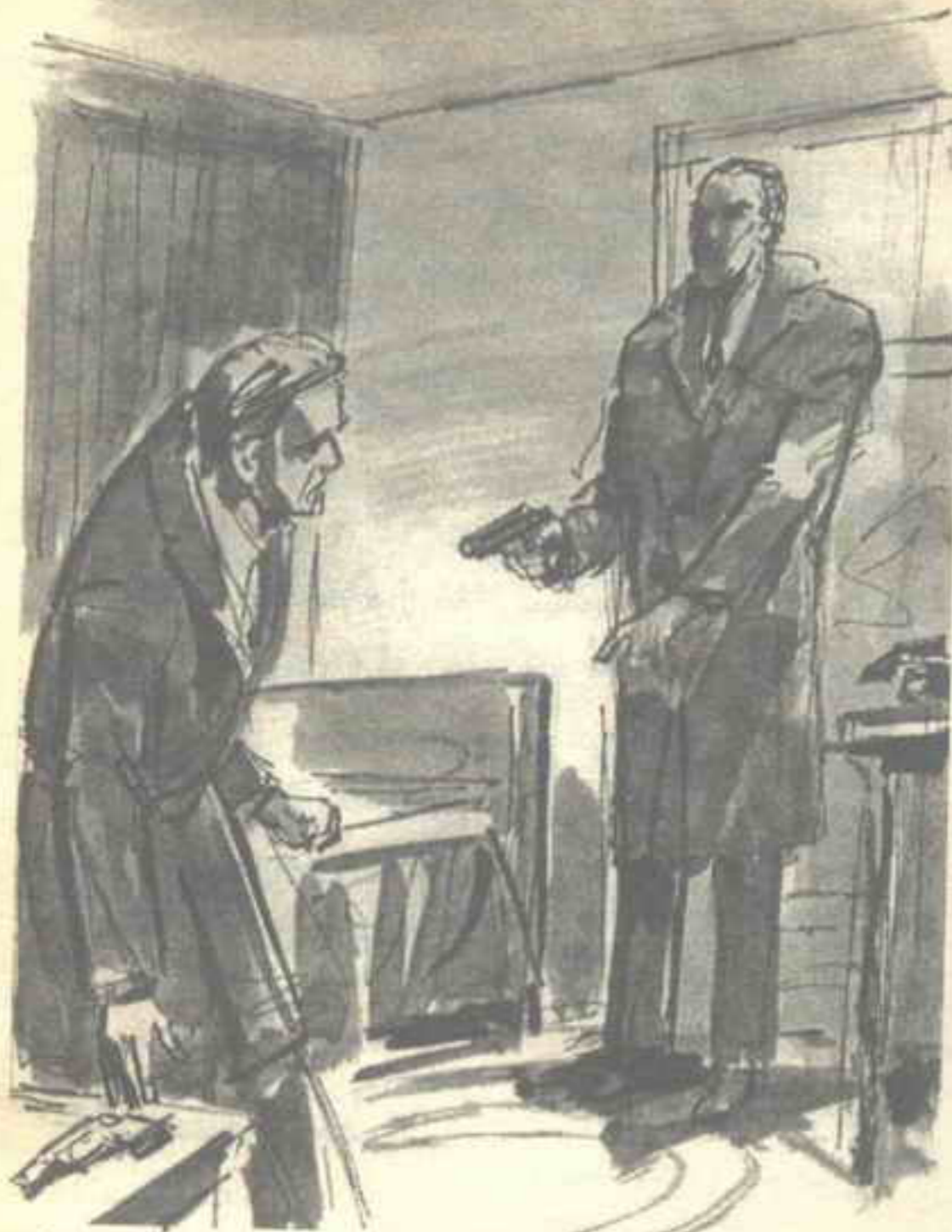
تجمدت يد ( جولدمان ) في موضعها ، والتفت إليه ، قائلاً في دهشة : - ( دافيد ) .. هل جننت !؟ ..

رفع ( دافيد ) عينيه إليه بحركة حادة ، واحتقن وجهه في شدة ، على نحو أصاب الرجال بالقلق ، فغمغم أحدهم :