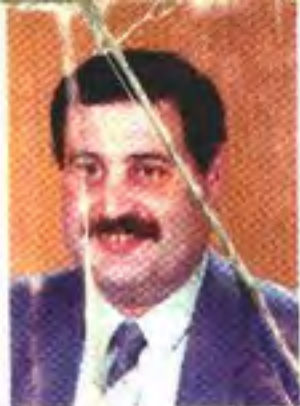
د. نبيل فاروق