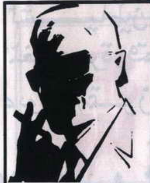
رقم . صفر، الزعيم الغامض الذي لايعرف حقيقته احد ..