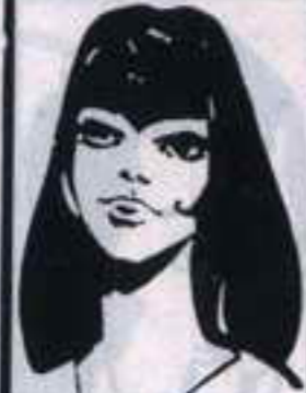
رقم ٣ - الهام من لبنان