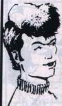
رقم ٦ - مصباح من ليبيا