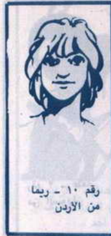
رقم ١٠ - ريمما من الأردن

وعندما عاد الشياطين من مغامرة فئران نيويورك، التي انتهت بالقبض على زعيم العصابة «بازولينى» بواسطة البوليس الأمريكى كان عنصر جديد قد برز فى الصورة.. هذا المجرم العاتى