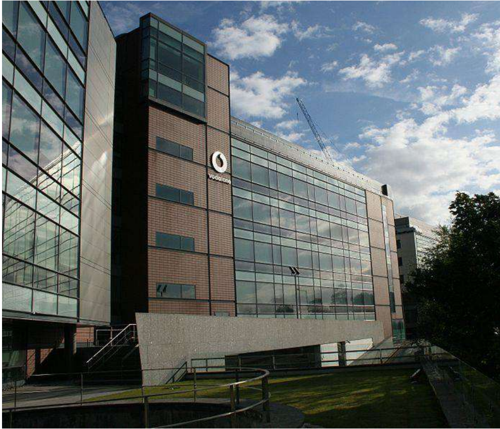
المقر الرئيسي لشركة فودافون إيرلندا في دبلن.

وتخطط لإلغاء 400 وظيفة ؛ أبلغت عن تكاليف غير متكررة قدرها 23.5 جنيه إسترليني مليار دولار بسبب إعادة تقييم فرعها في مانسمان. في 24 يوليو 2006، استقال الرئيس المحترم لشركة فودافون أوروبا، بيل مورو، بشكل غير متوقع، وفي 25 أغسطس 2006، أعلنت الشركة عن بيع حصتها البالغة 25٪ في شركة بروكسيموس البلجيكية مقابل 2 يورو. مليار. بعد الصفقة، ظلت بروكسيموس جزءًا من المجتمع كشبكة شركاء.