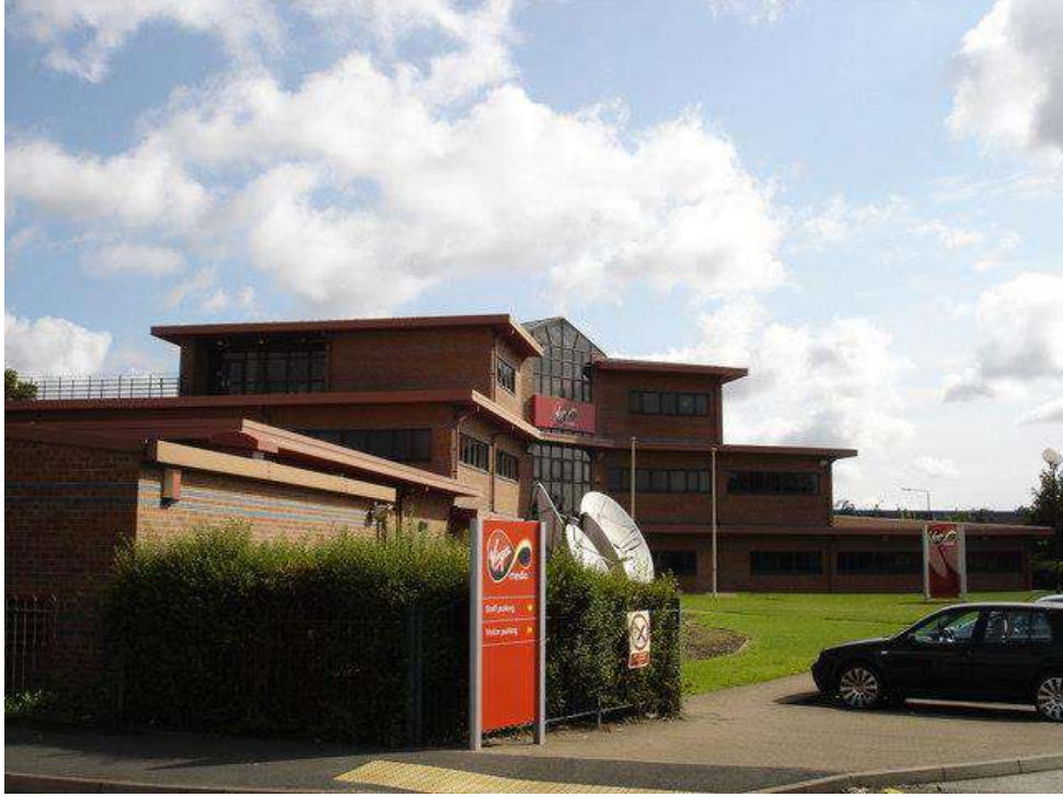
مكاتب فيرجن ميديا في نوتنغهام

، وهي خدمة عند الطلب، على حقوق بدء عرض حلقات من Virgin Central في فبراير 2007، حصلت OC و Alias ، وعروض أخرى بما في ذلك (Sky 1 معروض بالفعل على) البرنامج التلفزيوني Teleport تمت إعادة تسمية Teleport TV وسعت هذه الخدمة الخدمة عند الطلب المعروفة سابقاً باسم الذي يقدم برامج تم بثها مؤخراً وعروضاً ومسلسلات أخرى TV Choice باسم TV