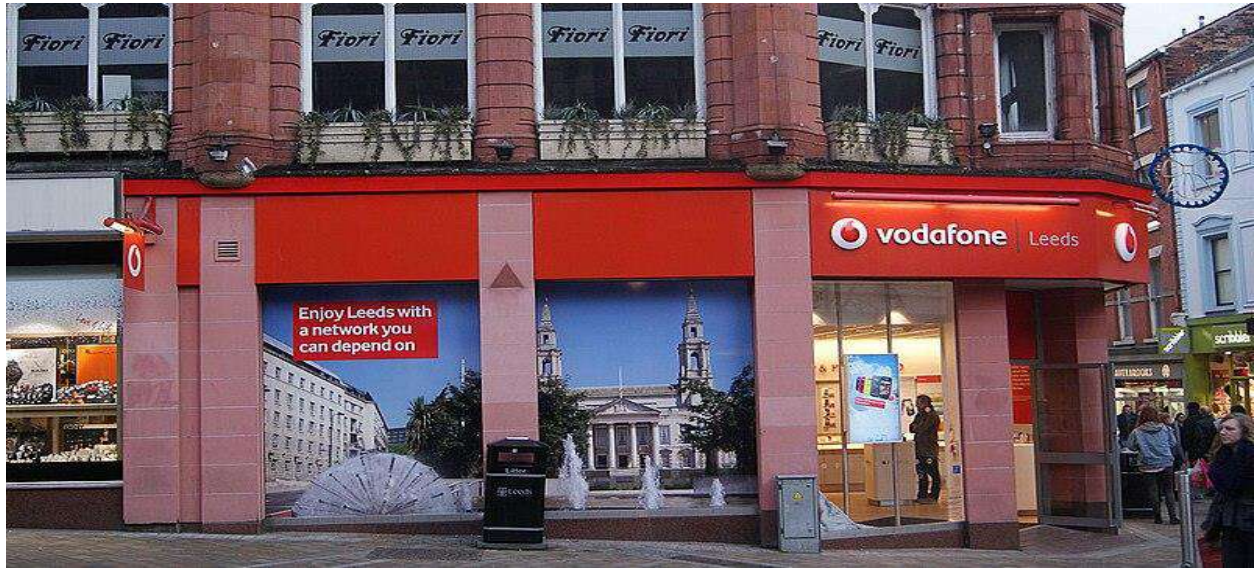
متجر فودافون يبيع مجموعة من المنتجات في ليدز، إنجلترا.