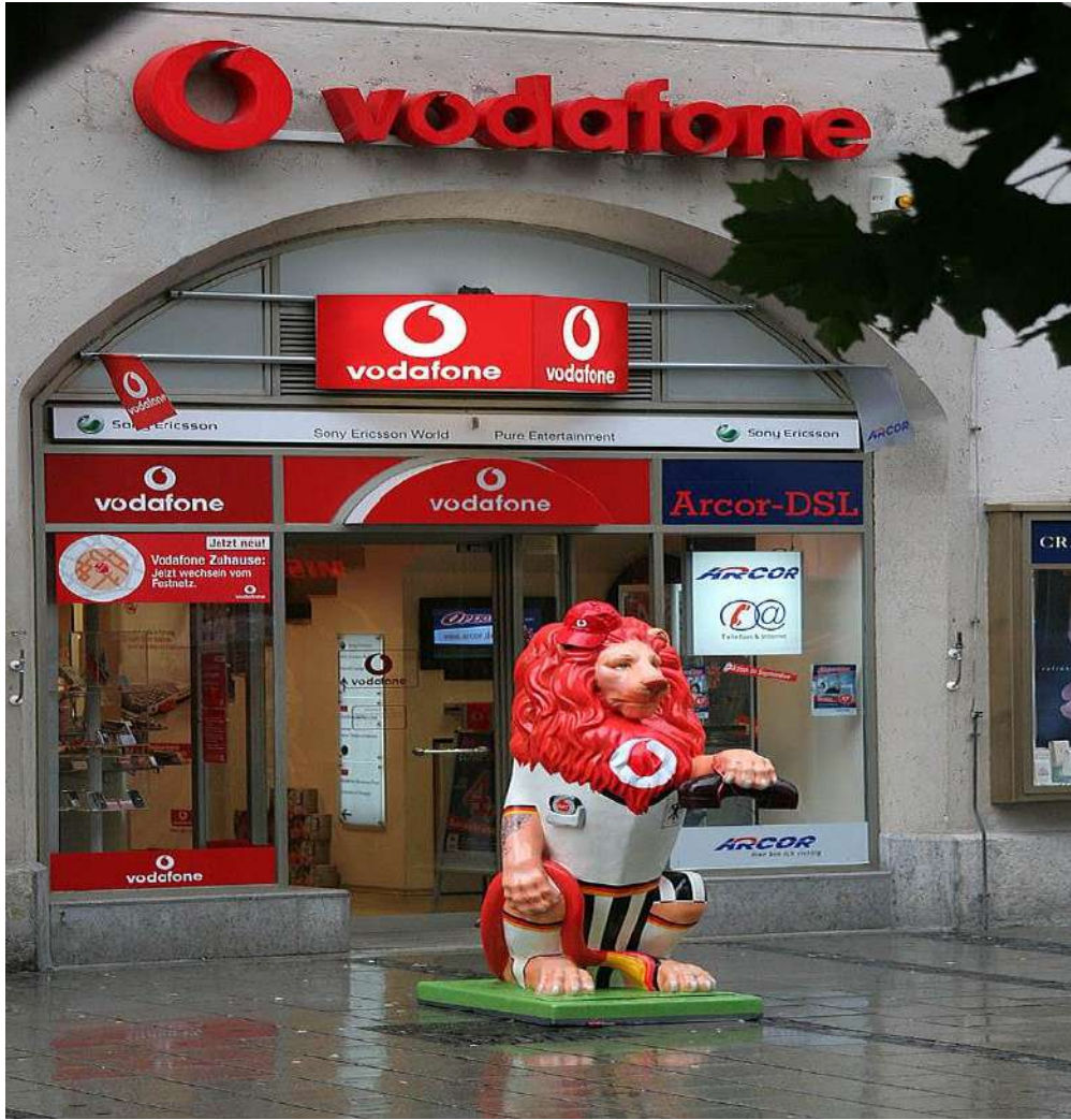
أسد فودافون في إحتفالات موكب الأسد في ميونيخ، ألمانيا

بعد الصفقة، ستظل سويسكوم جزءًا من المجتمع كشبكة شركاء. في ديسمبر 2006، أكملت الشركة الاستحواذ على أسبيكتيف، وهي شركة تكامل أنظمة تطبيقات المؤسسات في المملكة المتحدة، مما يشير إلى (ICT) نية فودافون لتنمية وجودها وإيراداتها بشكل كبير في سوق تكنولوجيا المعلومات والاتصالات.