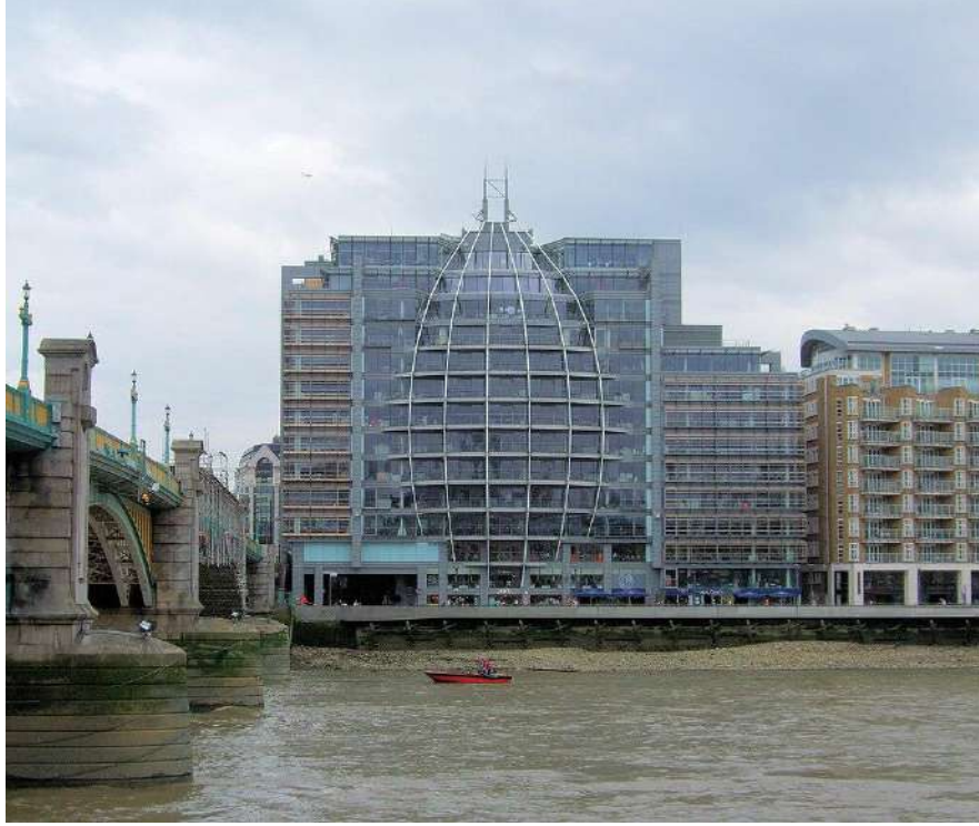
OFCOM منزل ريفيرسايد، بانكسايد، لندن. مقر مكاتب

أوفكوم .هي هيئة تنظيمية للاتصالات في المملكة المتحدة تأسست في أبريل 2003 OfCom أوفكوم