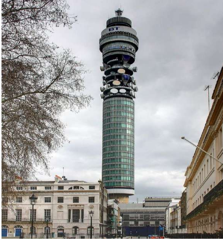
برج بي تي ، أحد أشهر معالم الشركة، بني بين 1961 – 1964

ولتحسين القدرات التكاملية للخدمات السحابية، تعمل شركة بي تي على تعزيز تقنيات الدخول إلى شبكة الإنترنت انطلاقاً من بوابات شبكتها العالمية، والتي بالإمكان نشرها وفقاً للمواقع الإقليمية، وهو الخيار الأفضل للوصول إلى المرافق العامة لسحابة الإنترنت، أو وفقاً للمواقع الأمثل التي بإمكانها الحفاظ على تدفق حركة البيانات، بحيث يصبح الدخول إلى شبكة الإنترنت أقرب ما يكون إلى وجهة حركة البيانات في مواقع سحابية محددة.