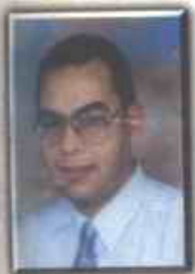
د. احمد خالد توفيق