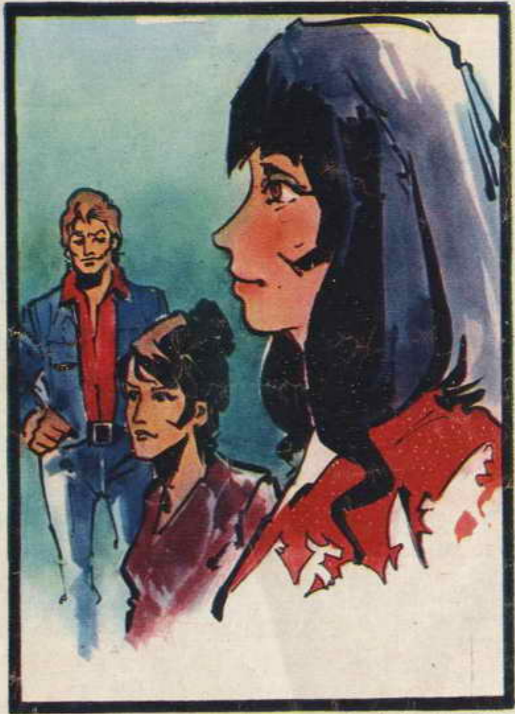
كان الشياطين الثلاثة .. الهام .. زبيدة .. أحمد .. في حالة قلق . لغياب الشيطان خالد .

يسر بمضيق جبل طارق ، إلى المحيط الأطلنطي .. وعندما يقترّب من جزر « أزورس » كان يختفي في مياه المحيط . ظل الشياطين يراقبون حركة الأسهم على الخريطة ، وأخيرا قال رقم ( صفر ) : ( كانت مهمة « خالد » .. هي التوصل إلى معلومات عن شركة النقل البحري ، التي تحدث الانفجارات في ناقلاتها ، خصوصا في تلك المنطقة القريبة من جزر « أزورس » . إن عملاءنا في العالم ، قد أرسلوا لنا رسالات متعددة عن شركة ( أزورس ) للنقل البحري ، التي تصاب ناقلاتها بالانفجارات ، لكن أحدا منهم لم يستطع أن يتوصل إلى سبب هذه الانفجارات ، وهذه كانت مهمة « خالد » .. لقد كانت المدة المحددة له عشرين يوما ، على أن يوالينا بالرسائل ، حتى نضع تصورنا الكامل لما يحدث . إلا أنه لم يعد ، ولم يرسل شيئا .. والمسألة هامة .. سواء بالنسبة لمصير « خالد » .. أو للبضائع العربية التي تنقلها الناقلات وتذهب إلى المحيط .. »