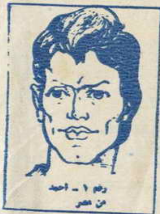
رسم ١ - احد من مصر

انهم ١٢ فتى وفتاة فى مثل معرك كل منهم يمثل بلدا عربيا . انهم يقفون فى وجه الامارات الموجهة الى الوطن العربى . . تعرفوا فى منطقة الكهف السرى التى لا يعرفها احد . . اجادوا فنون القتال . . استخدام المسدسات . . الخناجر . . الكاراتيه . . وهم جميعا يجيدون عدولفات وفى كل مفامرة يشترك خمسة او ستة من الشياطين مما . . تحت قيادة زعيمهم القاضى ( رقم صفر ) الذى لم يره احد . . ولا يعرف حقيقته احد . واحداث مفامراتهم تدور فى كل البلاد العربية . . وتستجد نفسك معهم مهما كان بلدك فى الوطن العربى الكبير .