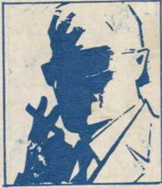
الشياطين ١٢ - صفر

كانت هذه هي المرة الأولى ، التي يدخل فيها الشياطين إلى قاعة الاجتماعات ، وقد نقصوا واحدا . . فمنذ بدأوا مغامراتهم ، وهم دائما ١٣ . ولذلك ، فإنهم عندما أخذوا أماكنهم داخل القاعة ، كان هناك سؤال واحد يتردد في أذهانهم : أين ذهب « خالد » ؟ وماذا حدث له ؟ إنهم يعرفون أن « خالد » قد ذهب في مهمة سرية ، لم يخبرهم بها رقم « صفر » غير أن المدة المحددة له كانت قد انتهت ، وهذا ما جعلهم يتساءلون : ماذا حدث له ؟ إنه منذ خرج في مهمته السرية ، لم يرسل رسالة واحدة ، لا إلى رقم « صفر » ولا إلى الشياطين ، مع أن هذه ليست عادتهم