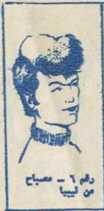
رسم ٦ - مصباح من ليبيا