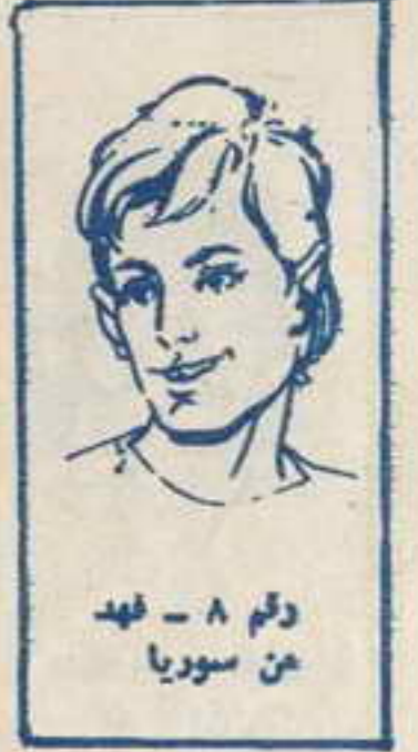
رقم ٨ - عهد من سوريا