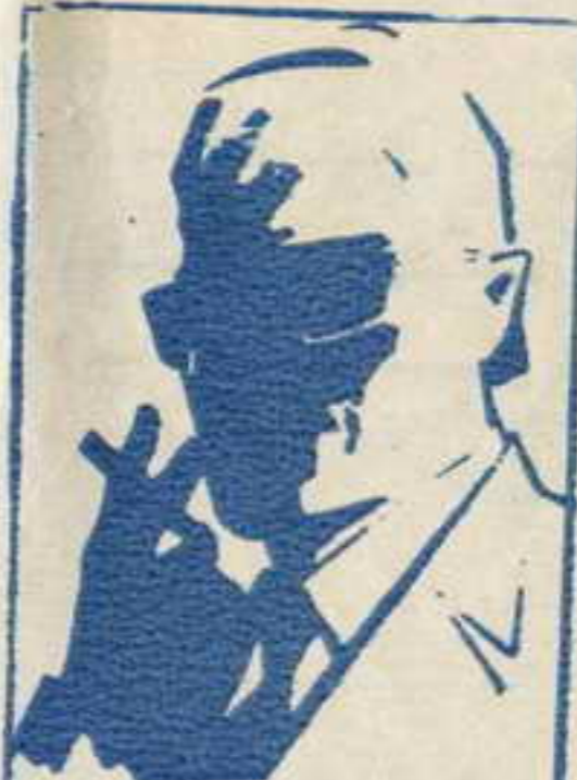
رسم عمر الزعيم القاضى الذى لا يعرف حقيقته احد ..

انهم ١٢ فتى وفتاة فى مثل معرك كل منهم يمثل بلدا عربيا . انهم يقفون فى وجه الامارات الموجهة الى الوطن العربى . . تعرفوا فى منطقة الكهف السرى التى لا يعرفها احد . . اجادوا فنون القتال . . استخدام المسدسات . . الخناجر . . الكاراتيه . . وهم جميعا يجيدون عدولفات وفى كل مفامرة يشترك خمسة او ستة من الشياطين مما . . تحت قيادة زعيمهم القاضى ( رقم صفر ) الذى لم يره احد . . ولا يعرف حقيقته احد . واحداث مفامراتهم تدور فى كل البلاد العربية . . وتستجد نفسك معهم مهما كان بلدك فى الوطن العربى الكبير .