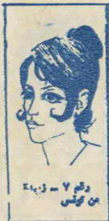
رسم ٧ - زينة من تونس