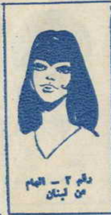
رسم ٢ - الهام من لبنان