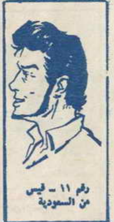
رقم ١١ - فيس من السعودية