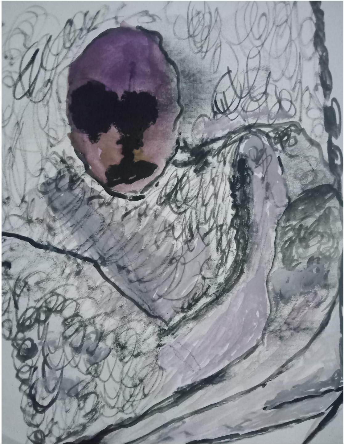
10 شخص لي