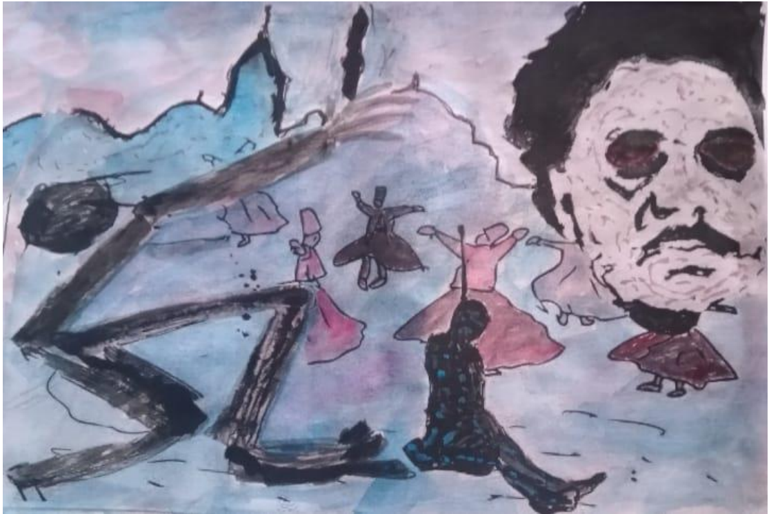
14 أنا وشخوصي