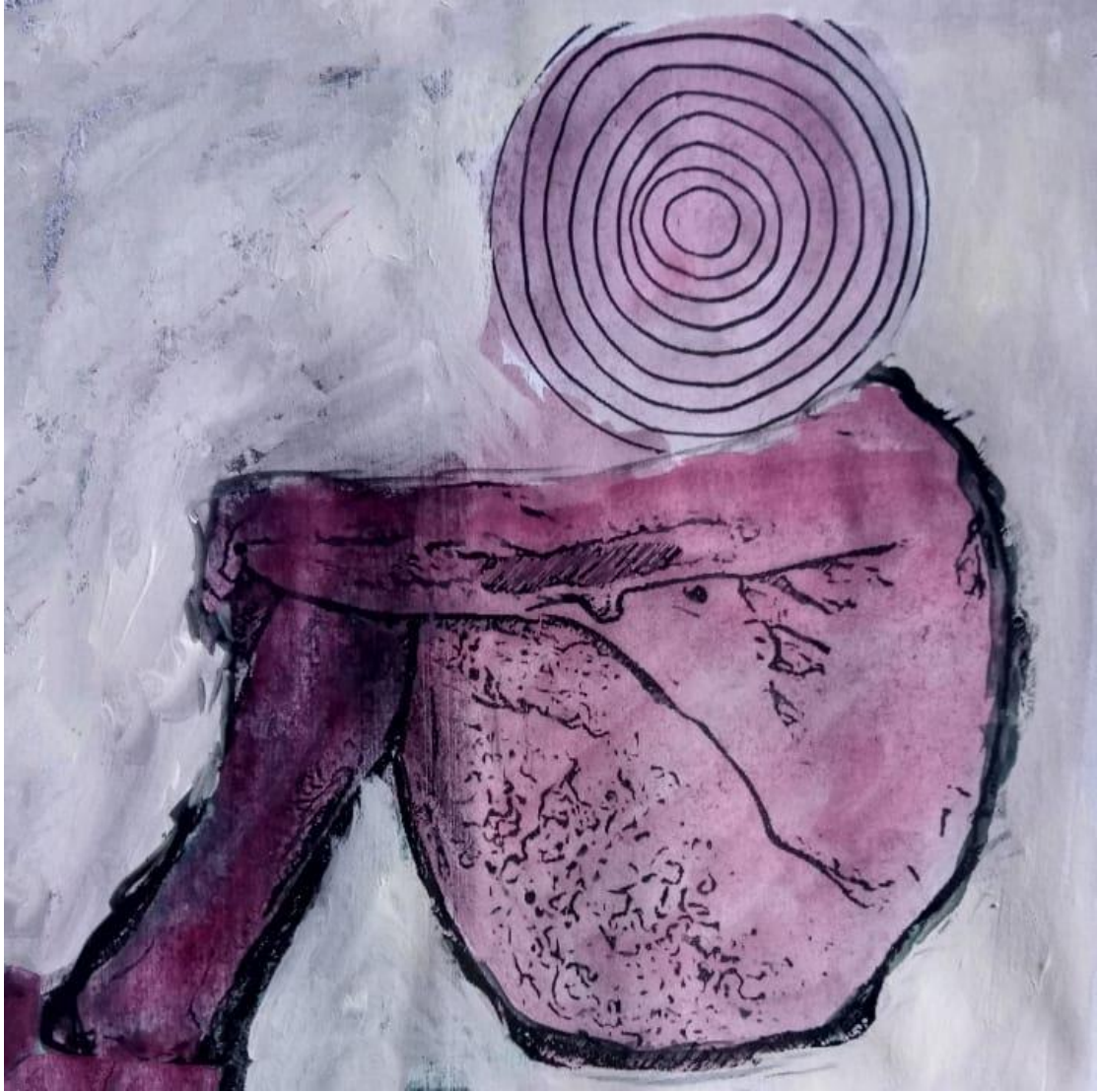
12 أنا المتاهة