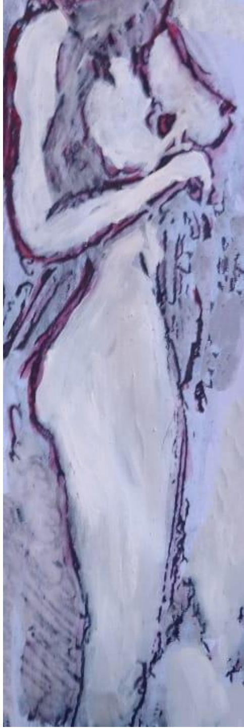
16 معشوقة عارية