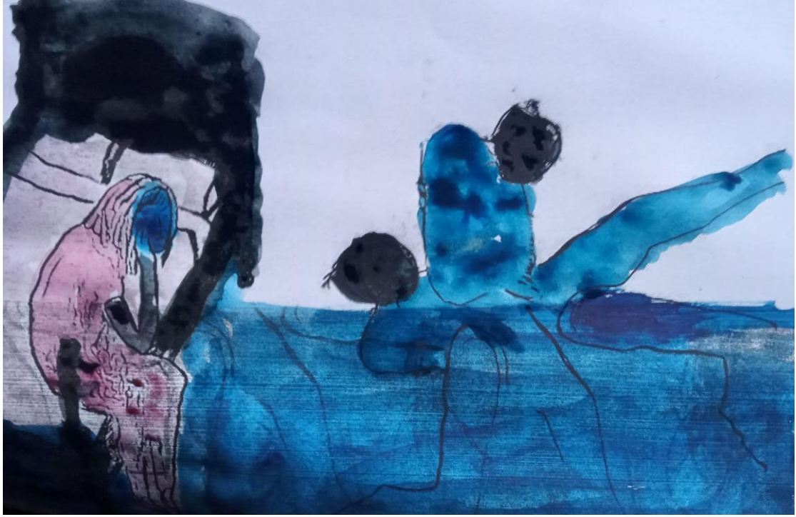
13 غرفة مجنونة