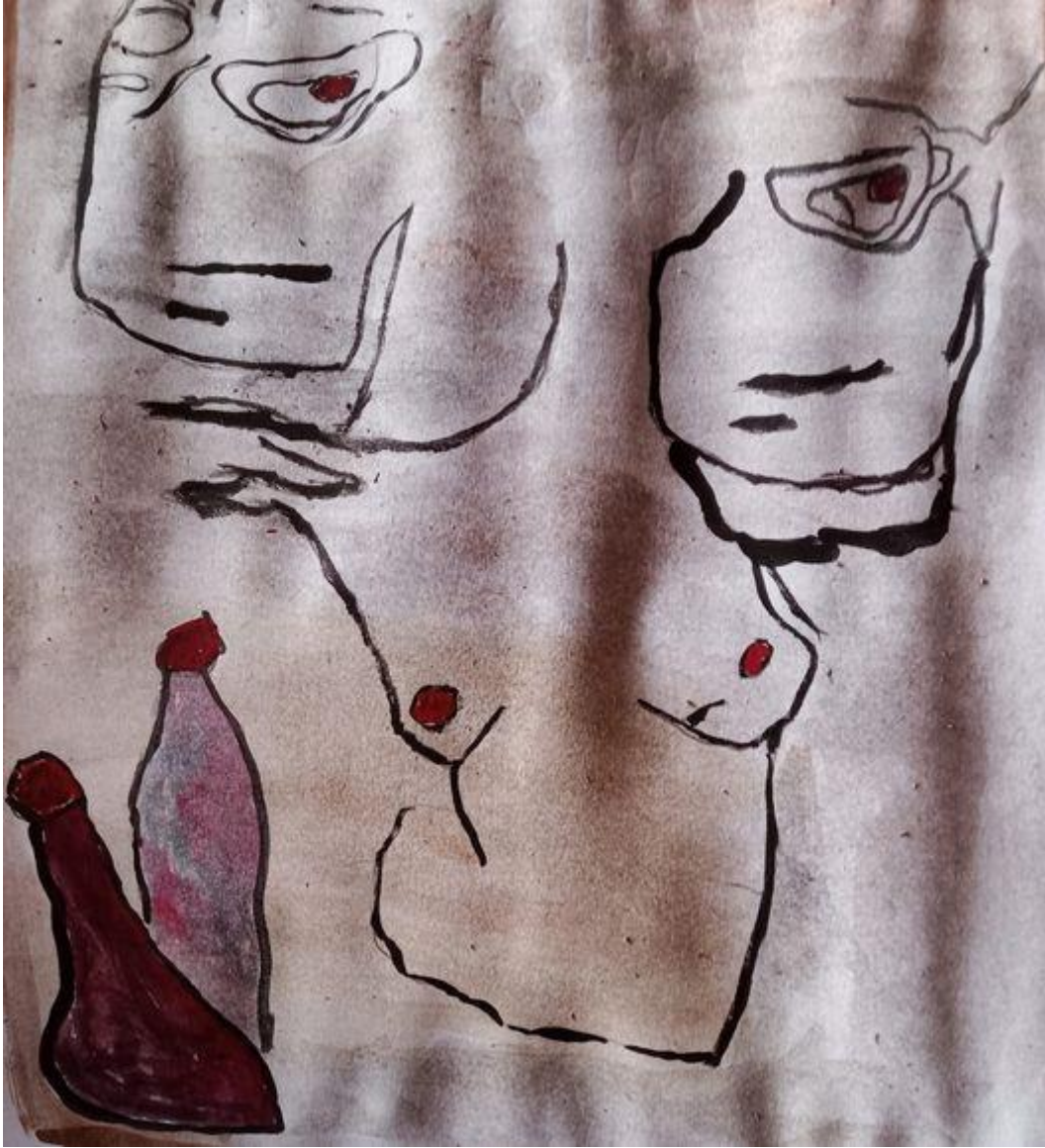
4 بعد العريضة