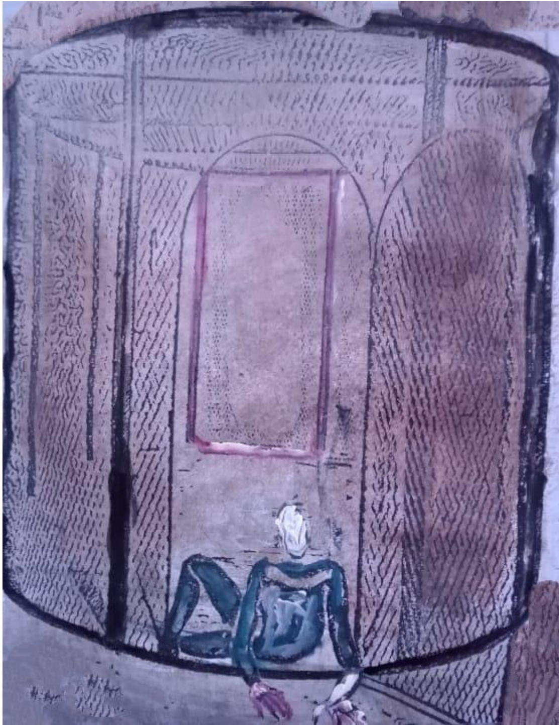
15 الخروج من السجن