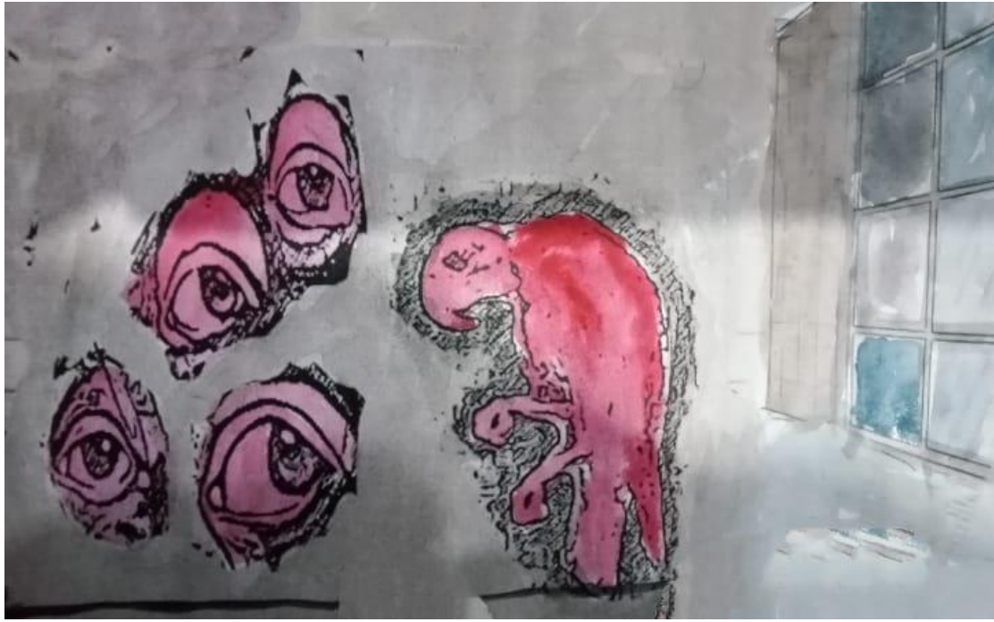
11 غرفة متخيلة