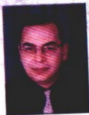
د. أحمد خالد توفيق

كانت تلك المرأة تجلس في فراشها شاخصة البصر إلى الأمام .. لا أستطيع أن أقدر عمرها لكنها ليست مسنة على كل حال .. شعرها منتشر ثائر وثياب المستشفى التي ترتديها قذرة متسخة .. في عينيها تلك النظرة التي تراها مراراً .. نظرة جهاز الكمبيوتر - لو كان شيء كهذا ممكناً - الذي فقد قرصه الصلب .. إنها واعية لكن لا نفع لوعيتها هذا ولا تعرف ما يجب أن تصنعه به ..