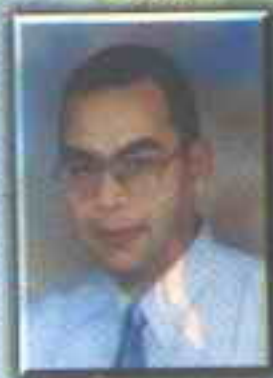
د. أحمد خالد توفيق