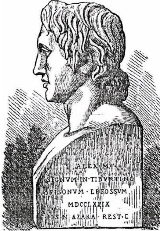
الإسكندر الأكبر وفتوحاته.

طعنة قضت عليه، ففرح الأثينيون بموت فيليب وقرروا جهارًا بمكافأة بوسانياس بإكليل من الذهب جزاءً له على قتل فيليب؛ لأن كل أيلات اليونان كانت ضده.