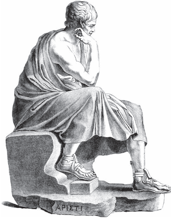
أرسطو الفيلسوف اليوناني.

وهناك شعراء آخرون كثيرون يونانيون بعضهم بعيد الشهرة مثل الأكربون، وقد نظم عن المحبة والخمر، وبندار نظم قصائد عالية، وفيوقرنس وكان ينشد عن الرعاة والراعيات الذين كانوا في بلاده، وغير هؤلاء نظموا قصائد لأجل الألعاب منهم أخيلس وصوفوقليس وبوريديس وغيرهم.