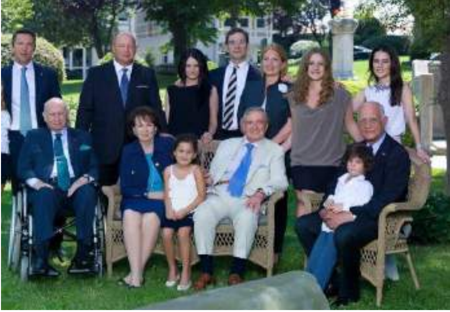
تصدر عائلة كوتش ترتيب قائمة أغنى العائلات التركية للعام 2022

تشارك أغنى العائلات التركية بشكل كبير في دعم الاقتصاد التركي، عن طريق إنشاء شركات ومصانع محلية، وتوفير فرص عمل للشباب.