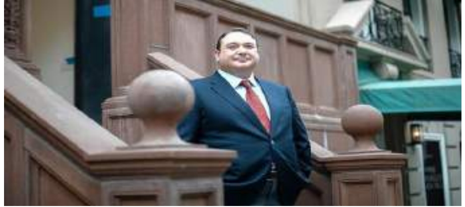
-بينارد أرجاس- من مواليد عام 1971- أرجاس هولدينغ .حجم ثروته 800 مليون دولار- واحتل ضمن قائمة أغنى 100 شخصية تركية المرتبة الـ 38 ويبلغ