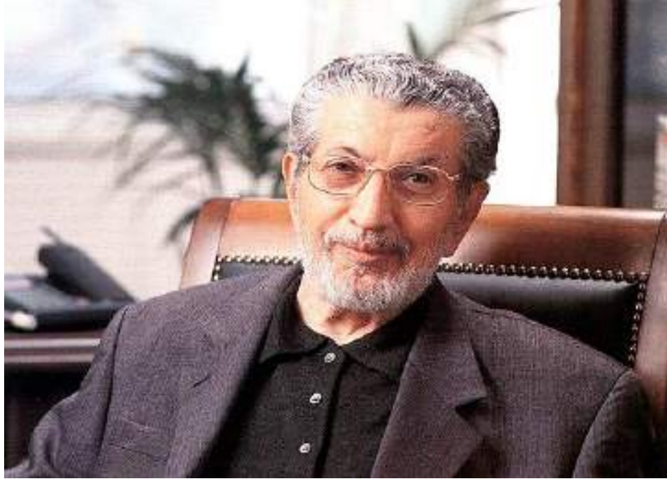
رجل الأعمال والصناعي التركي صبري أولكر