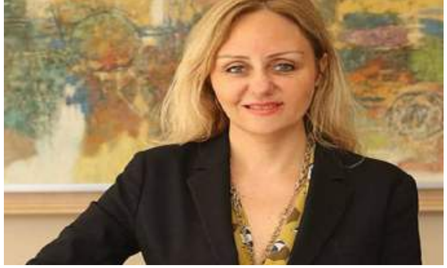
ديمير سابانجي-من مواليد 1972- سابانجي هولدينغ ويبلغ حجم ثروته 650 مليون دولار، وجاء ترتيبه ضمن قائمة أغنى 100 شخصية في المرتبة الـ 54.