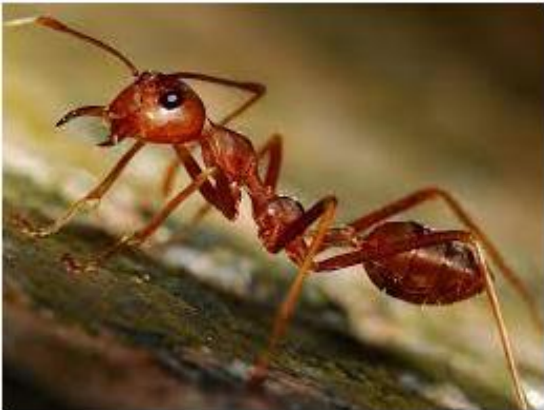
صورة للنمل الناري

North America's red imported fire ant (نملة النار الحمراء) might only be little, but the tiny critters (المخلوق) have a painful bite which causes a burning sensation (إحساسًا حارقًا) – hence (ومن هنا) the name "fire ant", which costs the US millions in veterinary (بيطري) and medical bills (الفواتير الطبية) every year!