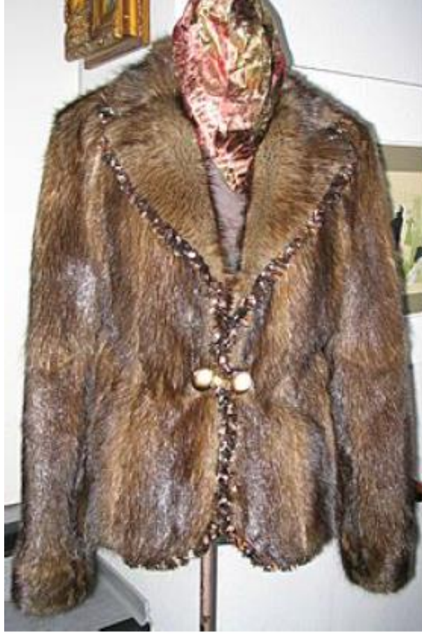
سترة مصنوعة من فرو فأر المسك

Muskrats, like most rodents, are prolific (ولود) breeders. Females can have two or three litters a year of six to eight young each.