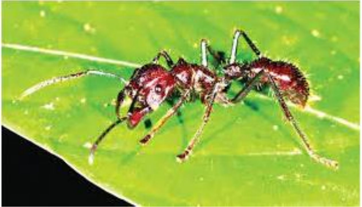
صورة لنملة الرصاص

يقال إن نملة الرصاص لديها اللدغة الأكثر إيلاّمًا في العالم .