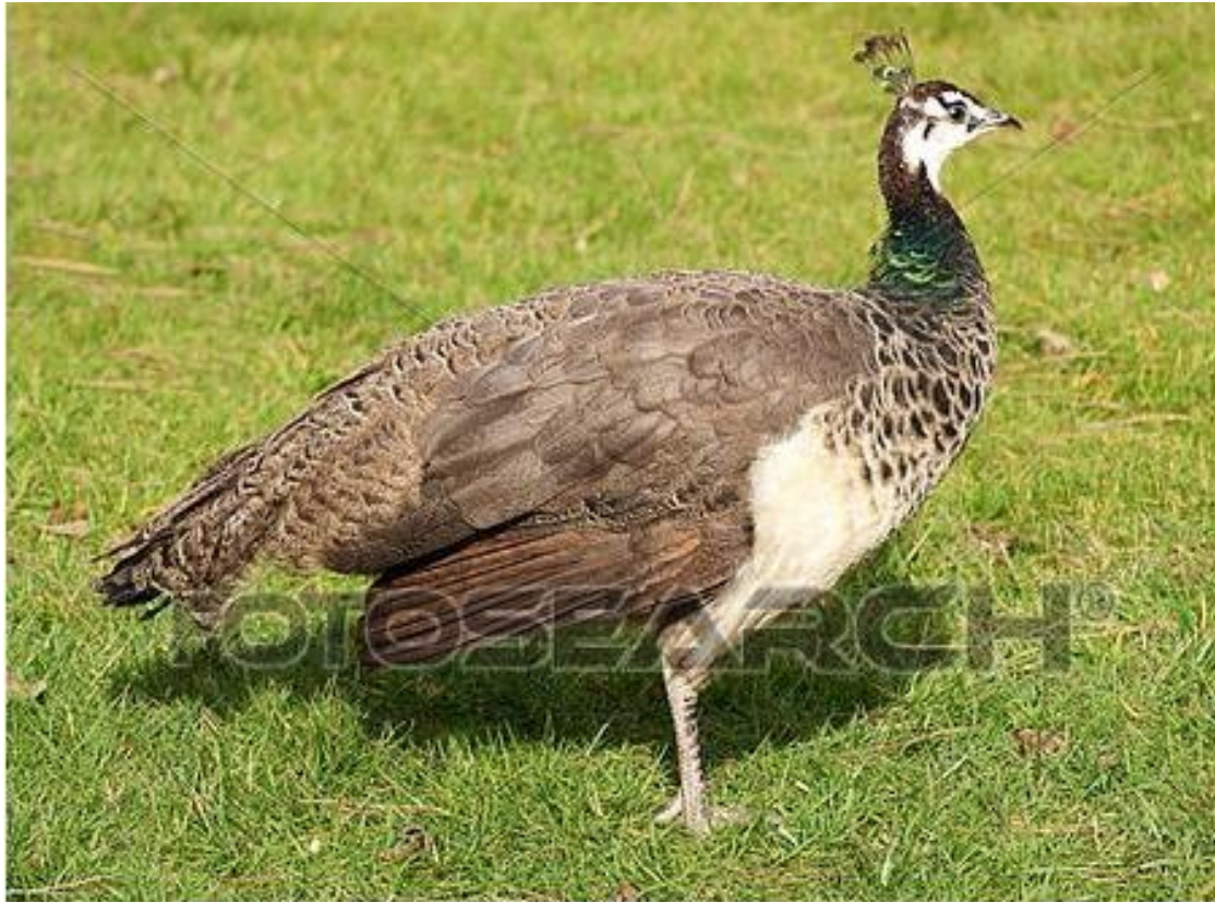
صورة لأنثى الطاووس

يستخدم ذكور الطاووس عروض الريش هذه للحصول على موعد. يبدو أن إناث الطاووس تفضل الذكور الذين تكون لديهم ريش أجمل و أكثر تألقاً .