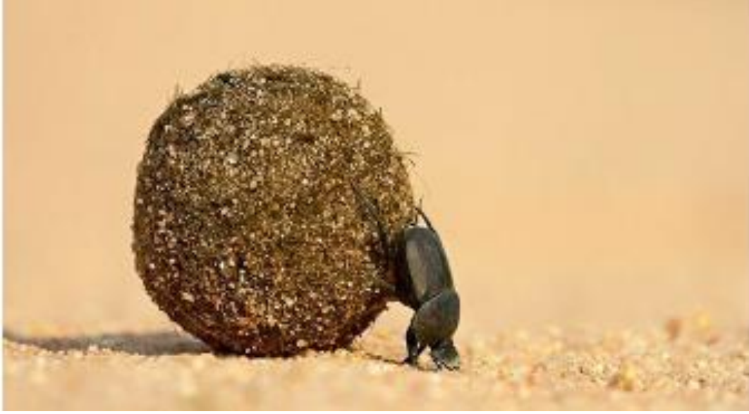
صورة لخنفساء الروث

يمكن لخنفساء لروث إن تسحب 1141 ضعف وزنها وهذا يشبه سحب الإنسان لست حافلات ذات طابقين