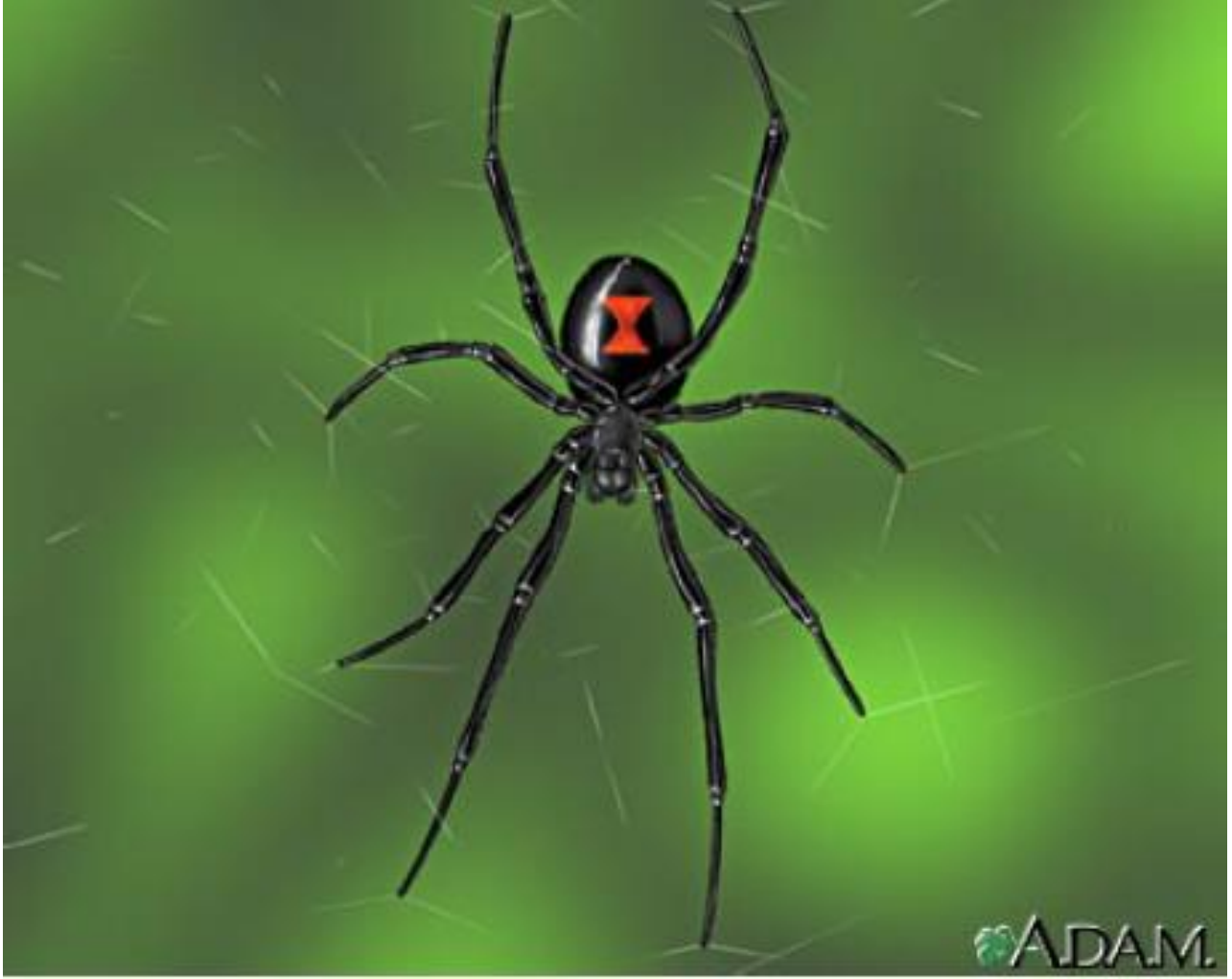
عنكبوت الأرملة السوداء سام للإنسان

Black Widow spider is venomous to people.