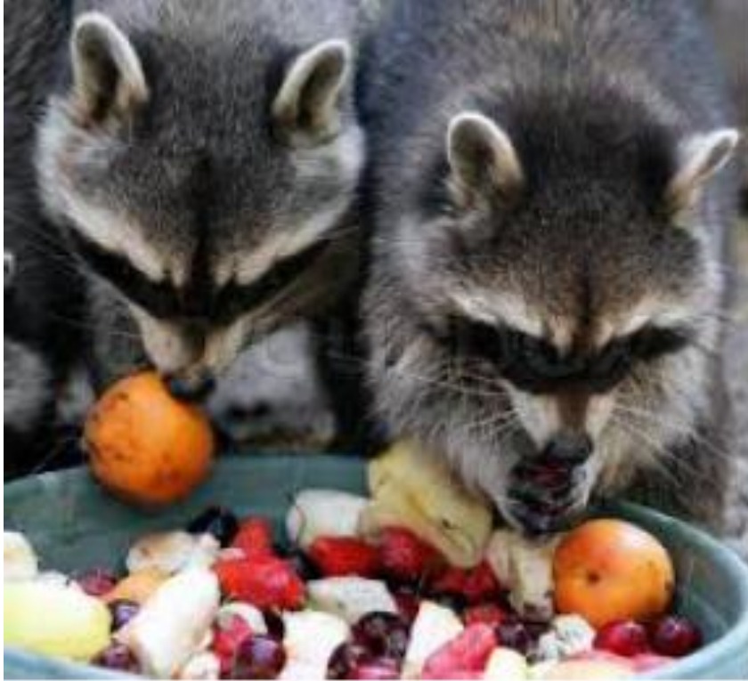
الراكون يحبون مداهمة الخضار

يمكن أن يتورط الراكون في مشاكل مع الناس . إنهم يحفرون في علب القمامة أو صناديق السماد و يأكلون طعام الكلاب وقد يزحفون تحت منزلك أو في الفتحات في العلية الراكون يحبون مداهمة الخضار.