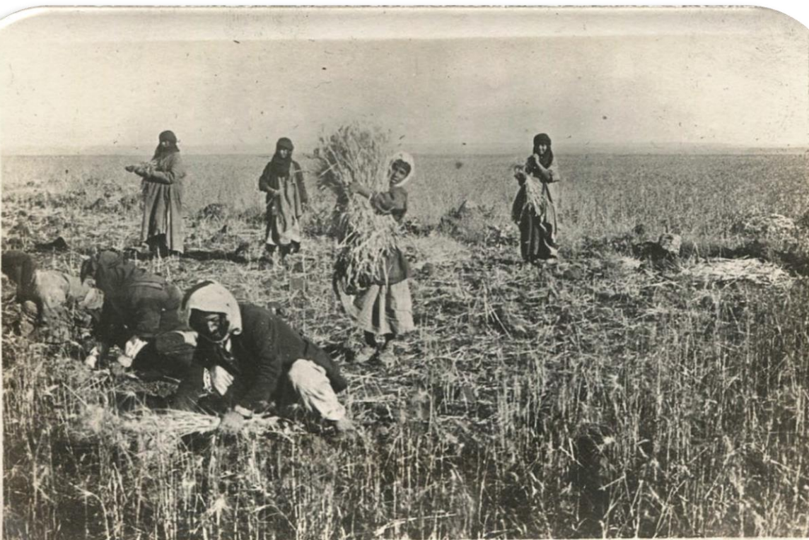
LA MOISSONS DANS LE HAURAN

كما يرى فيها اللباس الحوراني سنة التصوير للرجال والنساء على حد سواء..