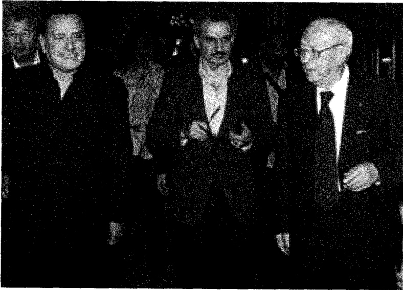
السبسي مع الأمير الوليد بن طلال وبرلسكوني