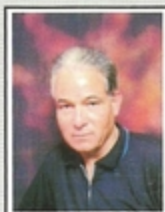
الطاهر بن يوسف

- الحبيب بورقيبة - تضخم الأنا سبب البلية