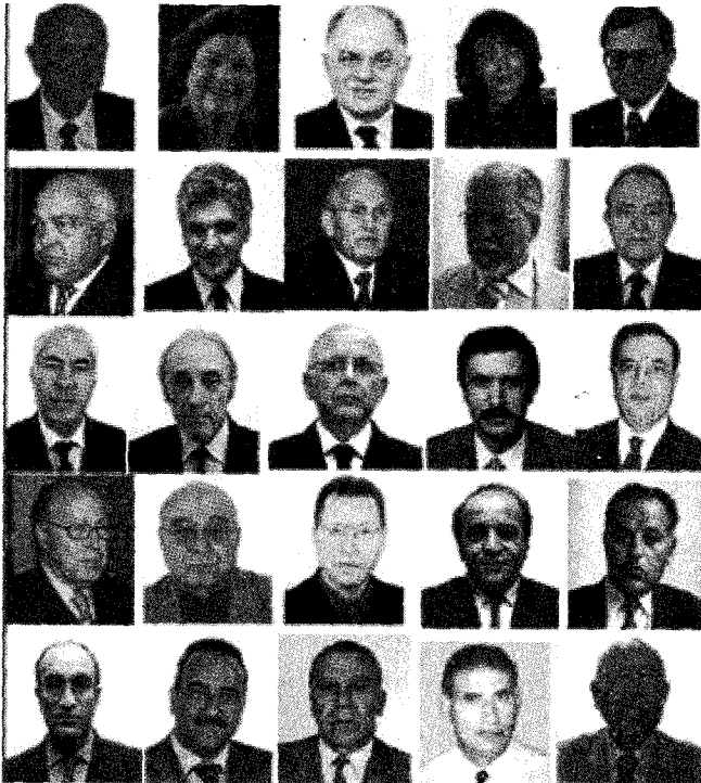
تركيبة حكومة محمد الغنوشي الأولى

ماذا يعني تشكيل حكومة على هذا النحو بعد ثورة إن لم تسل فيها الدماء انهارا فذاك من فضل ربي إلا أن يكون ضحكا على الذقون واستخفافا بإرادة شعب ؟ جاء في تصريح لأحمد المستيري معلقا على هذه الحكومة قوله إنها تعدّ " انتهاكا صريحا لإرادة الشعب، وللمكاسب المشروعة التي حققها خلال الشهر الجاري بجهد المستميت، ودماء شهدائه، والتي كان لها الصدى العميق في العالم أجمع. وفي تصريح آخر دعا المستيري المواطنين إلى أن يرفضوا هذه التركيبة التي ترمز إلى تنصيب رموز النظام السابق من جديد، منتقدا انضمام اطراف من المعارضة ومن اتحاد الشغل (انسحب فيما بعد) لتركيبة هذه الحكومة.