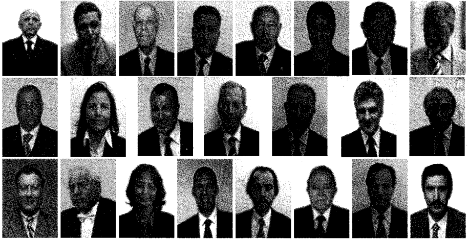
تركيبة حكومة محمد الغنوشي الثانية

رابط المعتصمون بساحة القصة الى يوم 4 مارس 2011، لم يغادروها إلا بعد ان اعلن الرئيس المؤقت فؤاد المبرع عن استجابته لأغلب مطالبهم، متوعدين بالعودة إن لزم الأمر تحت شعار " وإن عدتم عدنا ".